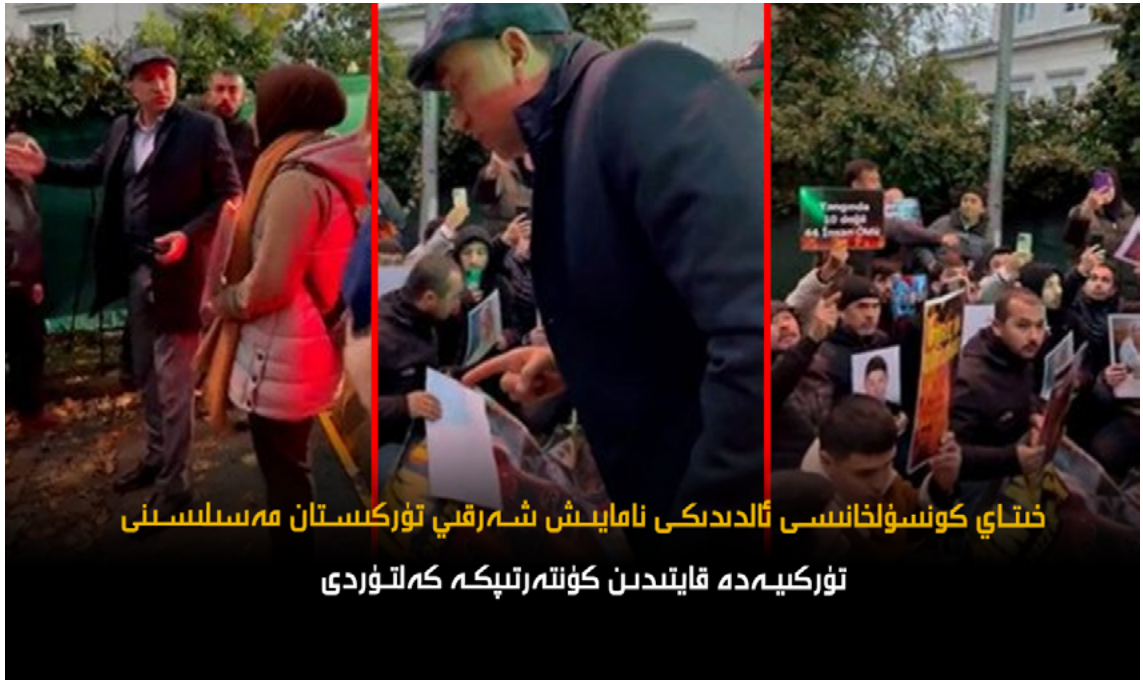
خىتاي كونسۇلخانىسى ئالدىدىكى نامايىش شەرقىي تۈركىستان مەسئۇلىنى

ئىدارىسى كېلىپ ئۆزى ئۆچۈرسۇن» دېگەن. ئۆي ئىگىسى ئوتنى سۇ چېچىپ ئۆچۈرىدىغانلىقى ئېيتقان بولسىمۇ، بىراق ئىككى ئەمەلدار ئۇنىڭ ئوت ئۆچۈرۈشىگە رۇخسەت قىلماي، بىنادىن مەجبۇرىي چۈشۈرگەن. ئەسلىدە ئوتنى سۇ چېچىپ ئۆچۈرگىلى بولىدىغان بولۇپ، خادىملار ئوت تۇتاشقان ياتاق ئۆيىنىڭ ئىشىكىنى تاقىۋەتكەن. ئوت تۇتاشقان ئۆي 15-قەۋەتتە بولۇپ، بىنادىن پەشتاق ئارقىلىق چۈشىدىغان ئىشىك سىم ئارقىلىق تاقىۋېتىلگەن بولغاچقا، خادىملار بىنانىڭ توكىنى ئۆچۈرمەستىن، ئۆيلەردىكى كىچىك بالىلارنى لىفىت ئارقىلىق بىنادىن ئېلىپ چۈشۈپ كەتكەن. پەقەت ئەمەلدارلار بىلەن بىنادىن چۈشۈپ كەتكەن كىشىلەر ساق قالغان. ھەتتا ئىككى ئەمەلدار ئوت تۇتاشقان ئائىلىنىڭ ئۇدۇل قوشنىسىنىڭ ئىشىكىمۇ ئېچىۋېتىلمىگەن. نەتىجىدە 15-قەۋەتتىكى ئوت تۇتاشقان ئائىلىنىڭ ئىككى يان قوشنىسىنىڭ ئۆيى كۆيۈپ كۈلگە ئايلانغان. ئوت 15-قەۋەتنىڭ ئاستىدىكى ئىككى قەۋەتكە تۇتاشقاندىن باشقا، ئۈستى قەۋەتتىن ئىككى ئۆيۈمۇ كۆيۈپ كۈلگە ئايلانغان. بىنانىڭ ئەڭ ئۈستىدىكى ئىككى