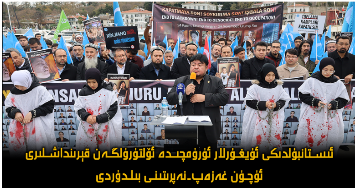
ئىستانبۇلدىكى ئۇيغۇرلار ئۈرۈمچىدە ئۆلتۈرۈلگەن قېرىنداشلىرى ئۈچۈن غەزەپ-نەپرەتنى بىلدۈردى

بىلدۈرۈلۈشىچە، ئەگەر بۇ ئىككى ئۇيغۇرغا دائىرىلەر گۇمان قىلغىنىدەك جىنايەت بېكىتىلسە، قەستەن ئادەم ئۆلتۈرۈش ۋە پارتلاتقۇچ دورا ساقلاش قاتارلىق جىنايەتلەر بىلەن ئەيىبلىنىپ، ئۆلۈم جازاسىغا ھۆكۈم