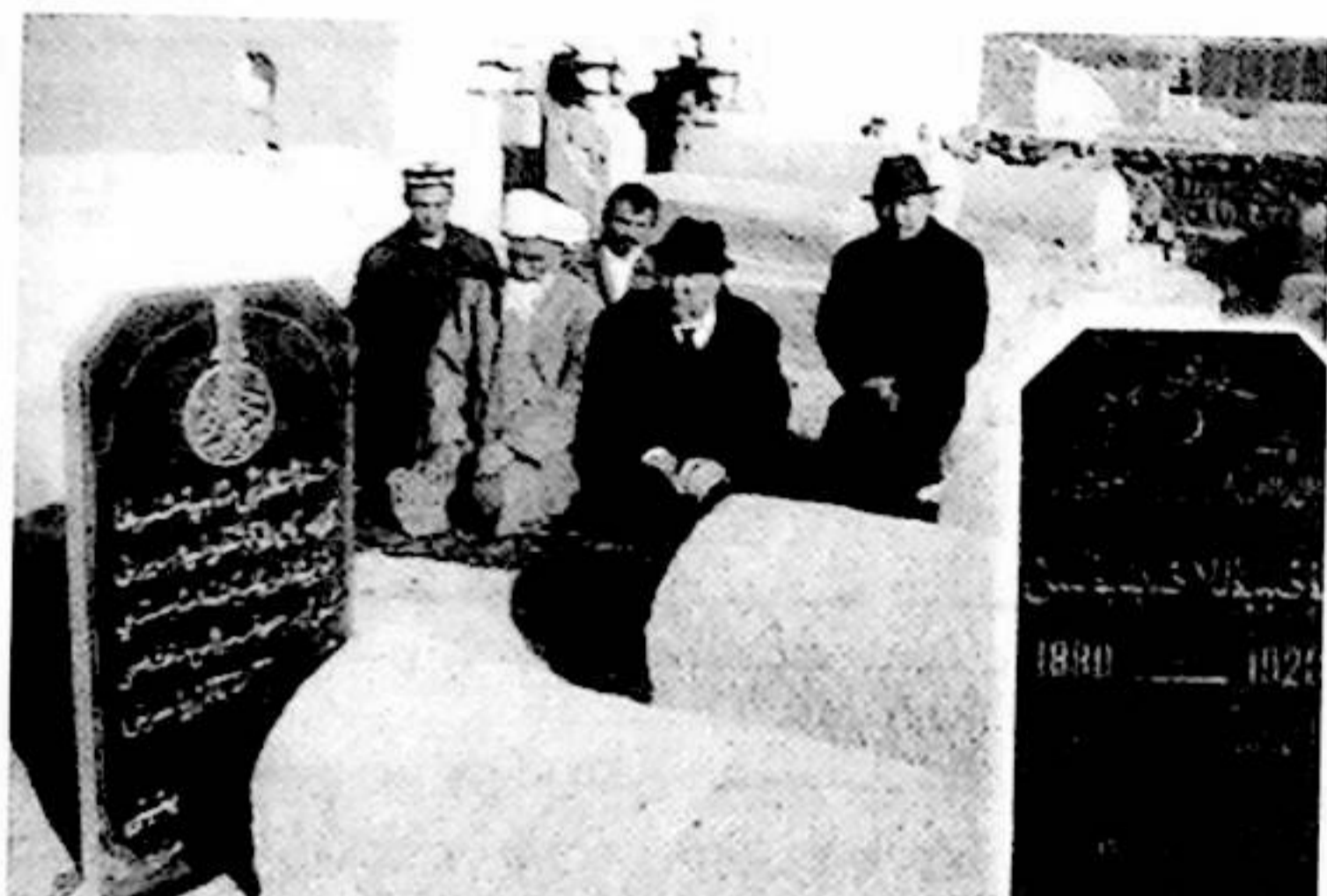
مۇھىبۇللا ئەپەندىنىڭ تۇرپان ئاستانىدىكى قەبرىسى

سىزنى كېتىدۇ دەپ، ھەممىمىز خاپا، شۇنداقتىمۇ، ئىپتىدائىي بولمىغاندىن كېيىن سىزنى بۇ يەرلەردە تۇتۇپ قېلىش يەنىلا توغرا ئەمەس. يەنىلا ئۆز يۇرتىڭىزغا يېنىپ كەتكىنىڭىز سىز ئۈچۈن ئوبدانراق چىغىۋا. ئەمدى سىزنى يولغا سېلىپ قويۇش — بىزلىرىگە پەرز. بىزلىرىدىن رازى بولۇڭ! بىزلىرى سىزنى قانداق رازى قىلىشنى بىلىمەي خىجىل...» دېگەن. گۈلەندەم ئابىستاي ئاستانىدىن قايتىش ھارپىسىدىكى ئىشلارنى خاتىرىسىدە مۇنداق يازغان: «ئەتىلىككە كېتىمىز دېگەن كۈنى مەن ئوقۇغۇچىلىرىمنى ئېلىپ قەدىرلىك دوستۇمنىڭ — مەرھۇمنىڭ قەبرىسىگە خوشلىشىشقا باردىم. ئۇ يەردە ئەلپەتتە غوجام ھازىرىدا تۇرغۇچى قارىي قۇرئان ئوقۇدى. ئۇنىڭغا سەدىقە بەردىم ۋە ئۇنىڭ بۇنىڭدىن كېيىنمۇ ھېيت-ئايىم كۈنلىرىدە مۇئەللىمگە ئاتاپ دۇئا ئوقۇپ تۇرۇشىنى ئوتۇندۇم. ئۇنىڭدىن كېيىن مەرھۇمنىڭ قەبرىسىگە كۆز ياشلىرىمنى ئېقىتىپ يىغلىدىم. يىراقتىكى يۇرتقا ئىككى بالامنى ئەگەشتۈرۈپ، قانىتى سۇنغان قۇش ئوخشاش كېتىدىغانلىقىمنى زارلىنىپ-مۇڭلىنىپ سۆزلىدىم، مەڭگۈگە خوشلاشتىم... مەن يىغلاپ-قاقشاپ ئۆيگە يېنىپ كەلگەندە، ئۇ يەرگە خوتۇن-قىزلار، ئوقۇغۇچىلار توشۇپ كېتىپتۇ. داستىخان سېلىپ تۇر-لۈك تائاملارنى تىزىپ، چاي ھازىرلاپ مېنى كۈتۈپ تۇرغان ئىكەن. ئۇلارنىڭ بۇنچىلىك كۆركەم مۇئامىلىسىگە بىر ياق-تىن ھەيران قېلىپ ئەجەب-لەنگەن بولسام، يەنە بىر ياق-تىن ئوڭايىزلىنىپ ئويلىنىپ كەتتىم.»