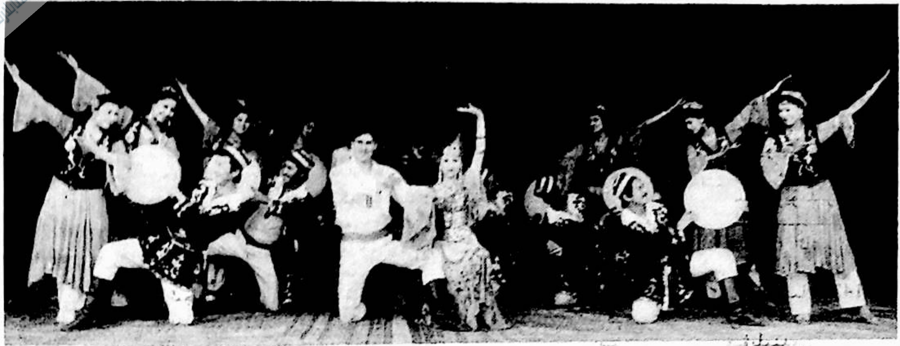
شىنجاڭنىڭ 1995 - يىللىق مەدەنىيەت - سەنئەت خىزمىتىدىن ئۇچۇرلار