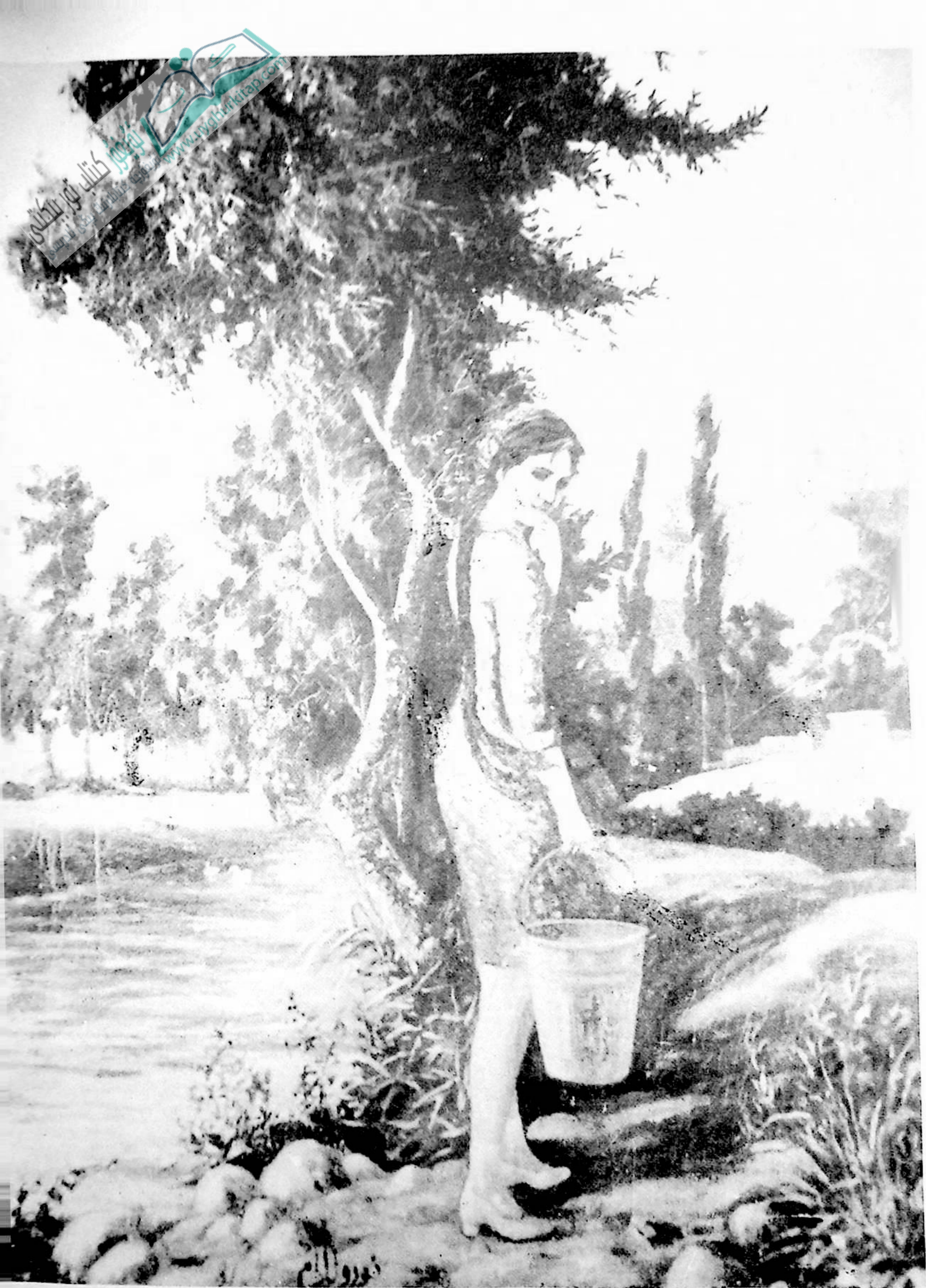
تورۇللام ئىبراھىم سىزغان