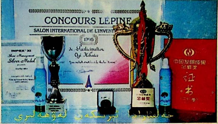
خەلقئارالىق ئىنسانىيەت ئىنقىلابىغا قاتناشقان نەۋەھلىرى