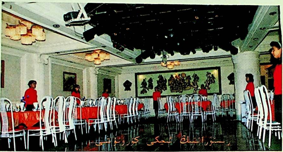
رېستوراننىڭ ئىچكى كۆرۈنىشى

تەڭرىتاغ رېستورا- نى — شە ھېرىمىزد- كى ھەر مىللەت خەلق- نىڭ كۈنساپىن ئېشىپ بېرىۋاتقان مەنئى تۇرمۇش - مەزمۇنىنى بېيىتىش، سوتسىيالىستىك بازار ئىگىلىكىگە يۈزلىنىش، ئەلا مۇلازىمەت قىلىش ۋە خېرىدارلارنىڭ ئېھتى- ياجىنى بىرىنچى ئورۇنغا قۇيۇش ئاساسىدا قۇرۇل- غان. 750 مىڭ يۈەن مەبلەغ سېلىنغان. بۇ رېستوراننىڭ كۆلىمى 360 كۋادرات مېتىر بولۇپ، داڭلىق سەنئەت- كارلار، يۇقىرى دەرىجە- لىك ئاشپەزلەر، ياخ- شى تەربىيەلەنگەن كۈتكۈچىلەر قىزغىن مۇلازىمىتى بىلەن ھەر ۋاقىت مېھمانلارنى كۈتۈش- كە تەييار.