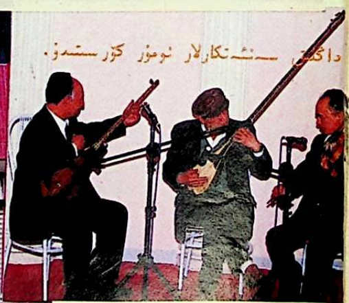
داڭلىق ئىشەنكارلار نومۇر كۆرسىتىدۇ.

ئورنى: غالىبىيەت يولى 59-نومۇر (شىنجاڭ داشۇنىڭ ئۈدۈلىدا) باش دېرېكتور، قانۇنىي ۋەكىلى: ھەسەن ئالاقلىشىش تېلېفون نومۇ- رى: 2871611, 2871616 چاقىرغۇ: 31097-126, 181.23237