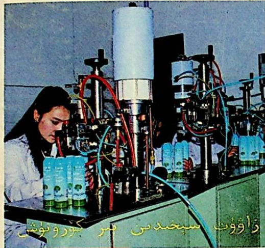
زاۋۇت سېخىدىن ئىس كىرگۈزۈش