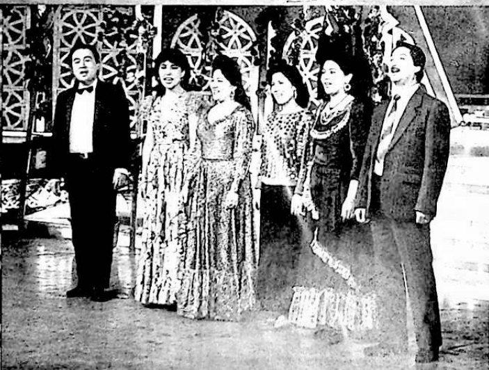
ئەملەھام جىلان فوتوسى