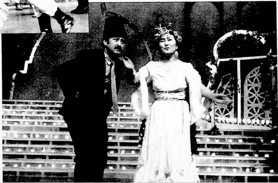
تۇردى ئېلىم فوتوسى

ئۈرۈمچى شەھەرلىك ئەدەبىيات - سەنەت تەنھەرىكەت بىرلەشمەسى بىلەن شىنجاڭ تېلېۋىزىيە ئىستانسىسى بىرلەشمە ئۆتكۈزۈ- گەن «كۆكلەم بەزمىسى» دىن كۆرۈ- نۇشلەر