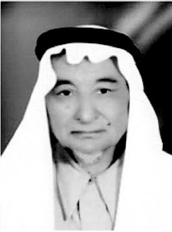
مۇھەممەد ئەمىن ئىسلامى