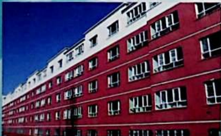
بۇ شىركەت ئىشلىتىش ئالدىدا تۇرغان رايونى.