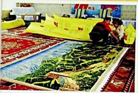
سانئۇجى خادىملار بېيجىڭلىق خېرىدارلار بۇيرۇتقان گىلەملەرنى ئوراش مەشغۇلاتىدا.

بۇ شىركەت ۋىلايىتىمىزدىن 1000دىن ئارتۇق ئېشىنچا ئەمگەك كۈچلىرىنى ئىشقا ئورۇنلاشتۇرۇپ، جەمئىيەتنىڭ بېسىمىنى يېنىكەتتى. 2006 - يىلى بۇ شىركەت ئىشلەپچىقارغان «خوتەن قاشتېشى» ماركىسىدىكى تۈرلۈك گىلەملەر «شىنجاڭنىڭ داڭلىق مەھسۇلاتى» ماركىسىغا ئېرىشتى ۋە ئامېرىكا، ئەنگلىيە، گېرمانىيە، فرانسىيە، ئىتالىيە، ياپونىيە، شىياڭگاڭ قاتارلىق 20 نەچچە دۆلەت ۋە رايونغا ئېكسپورت قىلىندى.