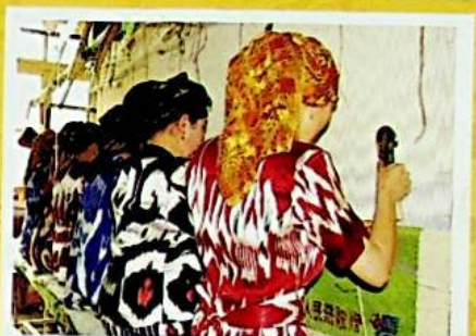
كۆزنى قاماشتۇرىدىغان سەنئەتلىك گىلەملەر مۇشۇنداق بارلىققا كېلىدۇ.