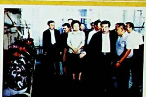
2005 - يىلى 9 - ئاينىڭ 24 - كۈنى ج ك پ مەركەزىي كومىتېتى سىياسىي بىوروسىنىڭ ئەزاسى، گوۋو - يۈەننىڭ مۇئاۋىن زوكلىسى خۇي لياڭيۈ بۇ شىركەتنى ئېكسكۇرسىيە قىلدى.