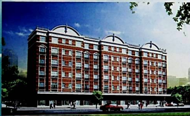
بۇ شىركەت ئىشلىتىش ئالدىدا تۇرغان خوتەن شەھىرى كۈنپېك باغچا ئولتۇراق رايونىنىڭ قۇرۇلۇش مودىلى.