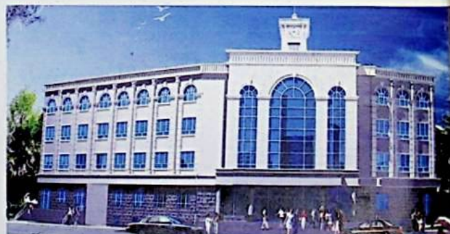
بۇ شىركەت ئىشلىتىش ئالدىدا تۇرغان چىرا ناھىيىسىگە تامان تەرىز كوپىراتىپ بىرلەشمە بىناسى ئۈنۋېرسالى بىناسى.