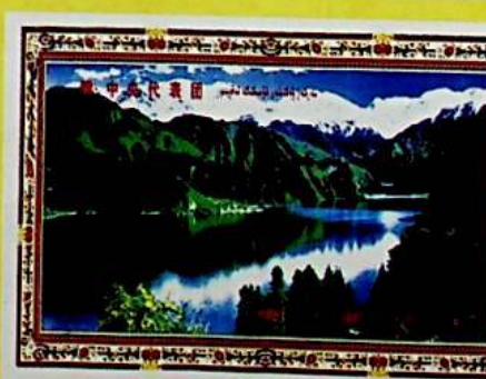
ئاپتونوم رايون قۇرۇلغانلىقىنىڭ 50 يىللىقىغا سوۋغا قىلىنغان سەنئەتلىك گىلەم «بوغدا كۆلى مەنزىرىسى».