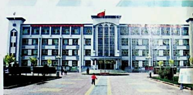
شىركەت ئىشلىتىش چىرا ناھىيىسىگە 1 - ئوتتۇرا مەكتەپنىڭ ئوقۇتۇش بىناسى.