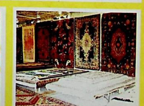
گىلەم ئەۋرىشىكىسى كۆرگەزمە زالى.