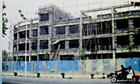
بۇ شىركەت ئىشلىتىش ئالدىدا تۇرغان چىرا ناھىيىسىگە مېھمانخانا بىناسى.