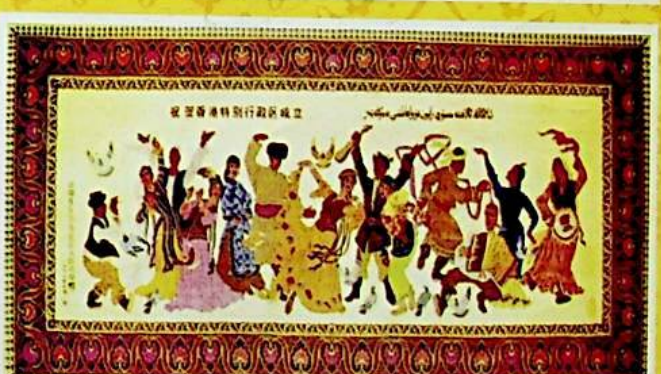
شىياڭگاڭنىڭ ۋەتەن قوينىغا قايتىپ كەلگەنلىكىنى تەبرىكلەپ توقۇلغان سەنئەتلىك گىلەم «تەڭرىتاغدىكى شادىمانە كۆي».