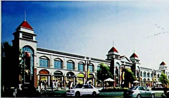
بۇ شىركەت ئىشلىتىش ئالدىدا تۇرغان چىرا ناھىيىسىگە جىن شىن ئولتۇراق رايونى قىزىل يۇلتۇز سودا شەھەرچىسى.

شىركەت قۇرۇلغان 5 يىلدىن بېرى چىرا ناھىيىسىنىڭ مائارىپ، مەدەنىيەت، شەھەر يول قۇرۇلۇشى قاتارلىق ئۈزلۈكسىز ساھەلىرى ئۈچۈن 500 مىڭ يۈەندىن ئارتۇق پۇل ئىشەنچ قىلىپ جەمئىيەتنىڭ ھەر ساھە ئىشلىرىدىن ئۆز ساخاۋىتىنى ئايىمىدى. نۆۋەتتە، بۇ شىركەت ۋىلايەتتىكى ئىككى ھەر ساھە، ھەر كەسىپتىكى دوستلار بىلەن زىچ ھەمكارلىشىپ، دەۋىر بىلەن تەڭ ئىشلىشىپ، ئىشخانىدا ھاياتى كۈچىنى تېخىمۇ ئۇرغۇتۇپ، گۈزەل كېلىچەك ياردەم ئىشلىرىنى ئىشلىتىش ئۈچۈن ئۆزلۈكسىز تىرىشچانلىق كۆرسەتكەن.