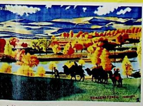
بۇيرۇتۇپ توقۇلغان سەنئەتلىك گىلەم «لوپنۇر كۆلى».