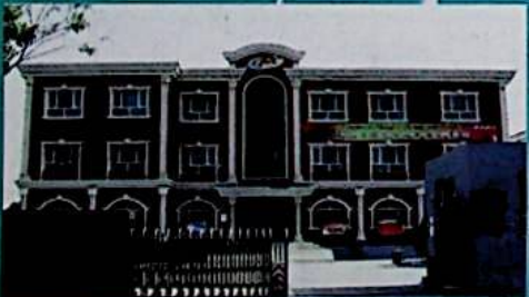
بۇ شىركەت ئىشلىتىش چىرا ناھىيىسىگە كېسەللىك ئالدىنى ئېلىش، كونترول قىلىش مەركىزىنىڭ خىزمەت بىناسى.