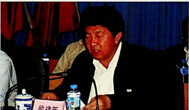
خوتەن ناھىيىلىك پارتكومنىڭ شۇجىسى يولداش خوجىنەن يىغىننىڭ خوتەن ناھىيىسىدە چاقىرىلغانلىقىنى تەبرىكلەپ سۆز قىلدى.