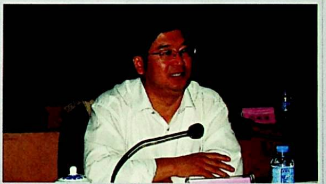
خوتەن ۋىلايەتلىك پارتكوم تەشۋىقات بۆلۈمىنىڭ دائىمىي ئىشلارغا مەسئۇل مۇئاۋىن باشلىقى يولداش ۋاڭ جىيەنجۈن يىغىندا رىياسەتچىلىك قىلدى.