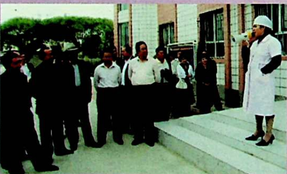
يىغىن ئەھلى سوتسىيالىستىك يېڭى يېزا قۇرۇش تەلپى بويىچە سېلىنغان خوتەن شەھەر شورباغ يېزىلىق دوختۇرخانىسىدا.