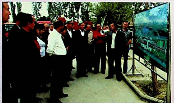
يىغىن قاتناشچىلىرى خوتەن ناھىيە لايىقا ئوتتۇرا مەكتىپىنىڭ تەرەققىيات ئەھۋالىنى ئېكسكۇرسىيە قىلماقتا.