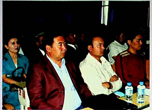
يىغىن مەيدانىدىن بىر كۆرۈنۈش