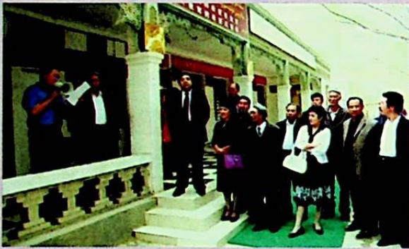
يىغىن قاتناشچىلىرى لوپ ناھىيە بۇيا يېزا ئوتتۇرا مەكتىپىدە.