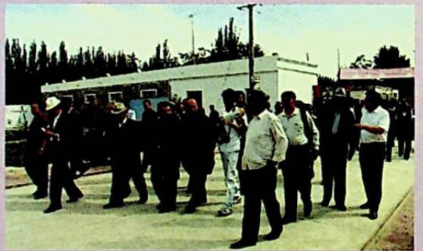
يىغىن قاتناشچىلىرى خوتەن ناھىيە لايىقا يېزىسىدىكى شاۋ-شەك يېڭى كەنتىدە ئەھۋال ئىگىلىمەكتە.