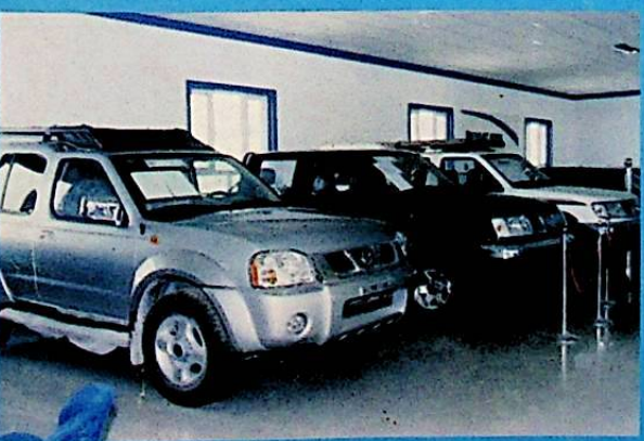
شىركەت كىرگۈزگەن ئالىي تىپلىق ماشىنىلار