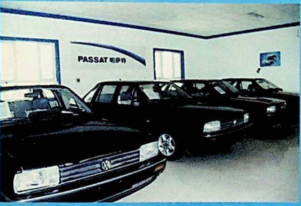
شىركەت كىرگۈزگەن «ساتانا» ماركىلىق ماشىنىلار