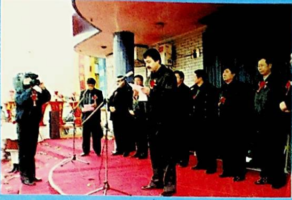
ۋىلايەت رەھبەرلىرى شىركەتنىڭ قۇرۇلۇش مۇراسىمىدا