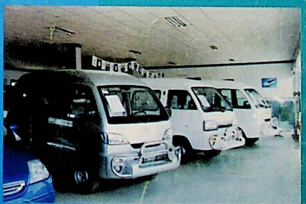
شىركەت كىرگۈزگەن «سۆڭ خۇا جىياڭ» ماركىلىق كىچىك تىپتىكى مېنىبوسلار