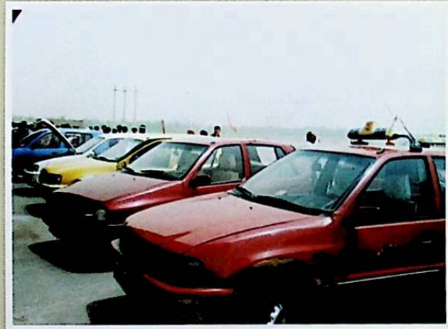
يورۇققاش دەرياسى بويىدىكى خوتەن ۋىلايەتلىك ئوتتۇرا ئا- سىيا ماشىنا ئېلېكتىرچە كلىك شىركىتىنىڭ كونا ماشىنا با- زىرىدىكى خېرىدار كۈتۈۋاتقان ماشىنىلار