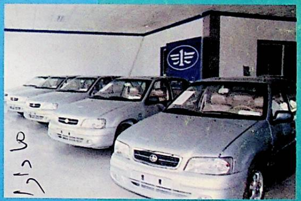
شىركەت كىرگۈزگەن «شالى» ماركىلىق ماشىنىلار