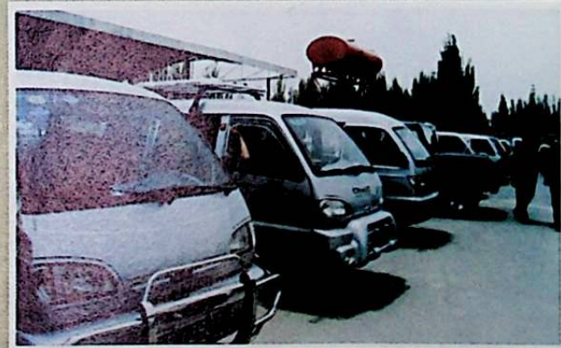
كونا ماشىنا بازىرىدىكى خېرىدار كۈتۈۋاتقان ماشىنىلار