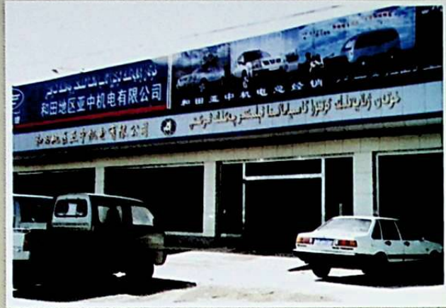
شىركەتنىڭ يورۇققاش دەرياسى بويىدىكى تىجارەت زالى