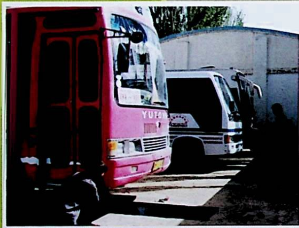
شىركەت قارىمىقىدىكى چوڭ تىپلىق ماشىنىلارنى رېمونت قىلىش زاۋۇتى