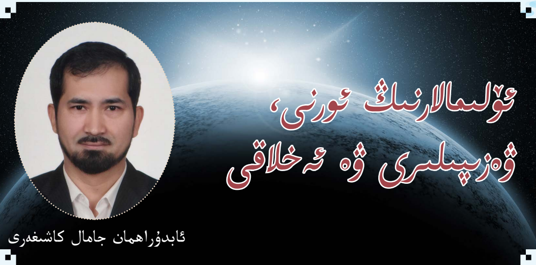
ئابدۇراھمان جامال كاشغەرى

رەببىنى تۆلىمالار ئىلاھىي ۋەھىينىڭ مۇتەۋەللىيلىرى، شەرىئەتنىڭ ھامىيلىرى، ئۆمىمەتنىڭ يۇلتۇزلىرى ۋە يېتەكچىلىرىدۇر. ئۇلار ئىنسانىيەتنىڭ مەشئىلى بولغان پەيغەمبەرنىڭ ئىزباسار ۋارىسلىرىدۇر. شۇ سەۋەبتىن ئىسلام دىنى تۆلىمالارنىڭ قەدىر قىممىتىنى يۇقىرى كۆتۈرۈگەن. ئۇلاردىكى ئىلمىنىڭ ھۆرمىتى ئۈچۈن ئۇلارنى قەدىرلەشنى ئۆمىمەتكە ۋاجىپ قىلغان. [1]