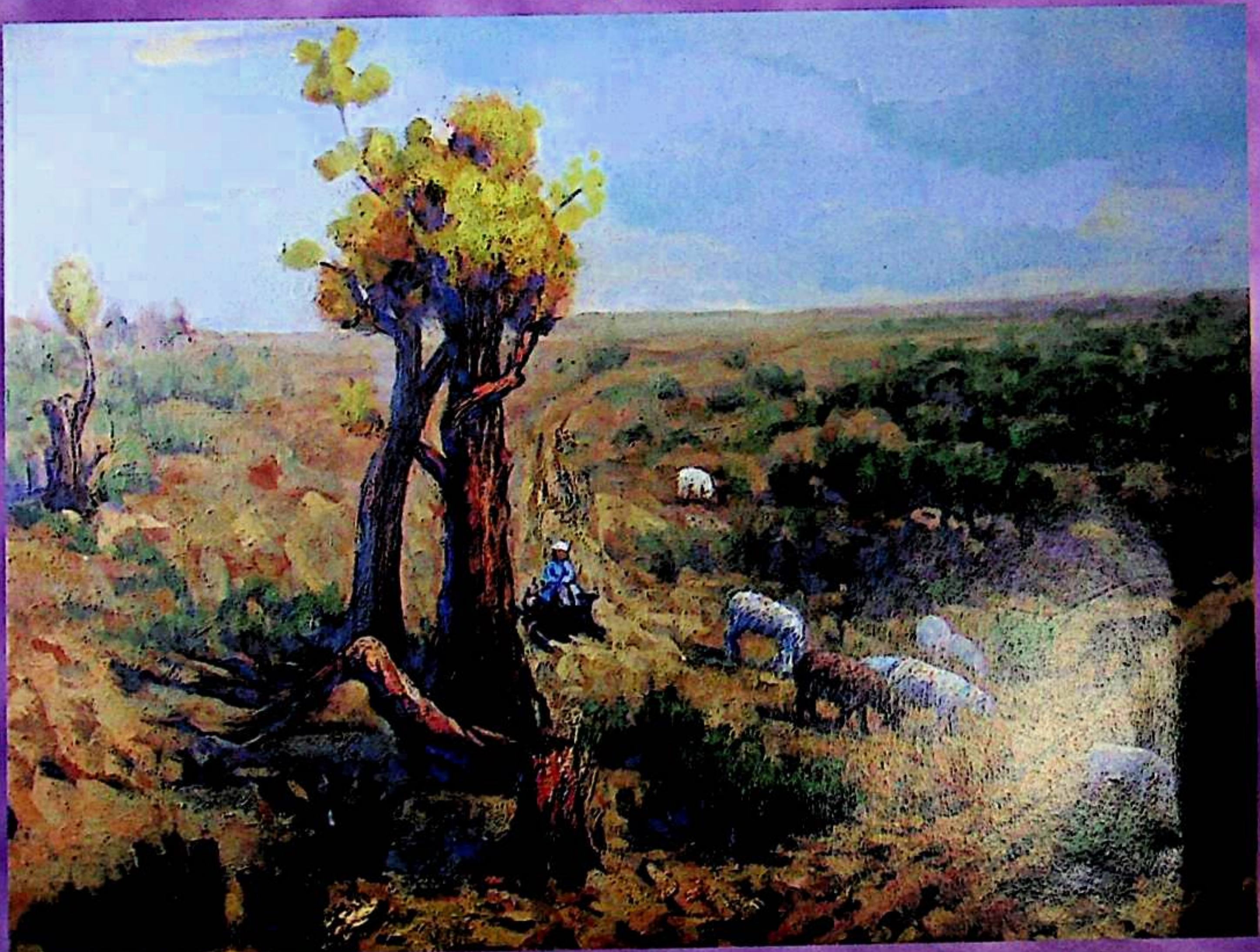
مەمەت ئەيسا سىزغان