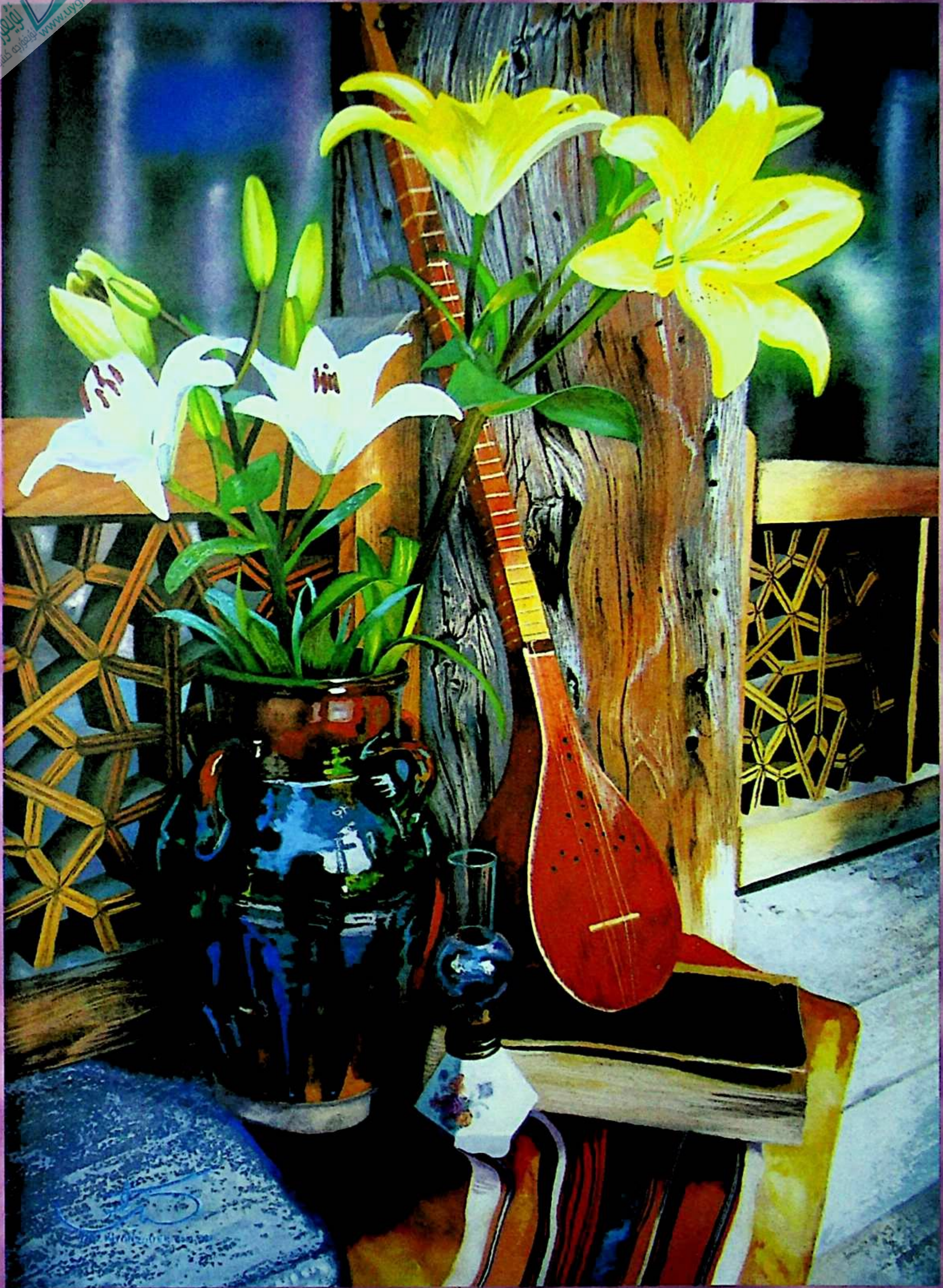
مۇھسەن خاتۇنزا دە سىزغان