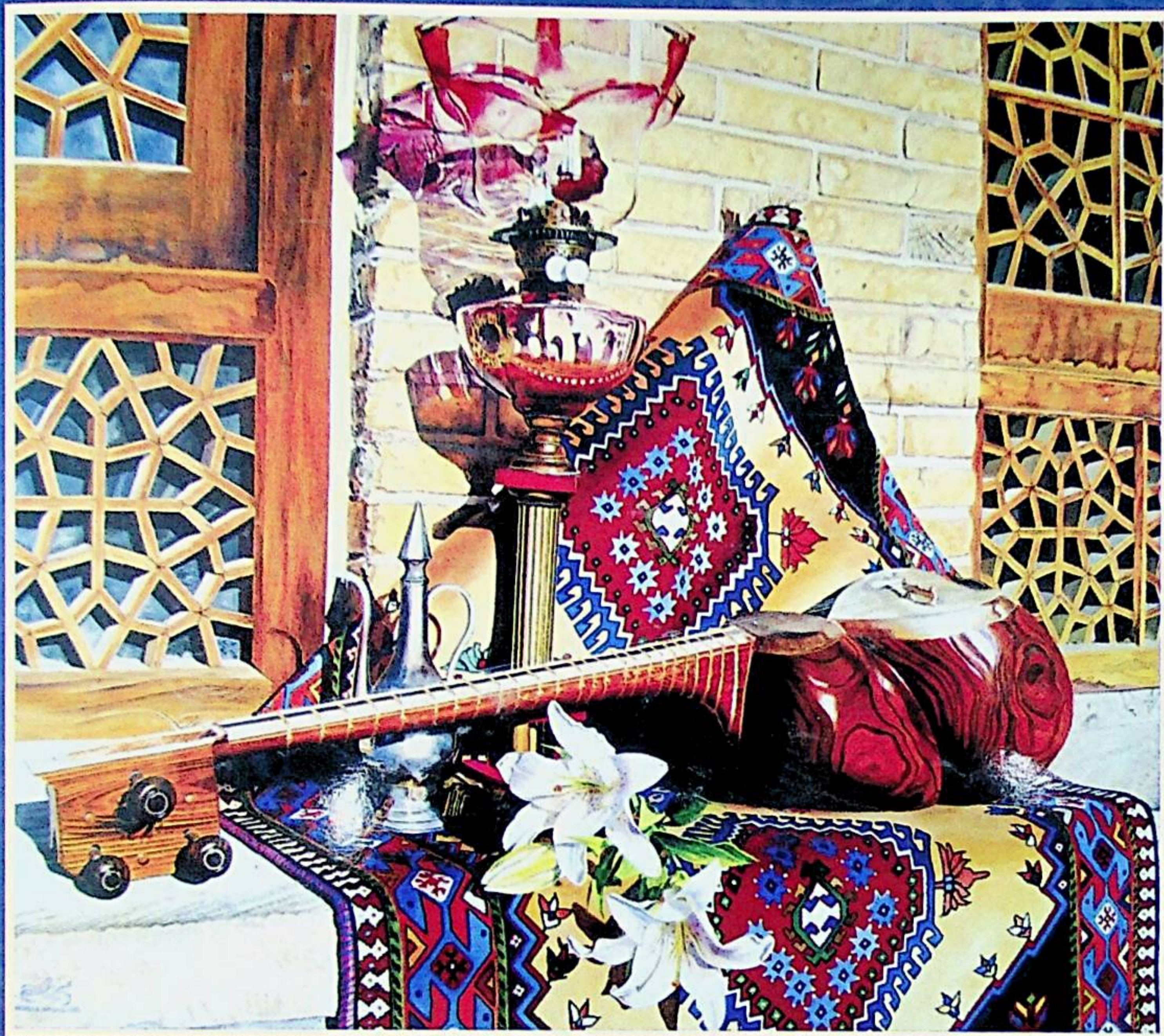
مۇھسىن كىئانزادە سىزغان