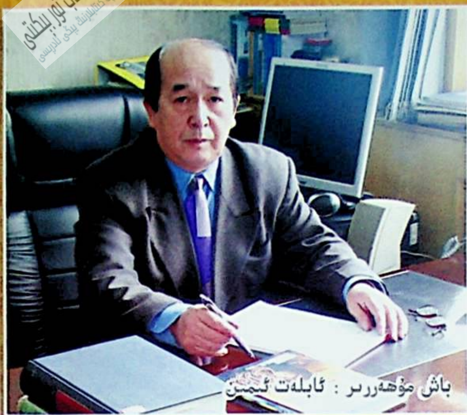
باش مۇھەررىر : ئابلەت ئىمىن

www.hurkitap.com ئوقۇرمەن كىتابلىرىنىڭ يېڭى ئادرېسى بۇ كىتاب تېز بېكىتى