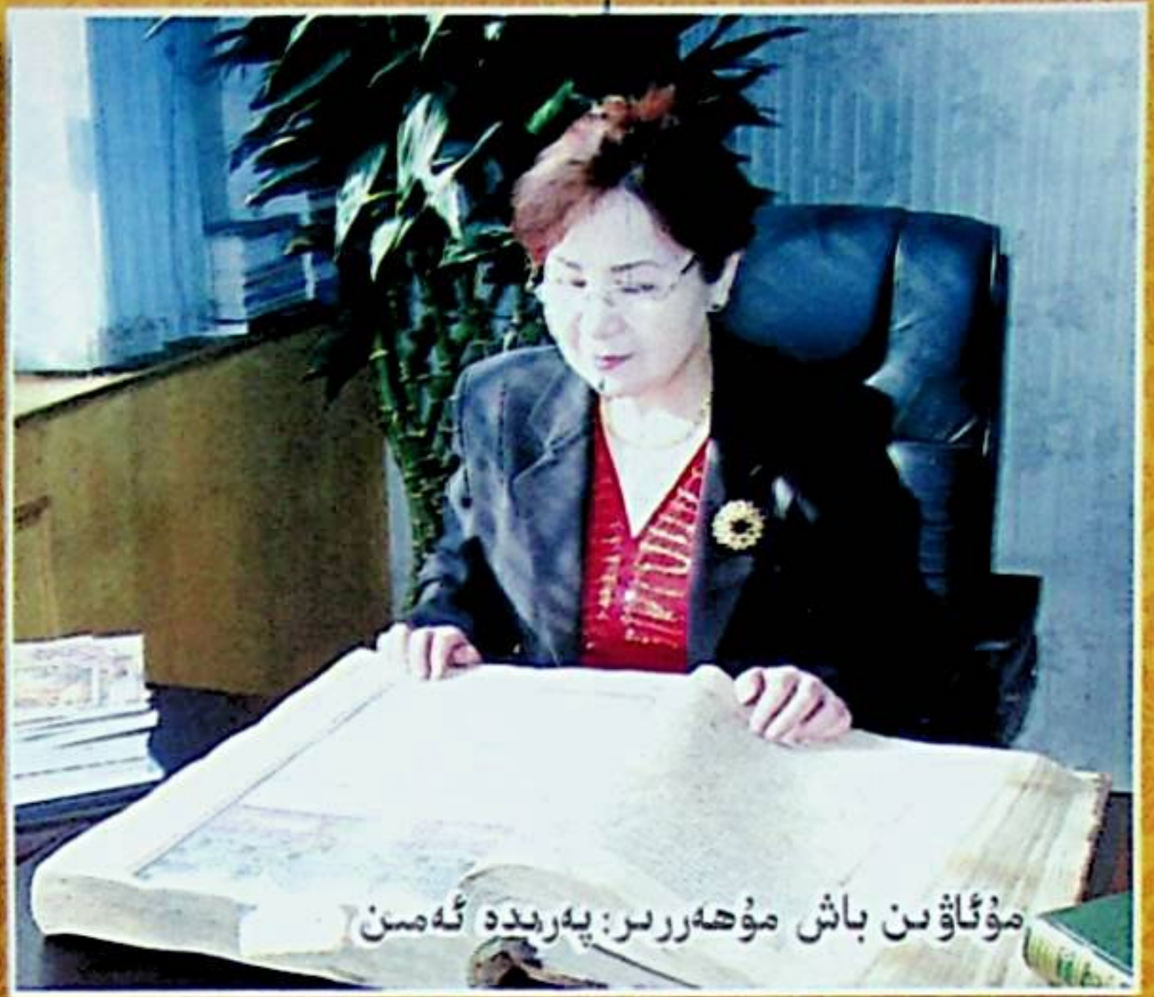
مۇئاۋىن باش مۇھەررىر: پەرىدە ئەمىن