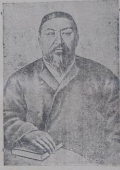
آبای قونابای اولوغی

قازاق خلیقنیک اولوغ شاعیری آبی قونابای اولوغنیک توغرا مانغانیا بو یل توغروسنه 104 یل تولدی. قونابای اولوغنیک اشخان تازا مانغانیا دا حکوم خلیقنیک مقیدس اشایی گکه هسپ عنصرلر گرومی پامان چاشما خلیقنیک علم، هنر، مذهب یولورلغا باشلانید و خلیقنیک تاربیعتی یکنگه لایق، یکنی حیات اساسینی قوروشما یل دوتون غمدرینی صرف قیلدی. قونابای قازاق خلیقنیک یولورلکینده نجر ماننیریکه ابرشوروش مکررینی و او مکررینک اولوغسین سولنگه ایگکه بولوشنی اول اولیلمان داشوروش سید شاعیر و قازاق خلیقنیک هنر بولور اول قازاقنیک اکرانک، سنیقنک اوچونوا مان حیاتنی یولور مان مرتبه اولوغی و اولار نیر خلیقنیک پهلانی، سولنگه که، دهاد بولماسی، یکنی خلیقنیک یولورلغا باشلانید و او خلیقنیک آفاق ارون خدمت قیلدی قازاق شاعیری.