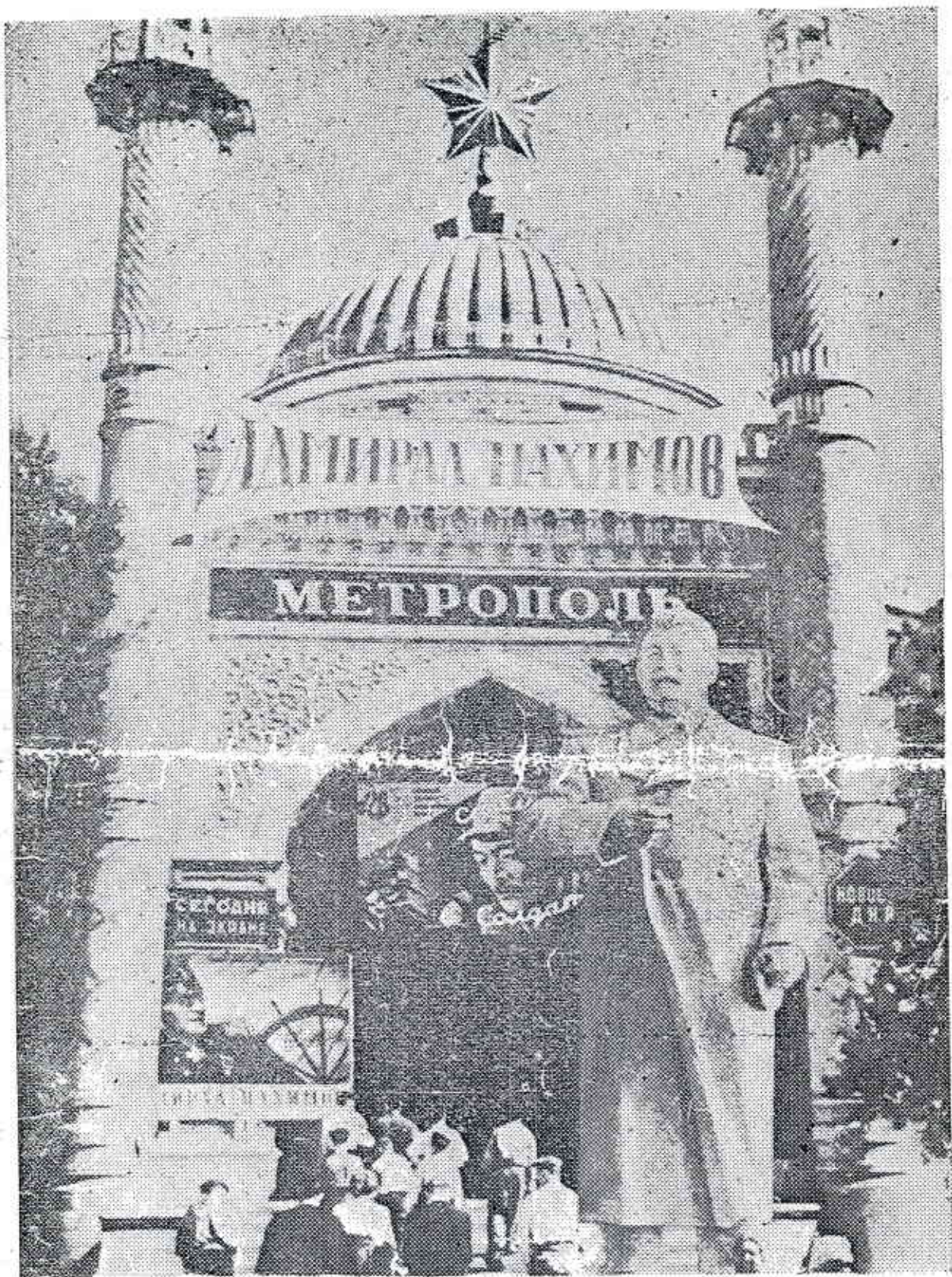
Туркменская ССР. На снимке: новый памятник великому Сталину, отцу народов в знак благодарности от мусульманских граждан.