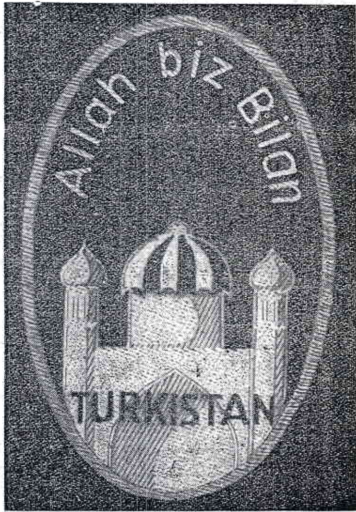
صورة جامع مكنوب عليه (الله معنا) باللغة التركية اتخذها أحرار التركستان شارة لهم في الحركة التحريرية (نعم الله معنا أيها الأحرار)

لوحظ نشاط قوى بين القبائل الموالية لليمن والمرابطة في جوار عدن والمعروف عن هذه القبائل إنها تنزع إلى ضم عدن للمملكة اليمنية .