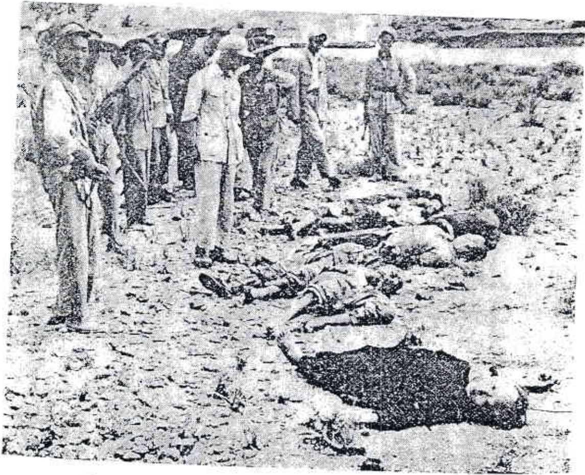
الجلادون الشيوعيون التمتعون لدماء الأرياء . ينظرون إلى ضحاياهم بعد إعدامهم رمياً بالرصاص

لن ينسوا أن الكومنتانج قد أهرق أنهاراً من الدماء ، إذ أنه بين عامي ١٩٤١، ١٩٤٣ أعدم حاكم « سينكيانج » ( التركستان الشرقية ) من قبل الكومنتانج مائة ألف من الشباب الثائرين في ذلك الإقليم وكان معظمهم من أبناء وبنات المسلمين في تلك البلاد . وفي سبيل إخماد ثورة المسلمين في هذا الإقليم تم ذبح أكثر من عشرة آلاف من شعب « او يغور » ( سكان التركستان الشرقية ) وهدم عدد لا يحصى من المباني كما أهرق عدد آخر . وبذلك تم تدمير هذا الإقليم ، وتركت البقية الباقية من هذا الشعب المكافع في حالة يرثى لها . البقية على ص ٢٩