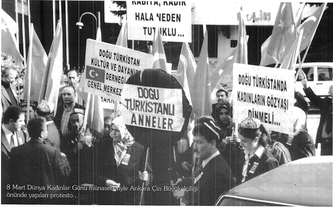
8 Mart Dünya Kadınlar Günü münasebetiyle Ankara Çin Büyükelçiliği önünde yapılan protesto...

8. Uluslar Arası Af Örgütü Ankara Temsilciliği