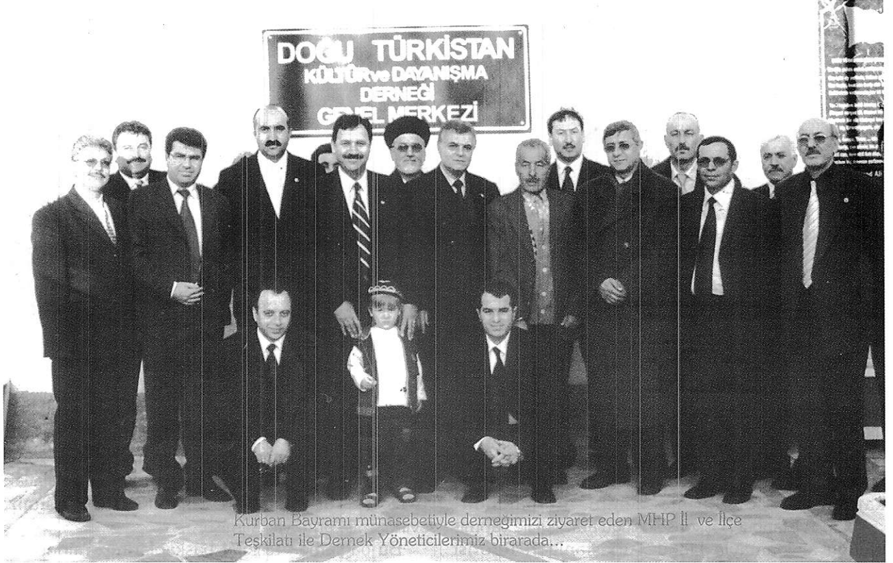
Kurban Bayramı münasebetiyle derneğimizi ziyaret eden MHP İl ve İlçe Teşkilatı ile Dernek Yöneticilerimiz birarada...