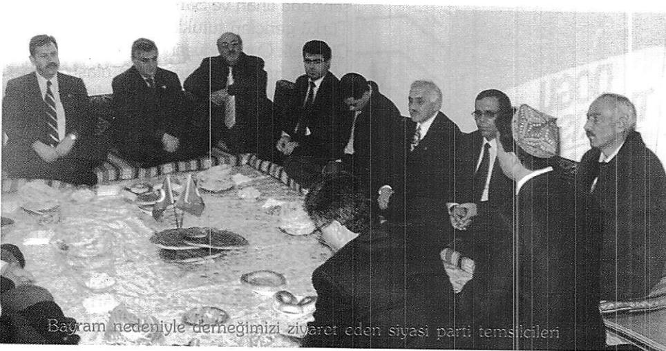
Bayram nedeniyle derneğimizi ziyaret eden siyasi parti temsilcileri

4. Mısır'dan İstanbul'a aktarmalı olarak Çine gitmekte olan uçağın 30.01.2002 tarihinde Atatürk havaalanına indiği ve, Doğu Türkistanlı üç