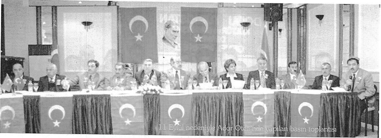
11 Eylül nedeniyle Ador Otelinde yapılan basın toplantısı

1. Ador Otelinde Yapılan Basın Toplantısı : Çin halk cumhuriyeti 11 eylülde ABD'ye yapılan saldırıyı bahane ederek Doğu Türkistan Türklerinin bağımsızlık ve insanca yaşama hak ve isteklerine terörist damgası vurmaya çalışmaktadır.