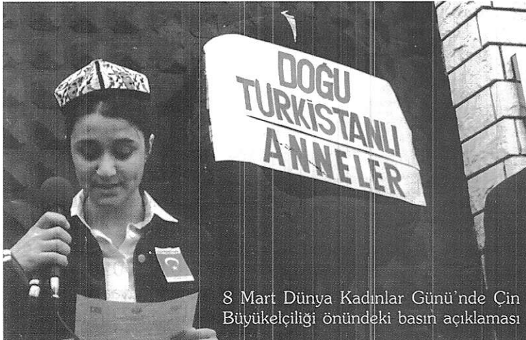
8 Mart Dünya Kadınlar Günü'nde Çin Büyükelçiliği önündeki basın açıklaması