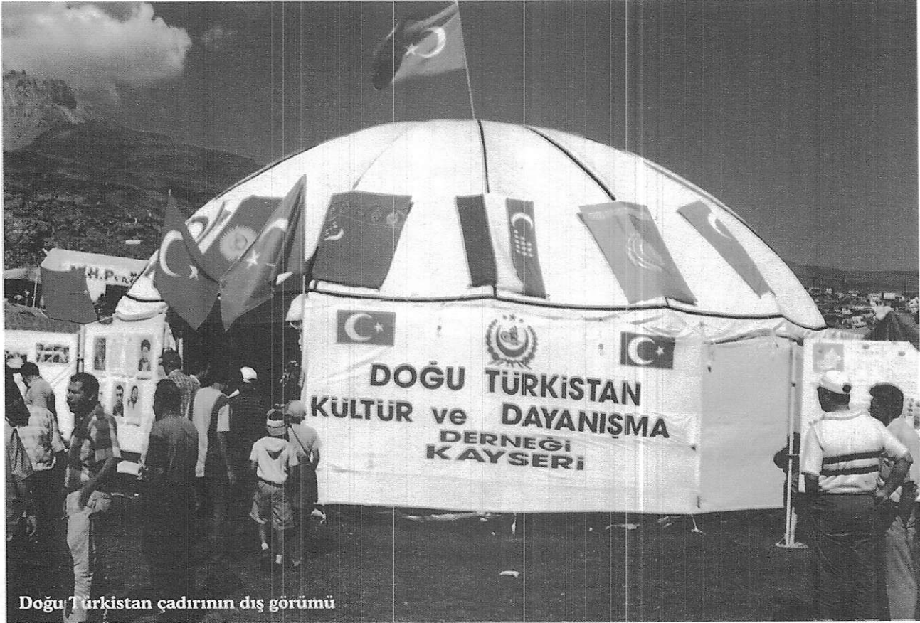
Doğu Türkistan çadırının dış görünümü