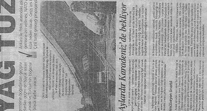
306 metre boyundaki dev platform

Ankara-Pekin hattında kıza yol açan Karadeniz'de bulunan Ukrayna bandırah Varyag gemisinin Boğazlar'dan geçişine ilişkin Denizcilik Müsteşarlığı ile Genelkurmay Başkanlığı ve Dışişleri Bakanlığı arasında yapılan anlaşma, çözüme açmasını sağladı.