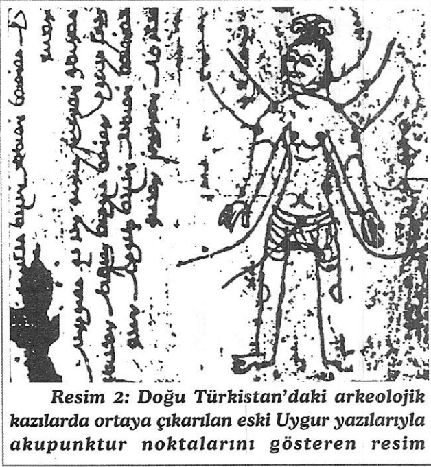
Resim 2: Doğu Türkistan'daki arkeolojik kazılarda ortaya çıkarılan eski Uygur yazılarıyla akupunktur noktalarını gösteren resim

biliriz. Demek ki tarihte ilk defa Akupunkturu uygulayan bir Türk hekimidir.