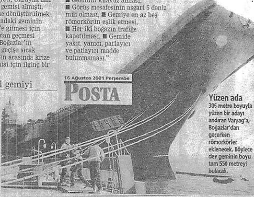
16 Ağustos 2001 Perşembe POSTA

Yüzen ada 306 metre boyuyla yüzen bir adayı andıran Varyag'a, Boğazlar'dan geçerken römorkörler eklenecek. Böylece dev geminin boyu tam 550 metreyi bulacak.