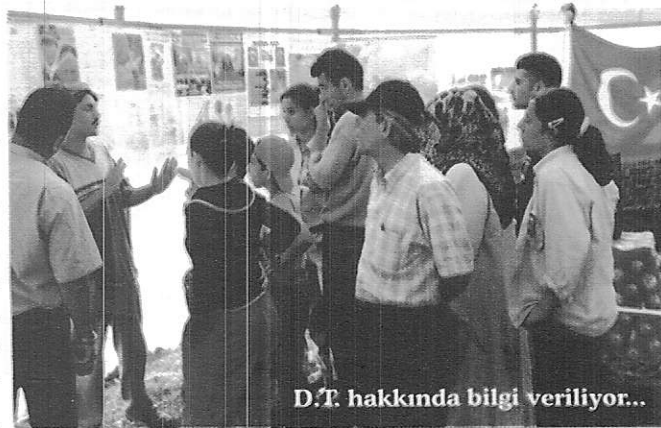
D.T. hakkında bilgi veriliyor...

Dernek üyelerimizden bir ekip etkinliğe katılarak diğer teşkilatları yerleşimde ziyaret ederek hazırlanmış olan hediye paketi takdim edilerek hazırda bulunan misafirlere Doğu Türkistan hakkında malumat vermiştir. Ayrıca milletvekilleri ve bakanlar dernek yönetimince ziyaret edilerek Doğu Türkistan ile ilgili bayrak, kitap, dergi ve rapor sunulmuş kendileri bilgilendirilmiştir.