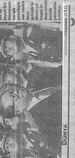
16 AĞUSTOS PERŞEMBE 21.01

ABD'nin füze kalkanı projesi, Çin'i uyardı. Çin, ABD'nin füze kalkanı projesi, Çin'i uyardı. Çin, ABD'nin füze kalkanı projesi, Çin'i uyardı.