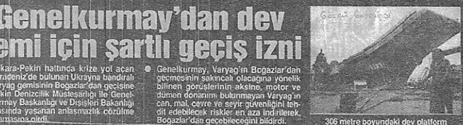
306 metre boyundaki dev platform

Ankara-Pekin hattında kıza yol açan Karadeniz'de bulunan Ukrayna bandırah Varyag gemisinin Boğazlar'dan geçişine ilişkin Denizcilik Müsteşarlığı ile Genelkurmay Başkanlığı ve Dışişleri Bakanlığı arasında yapılan anlaşma, çözüme açmasını sağladı.