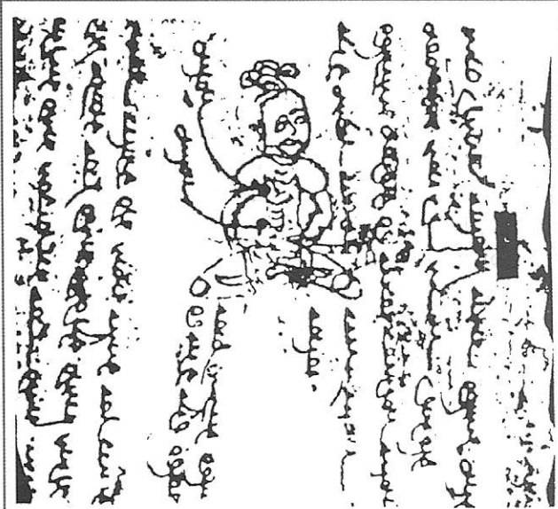
Resim 1: Doğu Türkistan'daki arkeolojik kazılarda ortaya çıkarılan eski Uygur yazılarıyla akupunktur noktalarını gösteren resim

Neticede Akupunktur tedavi yöntemi birçok