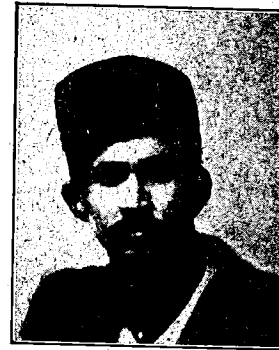
عبدالوهاب بيك (1899 — 1934)

مرحوم عبدالوهاب بيك تورکستاننگ فەرغانه ولايتنده کي قوه شهرنده 1899نچي ميلندا توغولمشد. 18 ياشينا قادار آنا-آناسينگ خدمتده دوام ايتب، بير ميگ توقوز يوز اون يدنچي انقلاب چاغی شیر محمد بيك قومانداسی آستندا ملت وه پورت قورتولوشی اوچون موسقوا تولقونلارينا سدچين بولوب، بويوك فداكارلقلار کورسه تکهن بر باتردر.