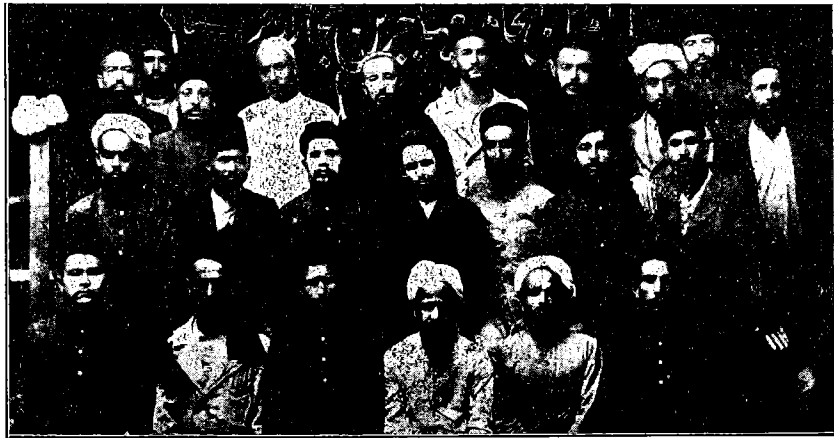
دهلی ده کی «تورکستان مهاجرلری برلگی» ننگ ییل دونوم بایرامینغا قاتناشغانلاردان بر غروپ

ییل دونوم بایرامیمز کوب کوگوللو اوتدی. تورت ساعتان اوزون