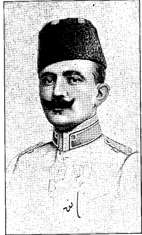
تورکستانك قورتولوشى اوجون كوره شيركهن 1922 نچى يىلى 4 نچى آوغوستدا شهيد توشش

أولكده گى دوشمان اوردوسى كه بى حركت ائتمه كده بولغان قيزيل قوشونلارنى كىرى چاقىريب آلولارنى اوتونه مهن. قيزيل قوشونك بوخارادا ساقلانيشى، آچلققا معروض قالدیريلغان مسلمان اهلينك سوڭ لوقما ئه كمه گىنى ده تارتوب آلىنشىغا وه اهلانلده ساويت