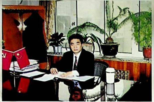
گۈرۈھنىڭ قانۇنىي ۋەكىلى: يېڭا سىكۋى

دۆلەتنىڭ ئالاقىدار سىياسىتى بويىچە 1999 - يىلى 8 - ئايدا شىركەت يەرلىكتىن شىنجاڭ ئېلېكتر ئېنېرگىيە شىركىتىنىڭ باشقۇرۇشىغا ئۆتكۈزۈپ بېرىلگەندىن بۇيان، شىركەتنىڭ ئىقتىسادىي كۈچى زور دەرىجىدە ئاشتى، شىركەت پۇقرى دەرىجىلىك ئورۇنلارنىڭ تەلىپى بويىچە تۈزۈلمىدە، تىجارەتتە، باشقۇرۇشتا، پەن - تېخنىكا بېغىلىق بىرلىشىش قەدىمىي پائال تېزلىكتە، 1999 - يىلىدىن ھازىرغا قەدەر، يېزا ئېگىلىك تۈرى قۇرۇلۇشى ۋە ئۆزگەرتىپ ياساش قۇرۇلۇشىنى زور كۈچ بىلەن ئېلىپ بېرىپ، يەرلىكنىڭ ئىقتىسادىي تەرەققىياتىغا تۆھپە قوشتى. ھازىر شىخۇ شەھىرىدىكى 16 يېزا بازار ئېلېكتر بىلەن قاپلاندى، تېخىمۇ تەرەققىي قىلىش ئۈچۈن، شىركەت پۇقرى دەرىجىلىك باشقۇرۇغۇچى تارماقلارنىڭ رەھبەرلىكىدە قۇرۇلۇش سالىمىقىنى ئۈزلۈكسىز زورلاپتاتقان.