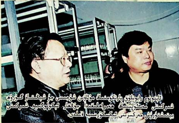
ئاپتونوم رايونلۇق پارىكومىغا مۇئاۋىن شۇجىسى جۇ ھېيغىغا گۇرۇھ شىركىتىنى تەستىقلىنىشقا قاتناشقاندا جۇ ھېيغا ئېكولوگىيە شىركىتىنى يېتەكلىۋاتقان تەركىبىنىڭ باشلىقى

ئېلېكترونلۇق پوچتا بولالامسى: hswl - ki @ xj. cninfo. net