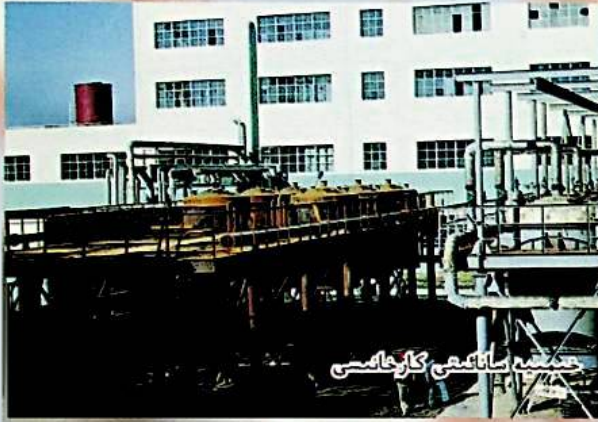
شىنجاڭ سانائىتى كارخانىسى

كارخانا تىپى: دۆلەتنىڭ چوڭ تىپتىكى كارخانىسى (ئاپتونوم رايون بويىچە ئەڭ چوڭ يەرلىك خىمىيە سانائىتى كارخانىسى) تىجارەت دائىرىسى: خىمىيە سانائىتى كىسپى ۋە ئۇنىڭغا ئالاقىدار كىسپلەرگە مەبلەغ سېلىش، پىلانلاش ۋە تىجارەت قىلىش قۇرۇلغان ۋاقتى: ئاپتونوم رايونلۇق خەلق ھۆكۈمىتىنىڭ ش ھ [1997] 188 - نومۇرلۇق «شىنجاڭ خىمىيە سانائىتى گۈرۈھىنى قۇرۇشقا قوشۇلغانلىق توغرىسىدىكى تەستىق» قانۇنىغا ئاساسەن 1997 - يىلى 12 - ئاينىڭ 26 - كۈنى تىزىمغا ئالدۇرۇپ قۇرۇلغان.