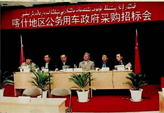
قەشقەر ۋىلايىتىنىڭ نۆجەم ئىقتىدار مائارىپىنى ئېلان قىلىش يىغىنى 喀什地区公务用车政府采购招标会

كىرىمىسى 408 مىليون 650 مىڭ يۈەنگە يەتكۈزۈپ، يىللىق ۋەزىيىتى ئالدىنقى يىلدىكىدىن %53.15 ئاشۇرۇپ ئورۇندى. مالىيىدىن بىر مىليارد 350 مىليون 200 مىڭ يۈەن چىقىم قىلىپ، ئالدىنقى يىلدىكىدىن %62.20 ئاشۇردى.