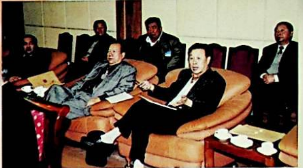
مۇئاۋىن مۇدىر جالغ خېلىك گۇرۇپپا مۇزاكىرىسىدە «ئۈرۈمچى شەھىرىنىڭ شەھەر مۇنى تېجىپ ئىشلىتىشنى باشقۇرۇش نىزامى» غا پىكىر بەردى.

كومىتېت ئەزالىرى گۇرۇپپا مۇزاكىرىسىدە ئاپتونوم رايونلۇق خەلق قۇرۇلتىيى دائىمىي كومىتېتى چىنچى قانۇن ئىجراسىنى تەكشۈرۈش گۇرۇپپىسىنىڭ «بىزنىڭ ئىگىلىك قانۇنى» نىڭ ئىجراسىنى تەكشۈرۈش ئەھۋالىدىن بەرگىن دوكلاتىنى قاراپ چىقتى.