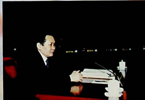
ئاپتونوم رايونىنىڭ مۇئاۋىن رەئىسى دەلىلقان مامقان يىغىنغا سىرتتىن قاتناشتى.