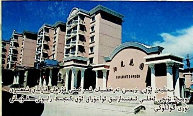
سەنئەت ئۆي - زېمىن تەرەققىيات شىركىتى قۇرغان قاراماي شەھىرى بويىچە تۇنجى ئەقلى ئىقتىدارلىق ئوخشۇراق ئۆي - كىچىك رايوننى قۇياش نۇرى گۈللۈكى