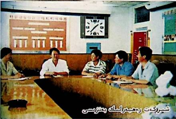
شىركەت رەھبەرلىك يىغىنى

دۆلەتنىڭ ئالاقىدار سىياسىتى بويىچە 1999 - يىلى 8 - ئايدا شىركەت يەرلىكتىن شىنجاڭ ئېلېكتر ئېنېرگىيە شىركىتىنىڭ باشقۇرۇشىغا ئۆتكۈزۈپ بېرىلگەندىن بۇيان، شىركەتنىڭ ئىقتىسادىي كۈچى زور دەرىجىدە ئاشتى، شىركەت پۇقرى دەرىجىلىك ئورۇنلارنىڭ تەلىپى بويىچە تۈزۈلمىدە، تىجارەتتە، باشقۇرۇشتا، پەن - تېخنىكا بېغىلىق بىرلىشىش قەدىمىي پائال تېزلىكتە، 1999 - يىلىدىن ھازىرغا قەدەر، يېزا ئېگىلىك تۈرى قۇرۇلۇشى ۋە ئۆزگەرتىپ ياساش قۇرۇلۇشىنى زور كۈچ بىلەن ئېلىپ بېرىپ، يەرلىكنىڭ ئىقتىسادىي تەرەققىياتىغا تۆھپە قوشتى. ھازىر شىخۇ شەھىرىدىكى 16 يېزا بازار ئېلېكتر بىلەن قاپلاندى، تېخىمۇ تەرەققىي قىلىش ئۈچۈن، شىركەت پۇقرى دەرىجىلىك باشقۇرۇغۇچى تارماقلارنىڭ رەھبەرلىكىدە قۇرۇلۇش سالىمىقىنى ئۈزلۈكسىز زورلاپتاتقان.