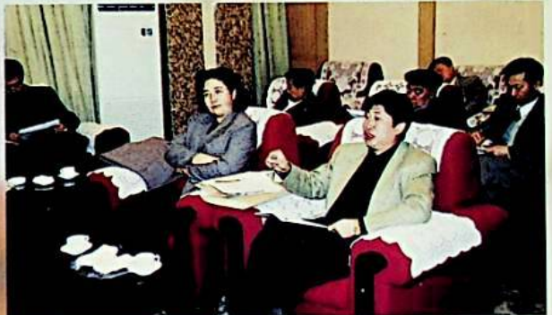
كارخانا ساھەسىدىن كەلگەن كومىتېت ئەزالىرى ئاپتونوم رايونلۇق ئىقتىساد - سودا كومىتېتىنىڭ كارخانا ئىسلاھاتى ۋە تەرەققىيات خىزمىتى توغرىسىدىكى دوكلاتىنى قاراپ چىقتى.