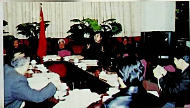
ئاپتونوم رايونلۇق خەلق قۇرۇلتىيى دائىمىي كومىتېتى بەنگۇڭتىڭنىڭ يىغىنغا سىرتتىن قاتناشقان ئالاقىدار رەھبىرى دائىمىي كومىتېت قانۇن ئىجراسىنى تەكشۈرۈش گۇرۇپپىسىنىڭ «دوكلاتلار قانۇنى» نىڭ ئىجراسىنى تەكشۈرۈش ئەھۋالىدىن بەرگىن دوكلاتىغا قارىتا پىكىر بايان قىلدى.