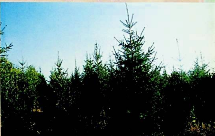
سۈرەت ۋە خەۋەرنى يىن يىنىپ تەمىنلىگەن .

خىزمەتچىلەرنىڭ مائاش ، پاراۋانلىق تەمىناتىمۇ خېلى زور دەرىجىدە ئۆستۈرۈلۈپ ، « ئالتاي ۋىلايىتى بويىچە مىللەتلەر ئىتتىپاقلىقىدىكى نەمۇنىلىك ئورۇن » دېگەن نامغا ئېرىشتى ، ئىلگىرى - كېيىن بولۇپ 1997 - ، 1999 - يىلى « ئالتاي شەھەر ، ۋىلايەت دەرىجىلىك مەدەنىي ئورۇن » دېگەن نامغا ئېرىشتى . بولۇپمۇ ئورمانلارنى يېڭىلاش ، ئورمان بايلىقىنى باشقۇرۇش ، قوغداش جەھەتتە نۇرغۇن خىزمەتلەرنى ئىشلىتىپ ، كۆرۈنەرلىك نەتىجىلەرنى قولغا كەلتۈرۈپ ، ئاپتونوم رايونلۇق ئورمانچىلىق نازارىتى تەرىپىدىن 7 - بەش يىللىق ئورمانلارنى يېڭىلاشتا گەۋدىلىك تۆھپە قوشقان ئورۇن قاتارلىق شەرەپلىك نامغا ئېرىشتى .