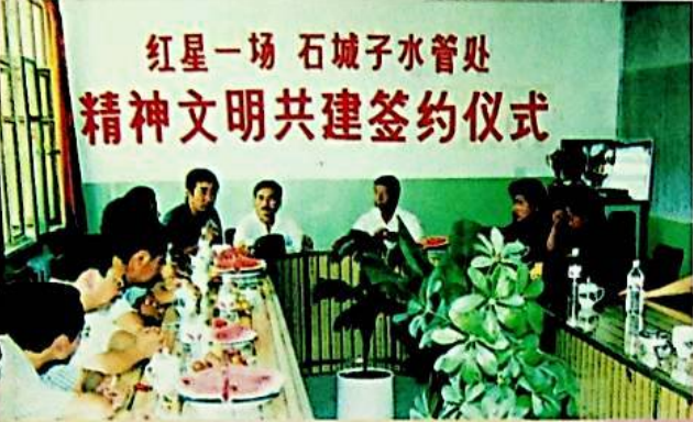
شىنچېڭزى سۇ ئىشلىرى باشقارمىسى بېزا ئىگىلىك 13 - شى قىزىل يۇلتۇز 1 - تۈەنى بەرلىك بىلەن ئورتاق ئورۇن بەرپا قىلدى

1999 - يىلى 7 - ئاينىڭ 1 - كۈنى ۋىلايەتلىك پارتكوم تەرىپىدىن ئىلغار ئاساسىي قاتلام تەشكىلاتى دېگەن نامغا ، 2000 - يىلى ۋىلايەت دەرىجىلىك مەدەنىي ئورۇن دېگەن نامغا ئېرىشتى ۋە شۇ يىلى « ئاپتونوم رايون بويىچە سۈجلىق سىستېمىسىدىكى ئىدىيىۋى سىياسىي خىزمەتتىكى ئىلغار ئورۇن » دەپ نام بېرىلدى .