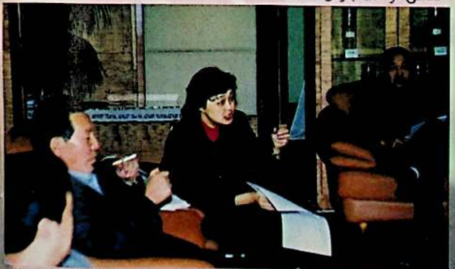
ئاپتونوم رايونلۇق مالىيە نازارىتى خام چوت باشقارمىسىنىڭ مىسغۇلى گۈرۈپپا يىغىنىدا ئاپتونوم رايونىنىڭ 2001 - يىللىق شۇ دەرىجىلىك خام چوتىنىڭ تەخىشلىش تەھۋالى توغرىسىدا كومىتېت ئەزالىرىنىڭ سوئاللىرىغا جاۋاب بەردى.