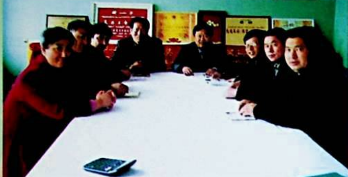
مەيدان رەھبەرلىك بەنزىسىدىكىلەر

ئالتاي ئورمانچىلىق مەيدانى 1954 - يىلى قۇرۇلغان ، كۆلىمى 510 مىڭ گېكتار كېلىدۇ . مەيدان قۇرۇلغاندىن بۇيان ، ئىشلەپچىقىرىشنى ياخشى ئورۇنلاشتۇرۇش بىلەن بىر ۋاقىتتا ، « ئىقتىسادىي ئورماننى ئاساس قىلىش ، ئەھمىيەت ئورمانلاشتۇرۇش ، زور كۈچ بىلەن ئورمان بىنا قىلىش ، كېسىش بىلەن پەرۋىش قىلىشنى بىرلەشتۈرۈش ، مەڭگۈ قايتا پايدىلىنىش » تەك ئورمانچىلىق يېتەكچى فائىجىنى قەتئىي ئىز-چىلاشتۇرۇپ ، نەۋەلىكىدىكى ئورمان بايلىقىنى باشقۇرۇش ، قوغداش خىزمىتىنى كۈچەيتكەچكە ، كارخانىنىڭ تۈرلۈك ئىشلىرى ئۇچقاندەك تەرەققىي قىلىپ ، ئىجتىمائىي ئۈنۈمى ۋە ئىقتىسادىي ئۈنۈمى تېخىمۇ ئاشتى ، 1994 - يىلىدىكى 1 مىليون 50 مىڭ يۈەن زىيان تۈگىتىلىپ ، 1999 - يىلىغا كەلگەندە 300 مىڭ يۈەن ساپ پايدا كۆرۈلدى ، ئىشچى -