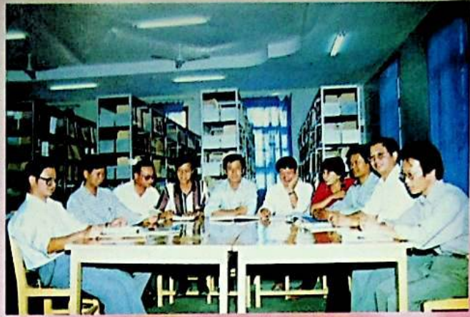
مەكتەپ رەھبەرلىك بەنزىسىدىكىلەر

بۇ مەكتەپ 1958 - يىلى 10 - ئاينىڭ 15 - كۈنى قۇرۇلغان . دۆلەتنىڭ سابىق مۇئاۋىن رەئىسى ۋاڭ جېننىڭ كۆڭۈل بۆلۈشى ۋە قوللىشىغا ئېرىشكەن ، ئۇ مەكتەپ نامىنى بېزىپ بەرگەن ھەمدە مەكتەپنىڭ پەخىرىي مۇدىرى بولغان . بۇ مەكتەپ 1958 - يىلىدىن 1966 - يىلىغىچە نەنمۇن روھىنى جارى قىلدۇرۇپ ، ئۆز كۈچىگە تايىنىپ ئىش كۆرۈشتە ، جاپاغا چىداپ كۈرەش قىلىش ، تىرىشچانلىق بىلەن ئىشلەپ ئىقتىسادچىللىق بىلەن ئوقۇش ، ئوقۇتۇش بىلەن ئىشلەپچىقىرىش ئەمگىكىنى بىرلەشتۈرۈشتىن ئىبارەت مەكتەپ باشقۇرۇش فاھجىسىدا چىڭ تۇرۇپ ، بوز يەر ئۆزلەشتۈرۈش ئىشلىرىغا زور تۈركۈم ئىختىساسلىقلارنى يېتىشتۈرۈپ بەرگەن . مەدەنىيەت زور ئىنقىلابى مەزگىلىدە تارقىتىۋېتىلگەن . 1975 - يىلىغا كەلگەندە ، ئاپتونوم رايونلۇق پارتكوم تارىم بوز يەر ئۆزلەشتۈرۈش ئۈنۈمى سىتېمىسىنى ئەسلىگە كەلتۈرۈشنى قارار قىلىپ ، 1977 - يىلىدىن باشلاپ ئالىي مەكتەپكە ئىستىھان بەرگەن ئوقۇغۇچىلارنى بىر تۇتاش قوبۇل قىلىشنى ئەسلىگە كەلتۈردى . 1978 - يىلى گوۋۇيۈەن بۇ مەكتەپنى ماركسىستلىق ئۇنۋانى بېرىش ھوقۇقى بولغان ئادەتتىكى ئالىي مەكتەپ دەپ تەستىقلىدى .