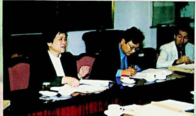
كومىتېت ئەزالىرى ئاپتونوم رايونىنىڭ 2000 - يىللىق شۇ دەرىجىلىك مالىيە نەقچوتىنى تەستايىدىل قاراپ چىقتى.