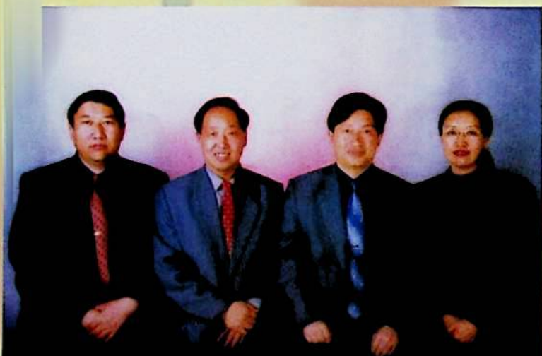
مەيدان رەھبەرلىك بەنزىسىدىكىلەر

ئاپتونوم رايونلۇق ئورمانچىلىق ئىدارىسى قۇتۇبى ئورمانچىلىق مەيدانى 44 يىللىق تارىخقا ئىگە دۆلەت ئىلكىدىكى ئورمانچىلىق كارخانىسى ، ئۇنىڭ شەرقىدىن غەربكىچە بولغان ئۇزۇنلۇقى 85 كىلومېتىر ، جەنۇبتىن شىمالغىچە بولغان كەڭلىكى 44 كىلومېتىر ، بۇنىڭ ئىچىدە ئورمانلىق كۆلىمى 47 مىڭ 538 گېكتار كېلىدۇ . 1998 - يىلىدىن باشلاپ « تەبىئىي ئورمان بايلىقىنى قوغداش قۇرۇلۇشى » سىناق تەرىقىسىدە يولغا قويۇلۇپ ، 2000 - يىلىدىن باشلاپ رەسمىي يولغا قويۇلدى . ئورمانلىقنىڭ ئېكولوگىيىسىنى قوغداش ۋە ئېكولوگىيىلىك قۇرۇلۇش ئورمانچىلىق مەيدانىنىڭ مەركىزىي ۋەزىپىسىگە ئايلاندى . كەسىپ قۇرۇلمىسى ، ئىقتىسادىي قۇرۇلما ۋە تىجارەت قۇرۇلمىسىنى زور دەرىجىدە تەڭشەشكە باشلىدى .