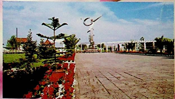
يۇقىرى، يېڭى تېخنىكا ئۈلگە رايونىدىكى ئۈلگە كۆرسەتۈش بېشى. بەت لايىھىلىگۈچى: ۋالىك شىنپىڭ.