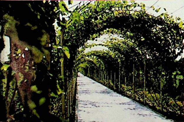
ئۈلگە رايونىدىكى 28 كىلومېتىر ئۇزۇنلۇقتىكى ئۈزۈم كارىدورى.