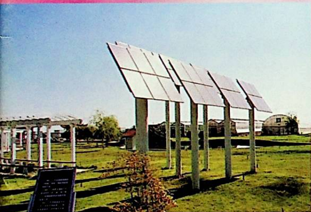
يۇقىرى، يېڭى تېخنىكا ئۈلگە رايونىدىكى قۇياش ئېنېرگىيىسى ئۈسكۈنىسى.