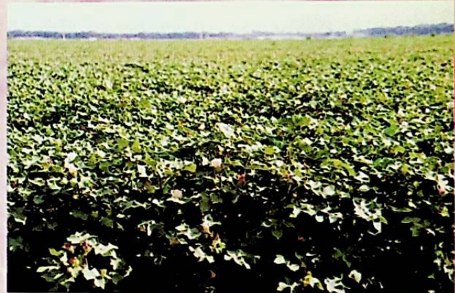
3000 مولۇق ئۈلگە رايونىدىكى كېۋەز ئېتىزى.