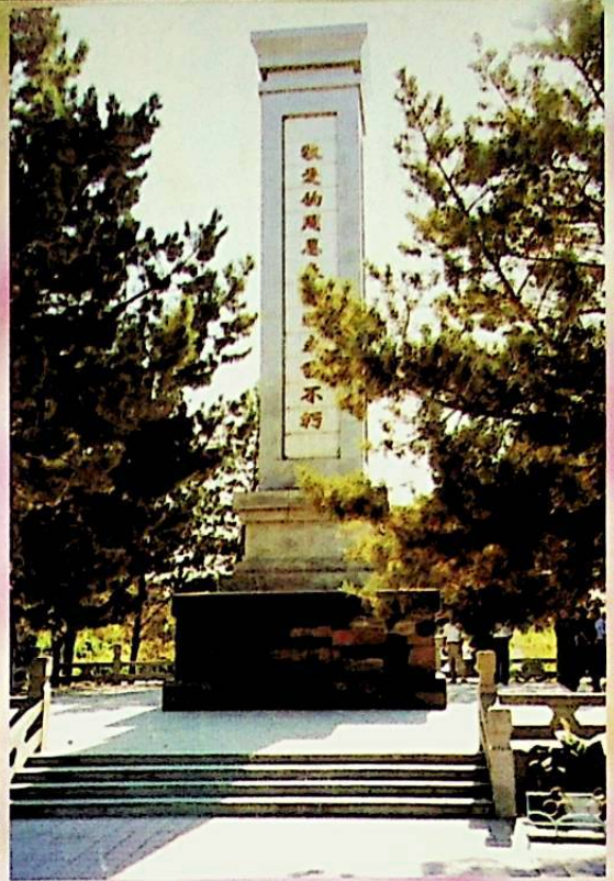
باغچىدىكى جۇ ئېنلەي زۇڭلى خاتىرە مۇنارى

دېۋىزىيە رەھبەرلىرى بېيجۈەن بازىرىنىڭ تۇنجى نۆۋەتلىك رەھبەرلىك بەنزىسىدىكىلەر بىلەن خاتىرە سۈرەتكە چۈشتى.