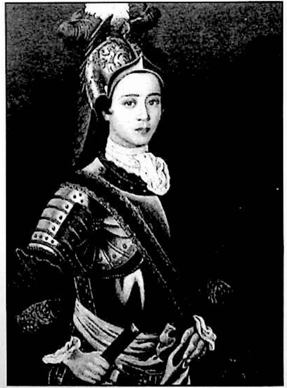
ئىتپاز خان ئابدۇشكۈر كېرەم سىزغان