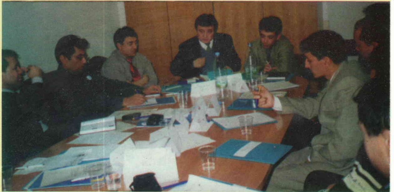
(3) ئەركىن ئالىپتېكىن ئەپەندى باشلار قورۇلتىيى ئىشخانىسىدا