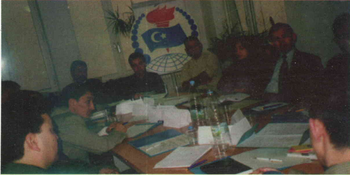
(1) دائىمىي كومىتېت ئەزاسى جىددى كېڭەشتە

دۇنيا ئۇيغۇر ياشلىرى قورۇلتىيى دائىمىي كومىتېتىنىڭ بىرىنچى نۆۋەتلىك كېڭەيتىلگەن يىغىنى مۇۋەپپەقىيەتلىك چاقىرىلدى!