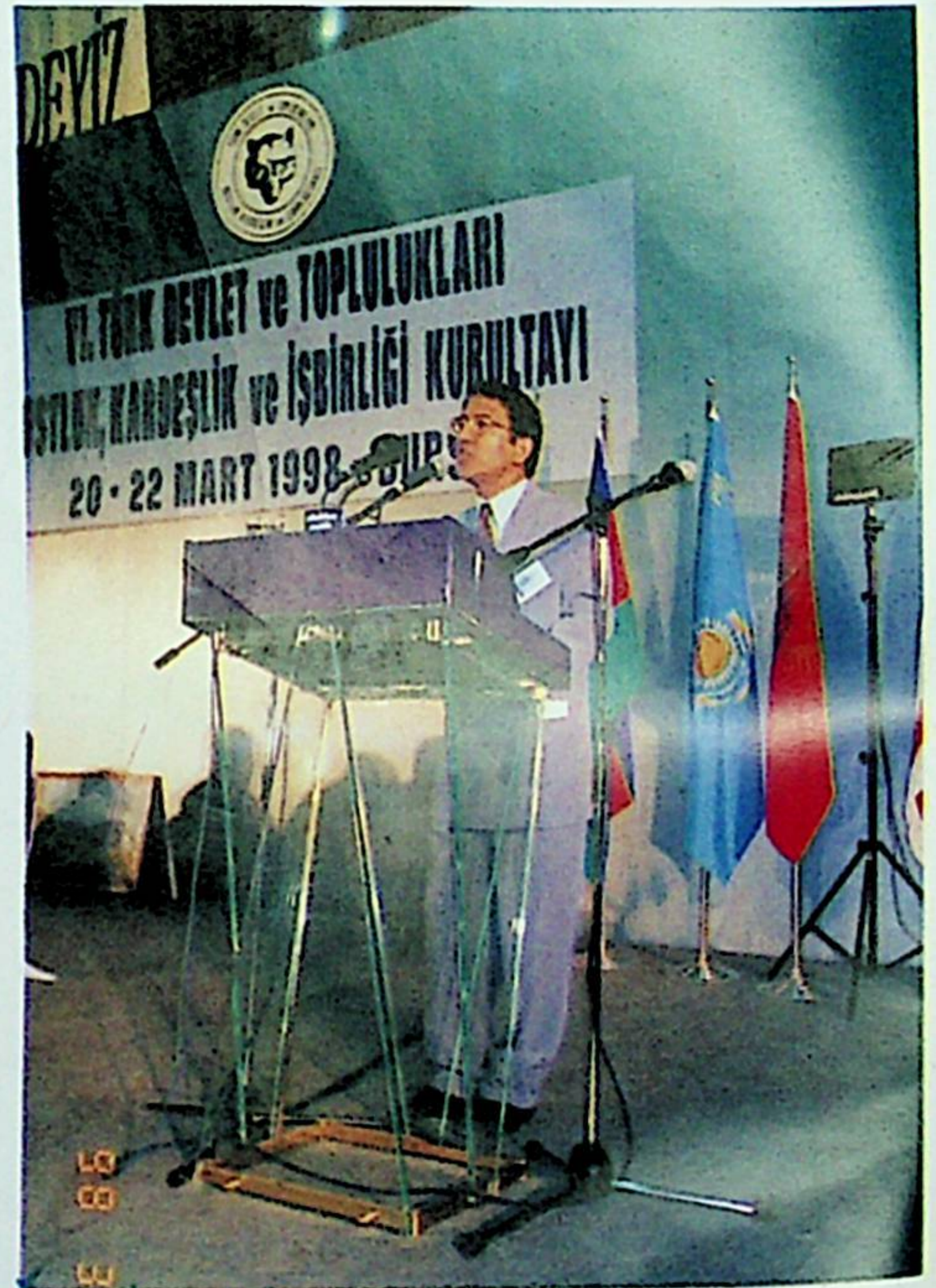
Ismail Cengiz Türk Kurultayı'nda Protokol Konuşması Yaparken