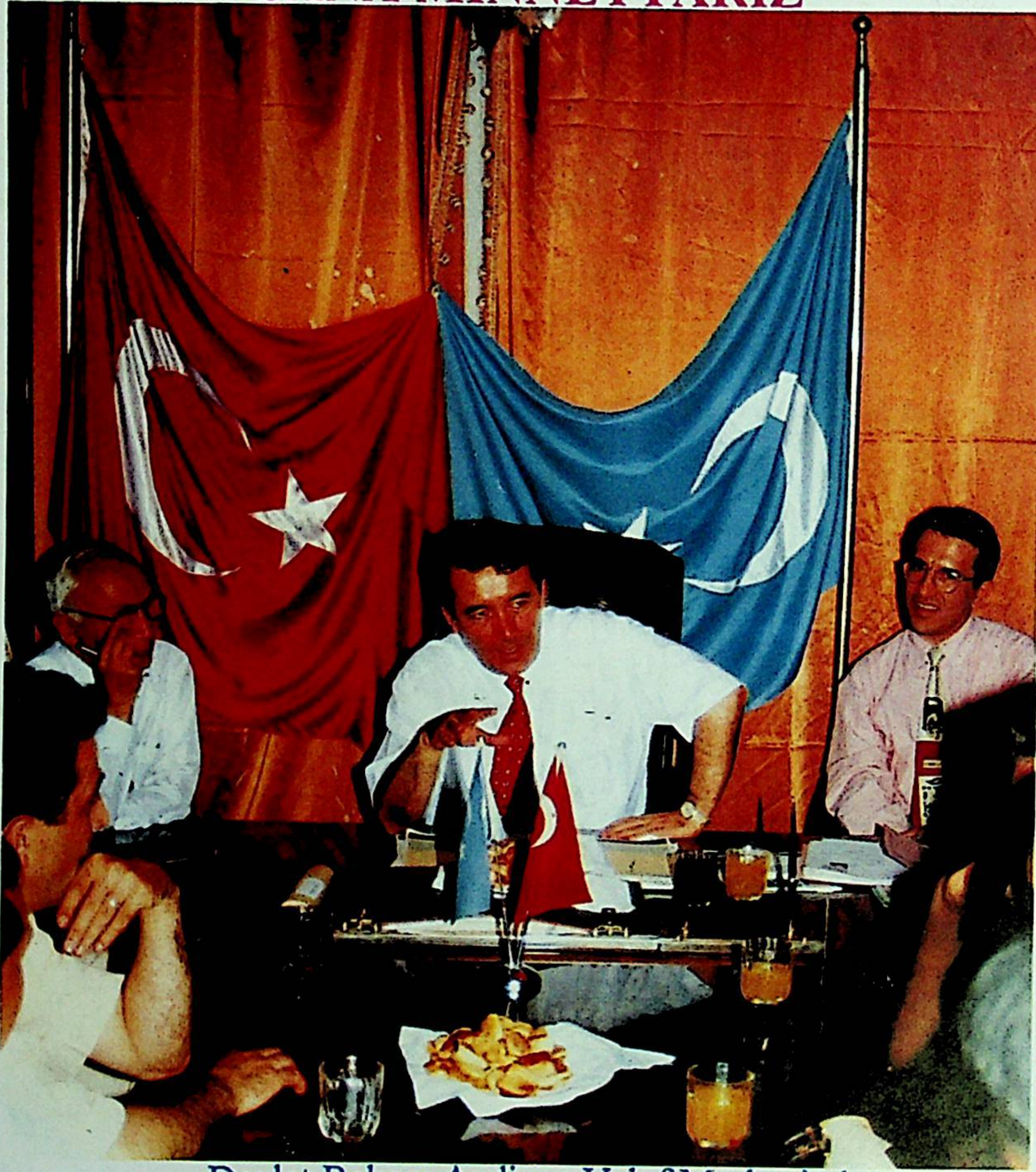
Devlet Bakanı Andican Vakıf Merkezinde