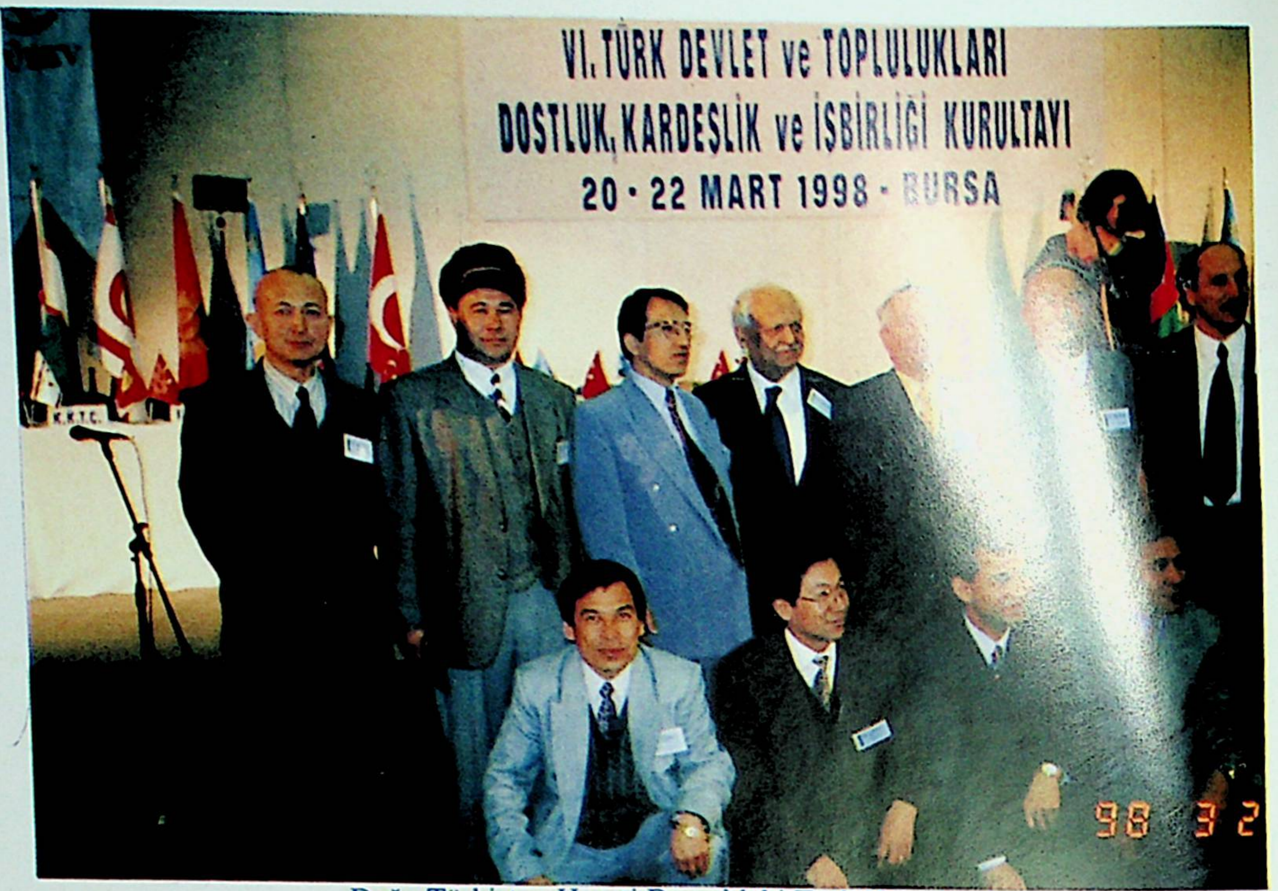
Doğu Türkistan Heyeti Bursa'daki Türk Kurultayı'nda