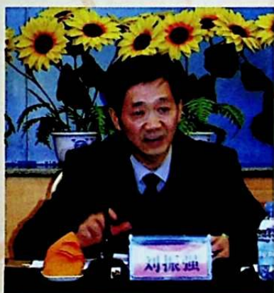
ئاپتونوم رايونلۇق مىللەتلەر ئىشلىرى كومىتېتى (دىن ئىشلىرى ئىدارىسى) پارتگۇرۇپ-چىسىنىڭ شۇجىسى ليۇجىنچياڭ يىغىندا خىزمەت دوكلاتى بەردى.