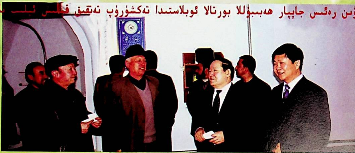
2006 - يىلى 3 - ئاينىڭ 7 - كۈنى، مۇئاۋىن رەئىس جاپپار ھەبىيۇللا (ئالدىنقى رەت ئوڭدىن 2 - كىشى) بورتالا ئوبلاستىنىڭ رەھبىرى شى شاۋلىنىڭ ھەمراھلىقىدا بورتالا ئوبلاستىنىڭ دىن خىزمىتىنى تەكشۈرۈپ تەتقىق قىلدى.