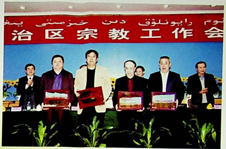
2005 - يىللىق ئاپتونوم رايون بويىچە مىللەت، دىنغا دائىر ئۆچۈر خىزمىتىدىكى ئىلغار ئورۇنلار.