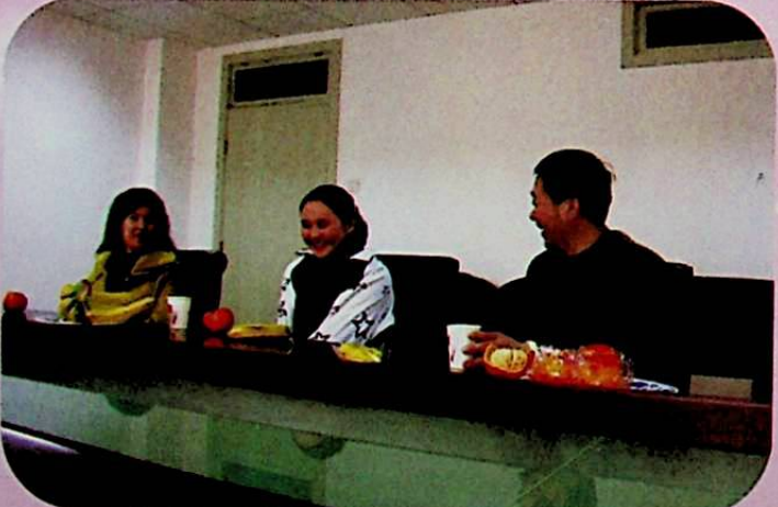
2006 - يىلى 3 - ئاينىڭ 3 - كۈنى، ئاپتونوم رايونلۇق مىللەتلەر ئىشلىرى كومىتېتى پارىگۇرۇپپىسىنىڭ شۇجىسى لىۋجىنچياڭ بېيجىڭدا ئوۋۇتقان قازاق تۇغۇغۇچى مۇسەلمان بۇقلىدى. مەركەز رەھبەرلىرىنىڭ ئەمەلىيلەشتۈرۈش گۇرۇپپىسى بۇلۇڭ 9 - ئايدا مەركەزىي مىللەتلەر ئىشلىرى كومىتېتىنىڭ قارمىقىدىكى، تەنھۇا يەتتە يەكە قۇشقا باغلاپ، (لۋجىن فونۇسى)