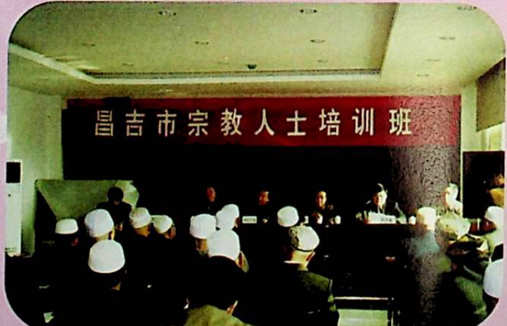
2006 - يىلى 3 - ئاينىڭ 20 - كۈنى، سانجى شەھىرى دەپنى زاتلارنى تەربىيەلەش كۇرسى ئاچتى. كۇرسقا پۇتۇن شەھەردىكى 82 دەپنى پائالىيەت سورۇندىن كەلگەن 160 تىن كۆپ دەپنى زات ۋە دىپوكراتىك باشقۇرۇش مەھكىمىسىنىڭ