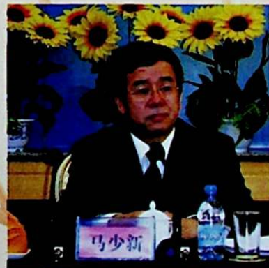
ئاپتونوم رايونلۇق مىللەتلەر ئىشلىرى كومىتېتى (دىن ئىشلىرى ئىدارىسى) نىڭ مۇئاۋىن مۇدىرى (مۇئاۋىن ئىدارە باشلىقى) ماشاۋشىن تەقدىرلەش قارارىنى ئوقۇپ چۈشتى.