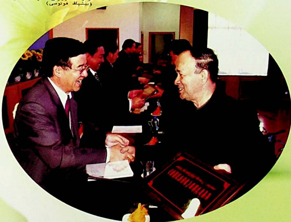
ئاپتونوم رايونلۇق مىللەتلەر ئىشلىرى كومىتېتى (دىن ئىشلىرى ئىدارىسى) نىڭ رەھبەرلىرى ئىلغار كوللېكتىپلارغا مۇكاپات تارقىتىپ بەردى.