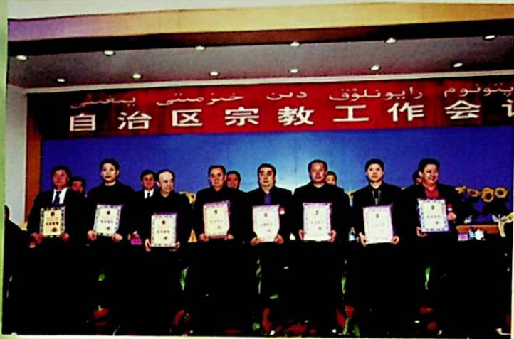
بىخىندا بىر تۈركۈم ئىلغار كوللېكتىپ ۋە ئىلغار شەخسلەر تەقدىرلەندى. سۈرەتتە: مەملىكەت بويىچە دىن خىزمىتى سىستېمىسىنىڭ «4 - بەش يىللىق» قانۇن تومۇشلاشتۇرۇش خىزمىتىدىكى ئىلغار كوللېكتىپلار.