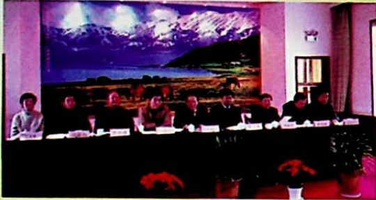
2006 - يىلى 3 - ئاينىڭ 7 - كۈنى، ئاپتونوم رايونلۇق 6 - نۆۋەتلىك ئاز سانلىق مىللەتلەر ئەنئەنىۋىي تەنھەرىكەت يىغىنىنىڭ 1 - قېتىملىق تەييارلىق خىزمىتى يىغىنى بورتالا شەھىرىدە ئېچىلدى. ئاپتونوم رايوننىڭ مۇئاۋىن رەئىس جاپپار ھەبىيۇللا (ئوتتۇرىدا) يىغىنغا قاتناشتى ھەمدە مۇھىم سۆز قىلدى.