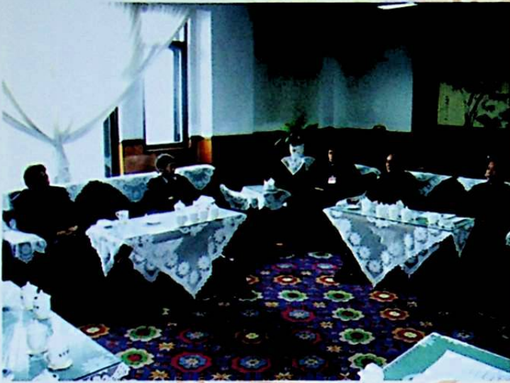
ئاپتونوم رايونلۇق مىللەتلەر ئىشلىرى كومىتېتى (دىن ئىشلىرى ئىدارىسى) پارتگۇرۇپپىسىنىڭ شۇجىسى ليۇجىنچياڭ گۇرۇپپا مۇزاكىرىسىدە.