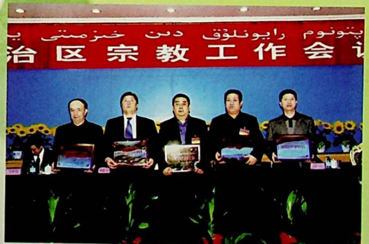
2005 - يىللىق «مىللەت ۋە دىن» ژۇرنىلىغا ماقالە ئويۇشتۇرۇشتىكى ئىلغار كوللېكتىپلار.