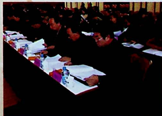
يىغىن مەيدانى كۆرۈنۈشى.