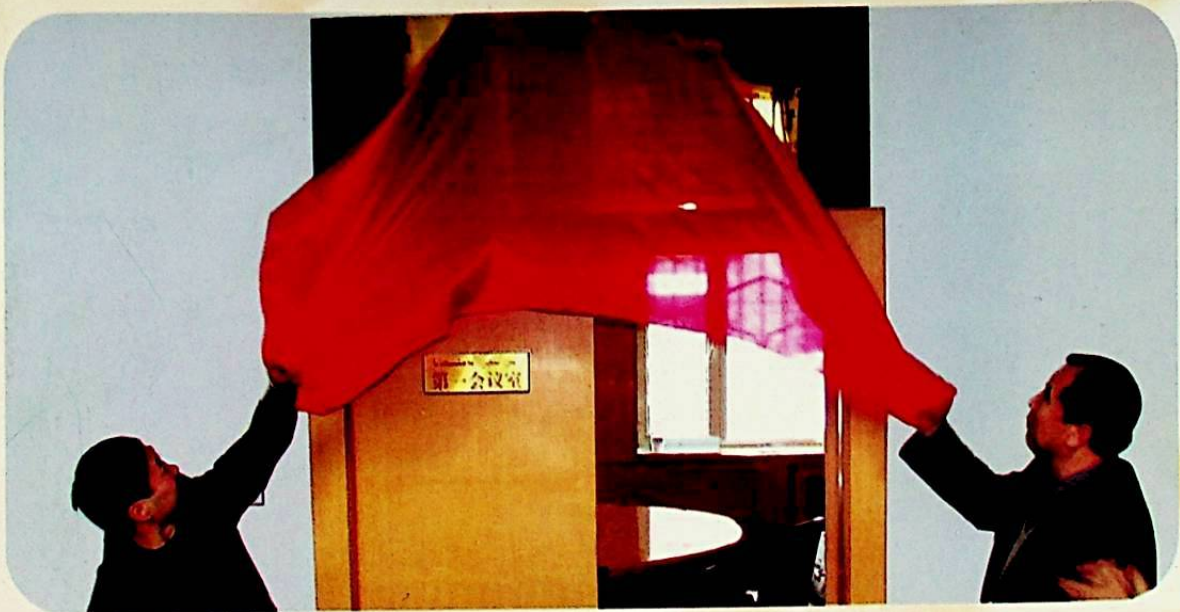
2006 - يىلى 3 - ئاينىڭ 29 - كۈنى، كومىتېت (ئىدارە) ئورگىنىمىز ئاپتونوم رايون دەرىجىلىك «مەدەنىي ئورۇن» ۋېبسىكىسىنى ئېشىش ۋە مەسئۇلىيەتنامە ئىمزالاش مۇراسىمى ئۆتكۈزدى. سۈرەتتە: كومىتېت (ئىدارە) پارتگۇرۇپپىسىنىڭ شۈجىسى ليۇجېنچياڭ (سول تەرەپ) بىلەن مۇئاۋىن مۇدىر رېشىت نىياز (ئوڭ تەرەپ) يۇپۇق ئېچىۋاتىدۇ.

— كومىتېت (ئىدارە) ئورگىنىمىزنىڭ مەنئۇي مەدەنىيلىك بەرپا قىلىش خىزمىتى ئالبومى