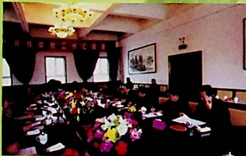
2006 - يىلى 3 - ئاينىڭ 7 - كۈنى، ئاپتونوم رايوننىڭ مۇئاۋىن رەئىس جاپپار ھەبىيۇللا (ئوڭدىن تۆتىنچى كىشى) بورتالا موڭغۇل ئاپتونوم ئوبلاستىدا مىللەت دىن خىزمىتى تەھلىلىدىن بېرىلگەن دوكلاتنى تاقلىدى.