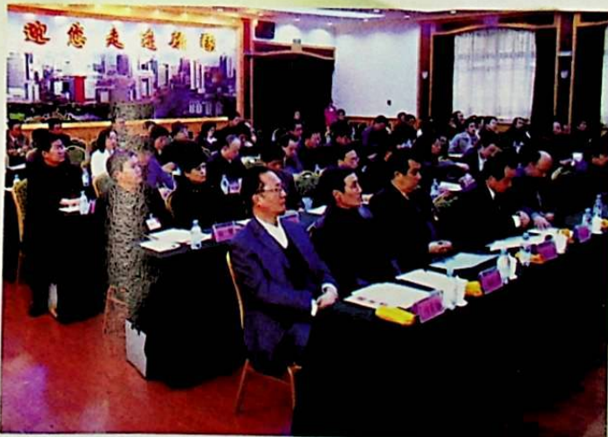
بىخىن مەيدانى كۆرۈنۈشى.