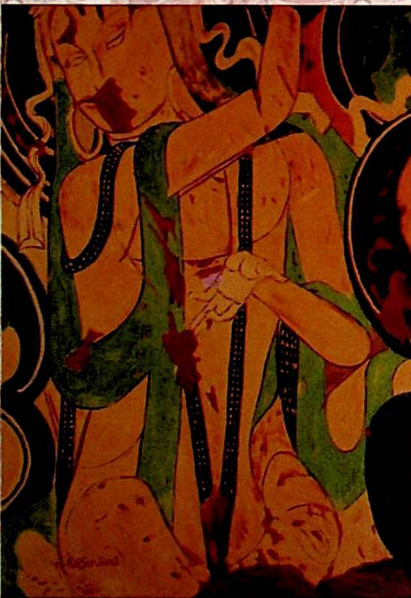
شۋېتسىيەدە تەسلىگەن تۈرۈلگەن