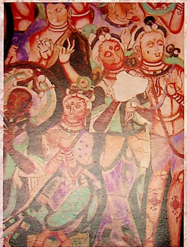
شۋېتسىيەدە تەسلىگەن تۈرۈلگەن