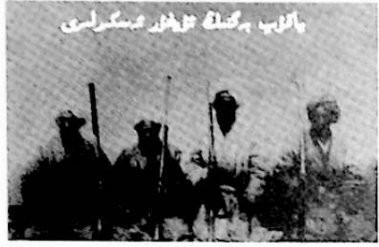
ياقۇپ بەگنىڭ ئۇرۇش سىگىرىلى

ئۇسۇللىرىنى ئۆگەنمىدى. ئەكسىچە، ئۇ ھۆكۈمەت ئىشلىرىغا تىگىشلىك پۈتۈن سىياسەت ، پىكىر ۋە تەلەپلەرنىڭ ھەممىسىنى ئۆزى بەلگىلەپ چىقارتتى. مۇھىم ئىشلاردا كېڭەش ۋە مۇزاكىرە ئۇيۇشتۇرمايتتى. بەزى مەلۇماتلارغا قارىغاندا دەسلەپكى ۋاقىتلاردا ناھايىتى ياخشى ماڭغان دۆلەت ئىشلىرى، باياشات ھايات ئاستا-ئاستا خاراپىلىشىشقا، بەگلىر چېرىكىلىشىشكە باشلىغان ئىدى. ئەمما، مەنچىڭ ئىمپېرىيىسىنىڭ زۈلۈمىنى يەتكىچە تارتقان ۋە ئىرىكىلىككە مۇھتاج بولغان ئۇيغۇر خەلقى يەنىلا ئۆز ھاكىمىيىتىنى قەدىرلەپ، ئۇنى جان تىكىپ قوغدىغان ئىدى. ئەگەر ياقۇپ بەگ