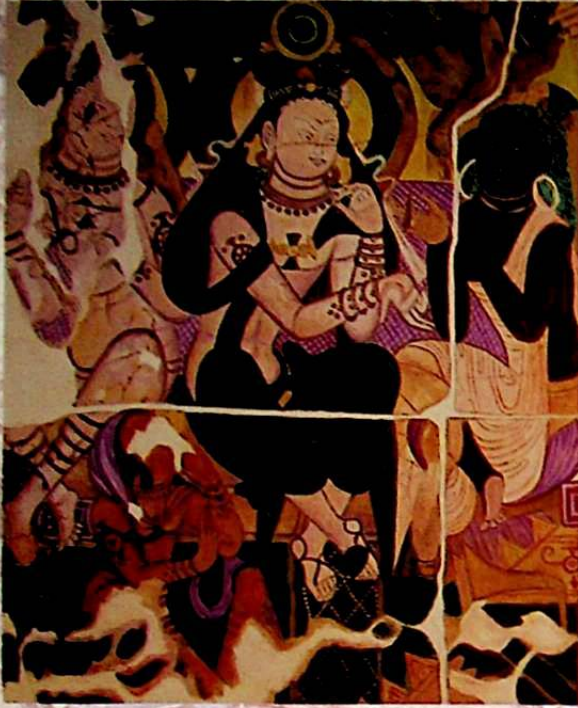
شۋېتسىيەدە تەسلىگەن تۈرۈلگەن