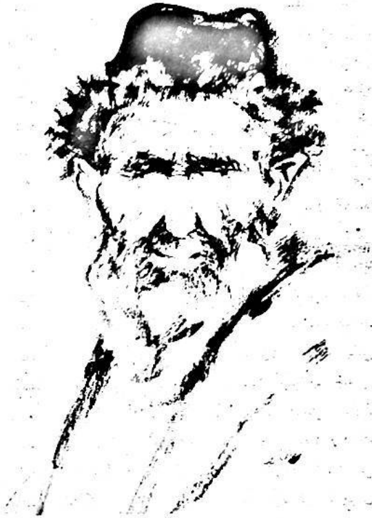
قېرىندىشى ئوت قويۇپ كۆيدۈردى...

— ھوي يۈزى قىلىن ئاپ. مېنى بىلمەيدۇ دەسەن. قېرىغاندا سەت بولمىسۇن. دەپ دەردىمنى ئىچىمگە يۈتۈپ يۈرسەم. ئۆزۈڭنى بىلمەيسىنا. دېگەن زادى. كىمىنىڭ كەينىدە يۈزۈپسەن؟ مەندىن چىنۇنامەن - يە؟ — دەپ. ۋارقىرىدى. ئىدىرىس ئىشنىڭ چاتاقى تەرىپىگە ئېشىپتۇ.