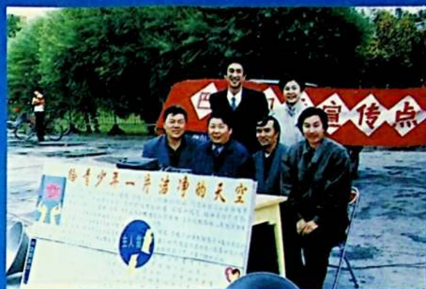
✦ يوقىرى دەرىجىلىك رەھبەرلەرنىڭ قىزغىن قولىشىغا ئېرىشتى