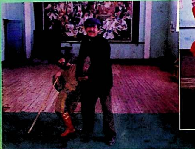
▲ كۈلدۈرگە ئارتىملىرى ماھارەت سىنىماقتا