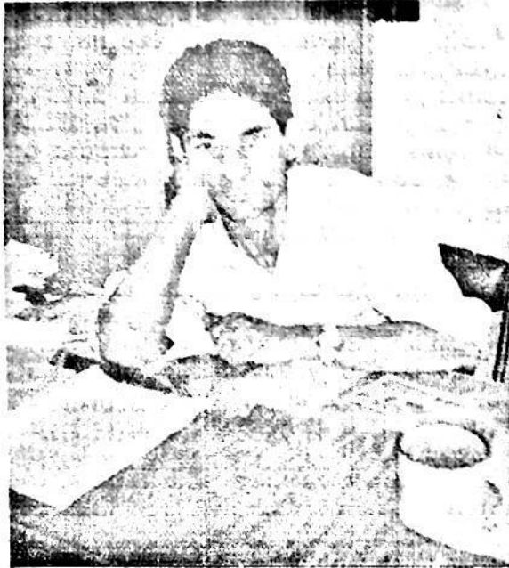
شائىر رۆزى سايىت نەبەككۈر ئۈستىدە