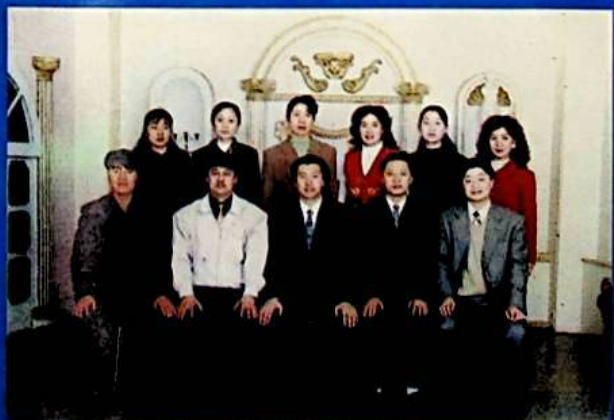
✦ كورلا شەھەرلىك ئىتتىپاق كومىتېتى خاتىرىسى