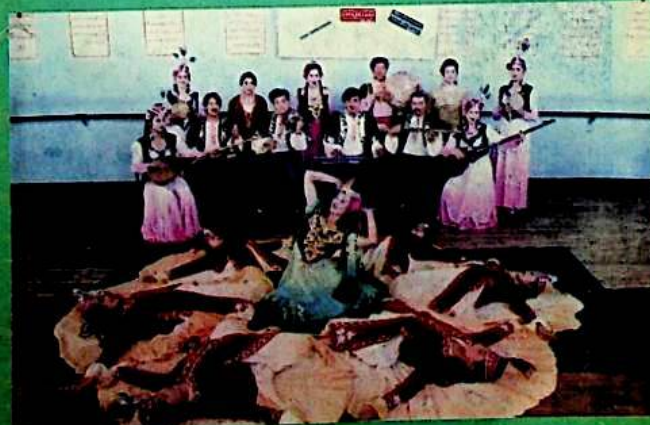
▲ قىزغىن ئىشتىياق