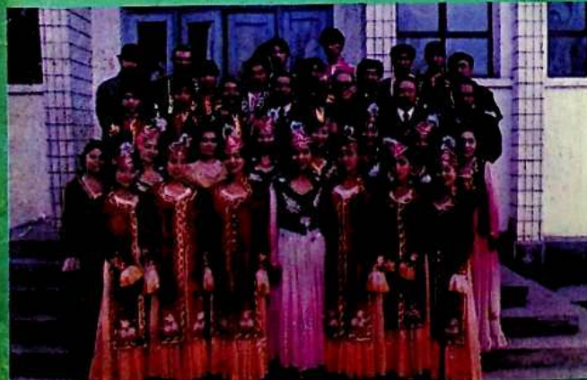
▲ ئۆمەك خاتىمىلىرى جەم بولدى