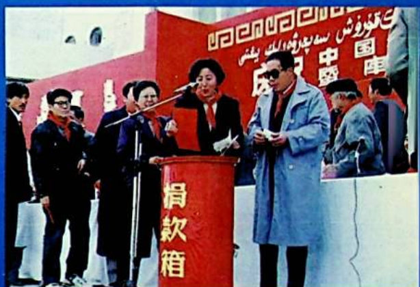
✦ ئوبلاست رەھبەرلىرى ئۆمىد قۇرۇلۇشىغا يول ئىشەنچ قىلماقتا