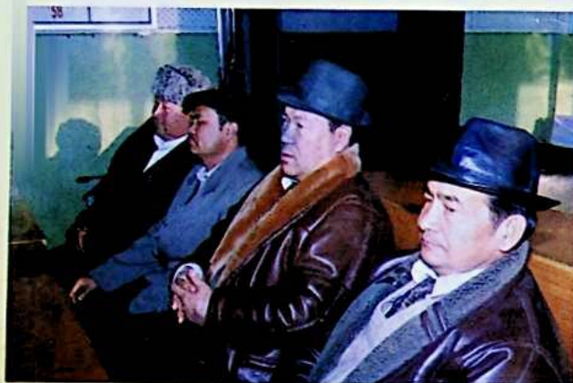
✦ لوپنۇردىكى مەرىپەتپەرۋەرلەر يىغىنىدا