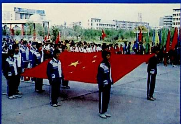
✦ راولايسىۋانغان يىتۈنلەر پائالىيىتى