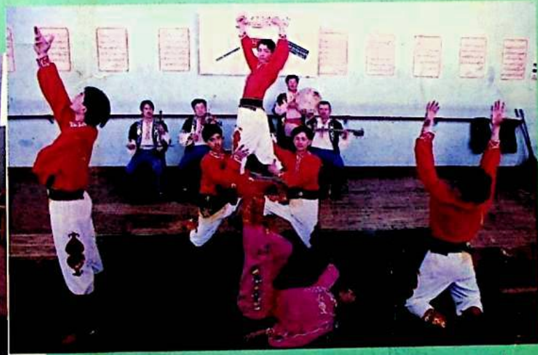
▲ جاپالىق مەشىق