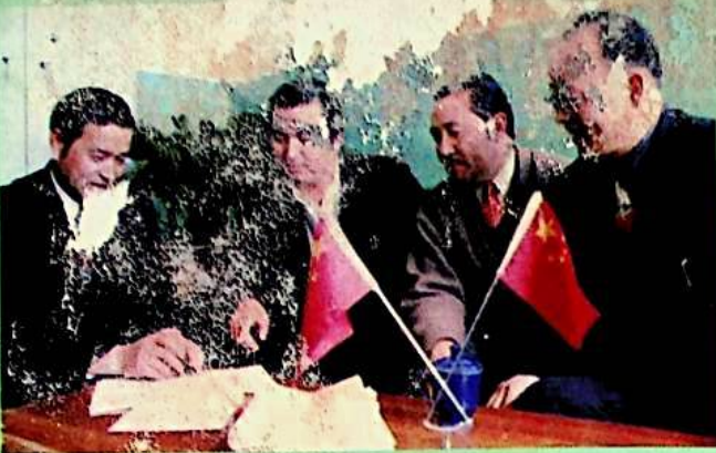
▲ ناھىيە رەھبەرلىرى ئۆمەك تەرەققىياتى ئۈستىدە كۆرسەتمە بەرمەكتە