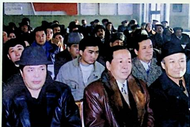
✦ يىغىن قاتناشچىلىرى