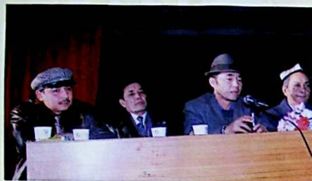
✦ يىغىنغا قاتناشقان قېرىنداش ئەدەبىي ژۇرناللار مەسئۇللىرى