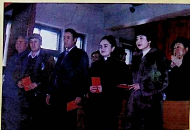
✦ مۇكاپاتلانغۇچىلار سەھنىدە