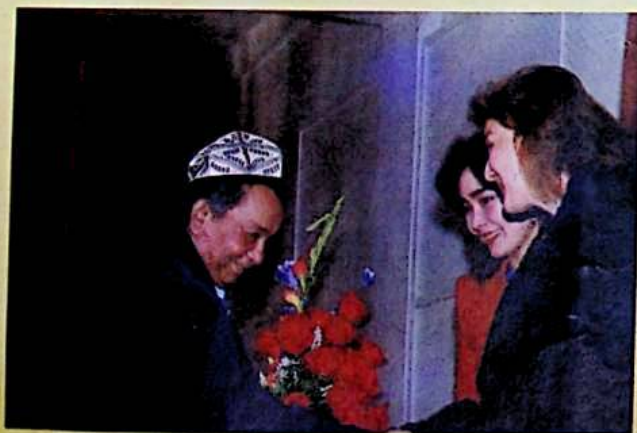
✦ شائىر ئابلىز ھەسەنگە تۇغقانلىرى گۈل تەقدىم قىلماقتا