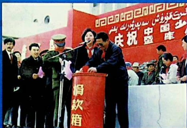
✦ شەھەر خەلقى ئۆمىد قۇرۇلۇشىغا يول ئىشەنچ قىلماقتا