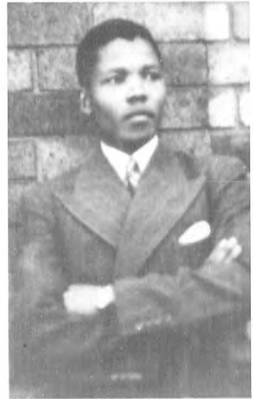
ماندېلانىڭ 19 ياش ۋاقتى