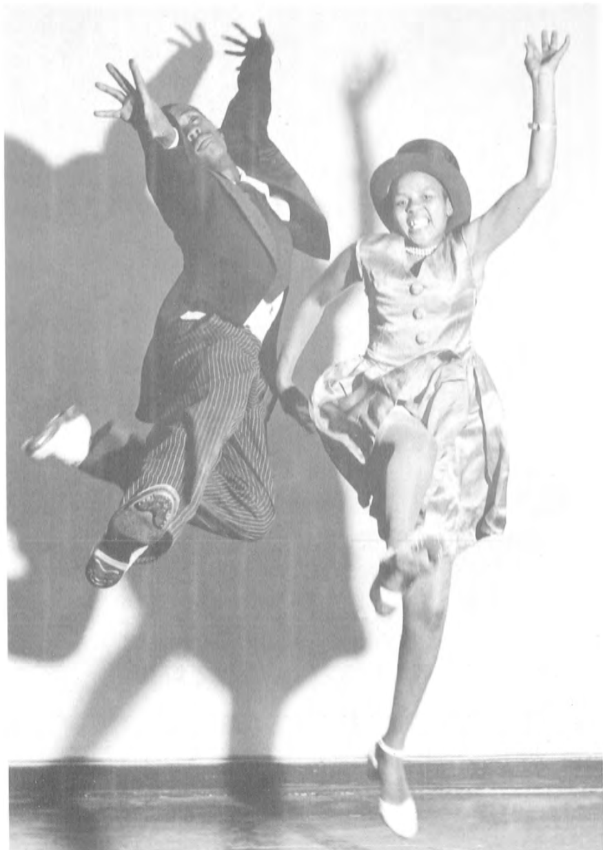
1950 - يوللىرى يوهاننېسزورگتا قارا تەنلىكلەر ھەرىكىتى ئەۋج ئالدى