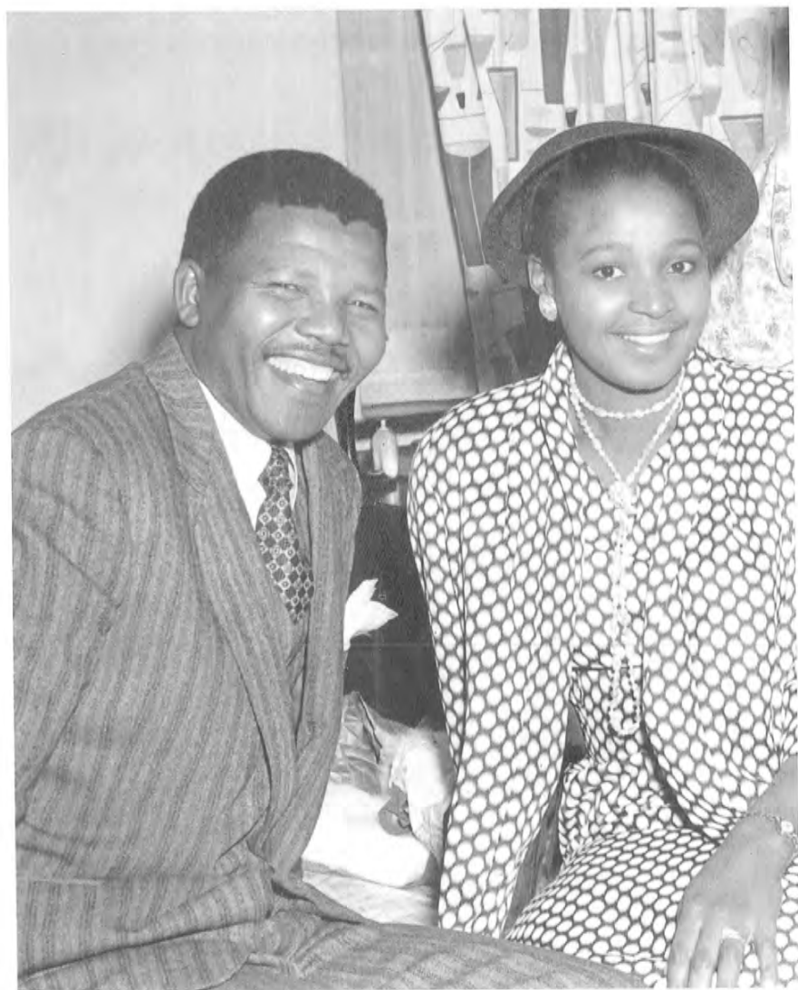
كېلىشكەن مەندىلا ۋە ئۇنىڭ ياش، چىرايلىق ئايالى ۋىنى