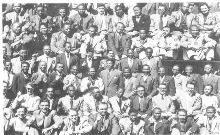
1952 - يىلى مەنسىتمە سلىك ھەرىكىتىدە مائىدېلا مۇتەئەسسەپ زات دوكتور موروكا ھەمدە كوممۇنىزمچى دوكتور دادۇ بىلەن مۇرىنى - مۇرىگە تىرەپ جەڭ قىلماقتا