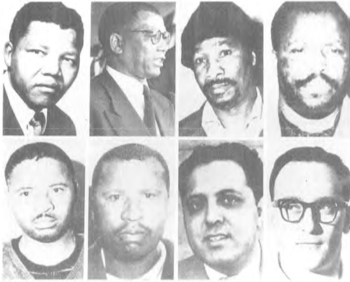
1964 - يىلى رېۋونىيە سوتىدا ئۆمۈرلۈك قاماق جازاسىغا ھۆكۈم قىلىنغان سەككىز كىشى