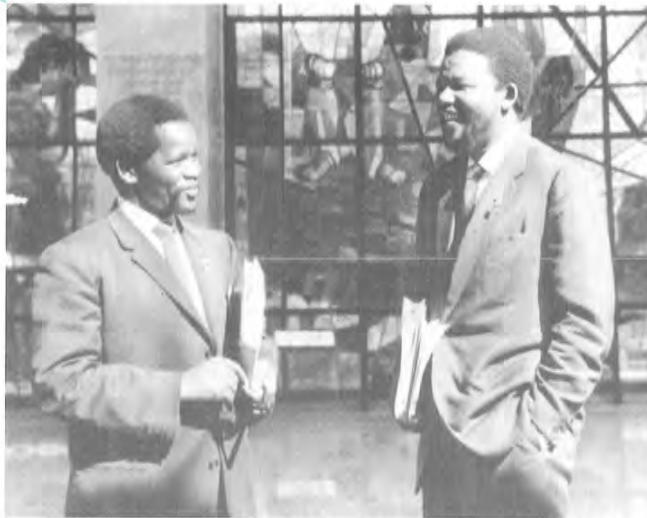
1962 - يىلى ماندىلا ئېفىئوپىيەدىكى بىر يىغىندا سۈرگۈندە تۇرۇۋاتقان ئولمۇپر تامبو بىلەن كۆرۈشتى