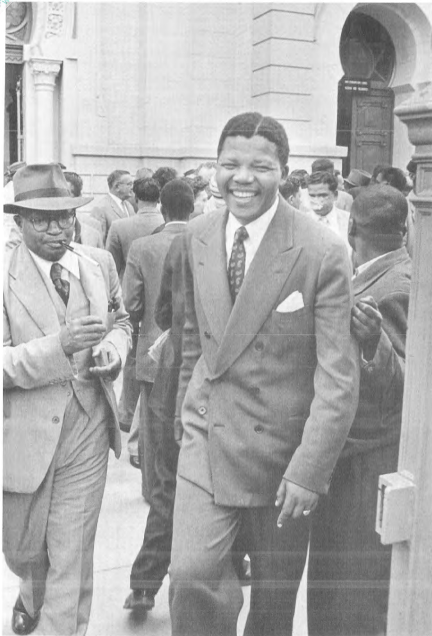
1958 - يىلى ماندىلا دۆلەتكە ئاسىيلىق قىلىش جىنايىتى بىلەن سوتقا تارتىلدى