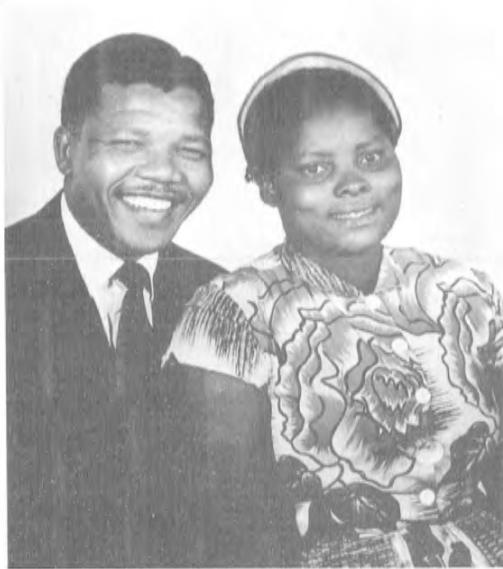
1944 - يىلى ماندېلا بىلەن ئېفرىن ماس يوھاننسىبۇرگتا نىكاھ قەسرنگە قەدەم قويدى