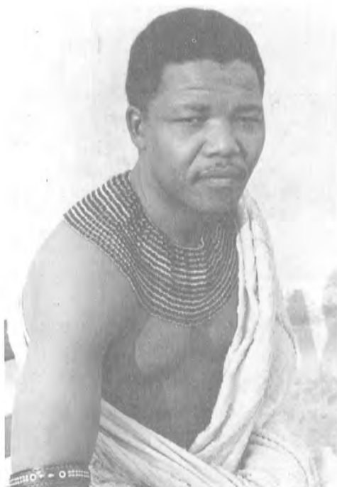
1962 - يىلى كوسا شاھزادىسى ماندىلا قەبىلىسىنىڭ بەلگىسىنى بوينغا ئېسىپ سوتقا چىقتى