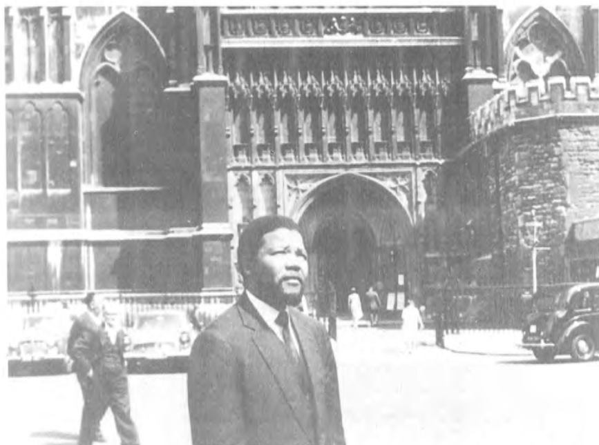
1962 - يىلى 6 - ئايدا ماندىلا لوندوندا