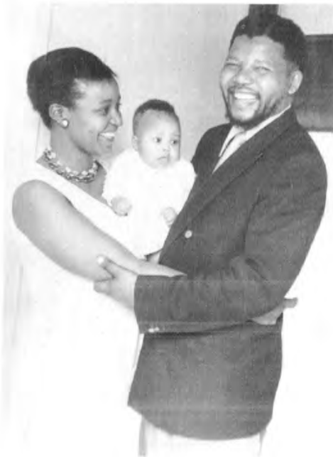
1961 - يىلى ماندېلا، ۋىننى ئەر - ئايال ۋە ئۇلارنىڭ ئىككىنچى قىزى جىندىز