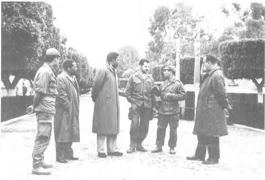
ماندىلا بىلەن روبېرت رىسا ئالجىرىيەگە جايلاشقان ھەربىي ئىشلار باش ئىشتابىدا ئىنقىلاب رەھبەرلىرى بىلەن كۆرۈشتى ھەمدە پارتىزانلىق ئۇرۇشى ھەققىدە ئۇلارنىڭ تەكلىپ - پىكىرلىرىنى ئاڭلىدى