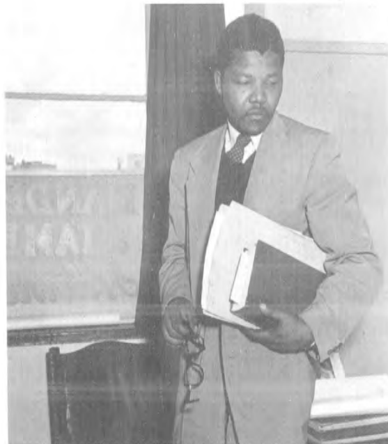
ماندېلا تامبو بىلەن بىللە ئولتۇرىدىغان ئىشخانىسىدا