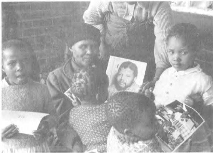
1964 - يىلى ماندىلاننىڭ ئانىسى پرىتورىيەدە ئۆز ئوغلىنىڭ سوتىغا قاتناشتى ھەمدە ئوغلىنىڭ ئۆمۈرلۈك قاماق جازاسىغا ھۆكۈم قىلىنغانلىقىنى ئۆز كۆزى بىلەن كۆردى. تۆت يىلدىن كېيىن، ماندىلاننىڭ ئانىسى روبېن ئارىلىغا ئوغلىنى يوقلاپ بېرىپ بىرنەچچە ھەپتە ئۆتۈپ ۋاپات بولدى