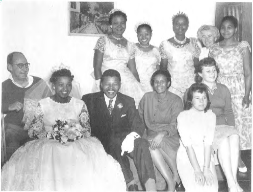
1958 - يىلى ماندېلانىڭ ئىككىنچى ئايالى ۋىننى بىلەن ئۆتكۈزگەن توي مۇراسىمى