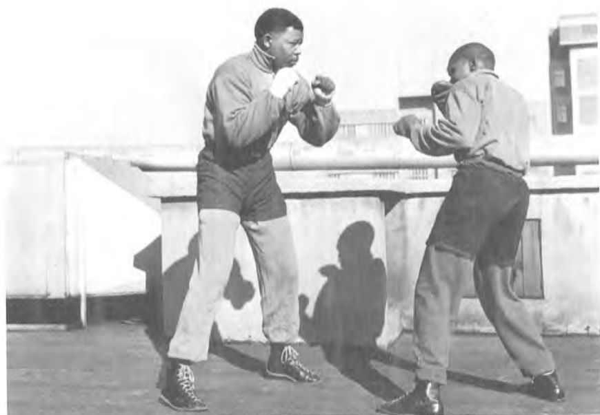
جېرېي موروي قاتارلىق بوكس چېمپيونلىرى بوكس ماھارىتى ھەققىدە پىكىر ئالماشتۇرماقتا