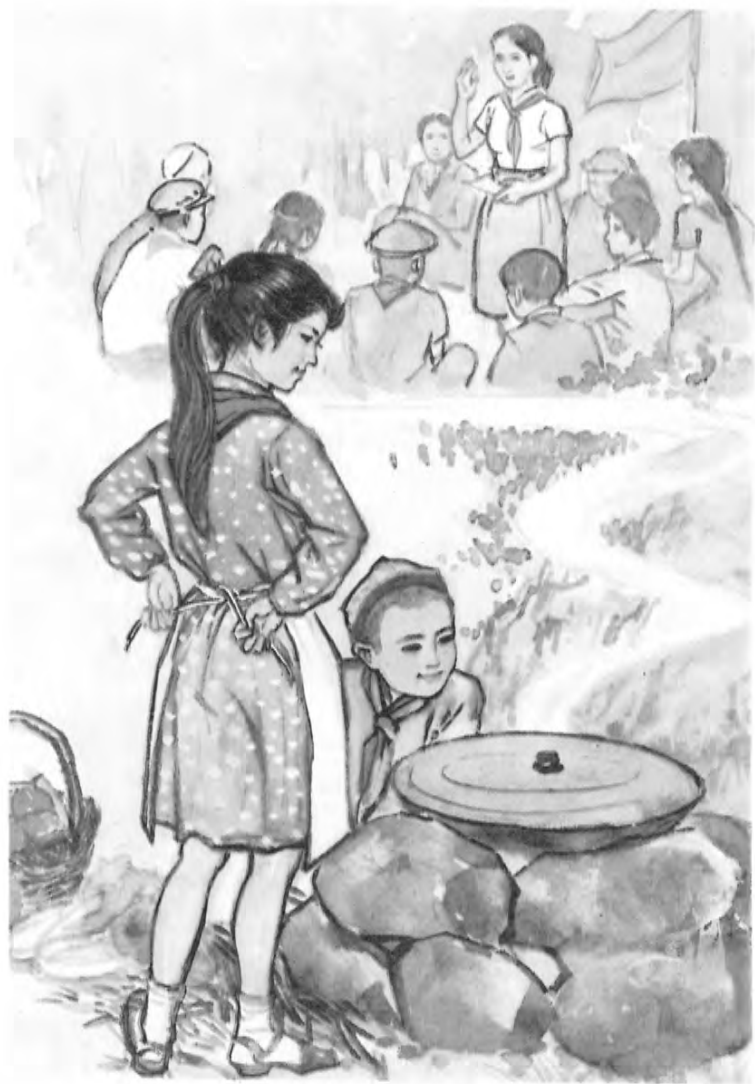
VI ئاساسىي مەشقىنىڭ بەشىنچىسى ئۈچۈن