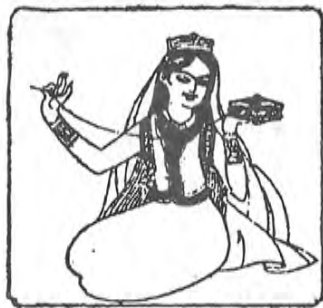
گۈلشەن دوپپا تىكىۋاتىدۇ.