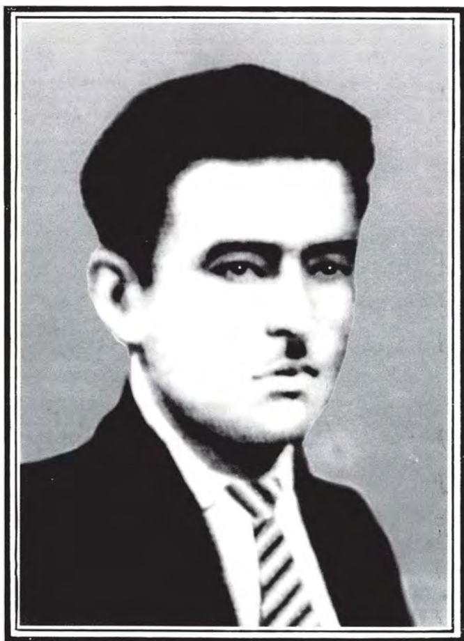
مہمتلی ئہ پھندی