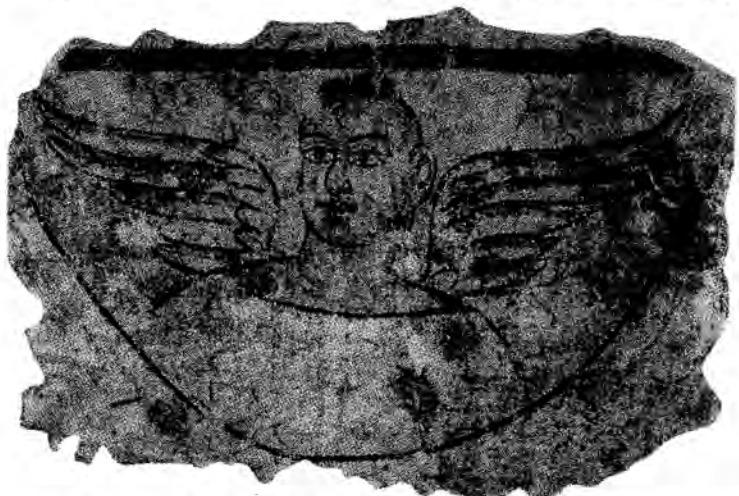
2 - رەسىم مېرەن قەدىمىي شەھىرى خارابىسى ئەتراپىدىن تېپىلغان قاناتلىق ئادەم سۈرىتى

1906 - يىلىدىن 1907 - يىلىغىچە ئەنگلىيىلىك ئېكسپېدىتسىيىچى ستەين 2 - قېتىم شىنجاڭغا كېلىپ ، ئارخېئولوگىيىلىك تەكشۈرۈش ئېلىپ بېرىش جەريانىدا چەرچەن ناھىيىسىنىڭ شەرقىي شىمالىدىكى مېرەن قەدىمىي شەھىرى خارابىسى ئەتراپىدىن يوقىلىش ئالدىدا تۇرغان بىر بۇددا مۇنارى قۇرۇلۇشىنىڭ ئىزىنى ئۇچراتتى (2 - رەسىمگە قارالسۇن) .