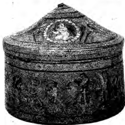
1- رەسىم كۇچا سۇ بېشى بۇددا خارابىسىدىن تېپىلغان جەسەت كۈلى قۇتسىدىكى قاناتلىق ئادەم سۈرىتى

ياغاچتىن ياسالغان بۇ قۇتنىڭ گەۋدە قىسمى يۇمۇلاق ، ئاغزىنىڭ ئۇچى كۈنۈس شەكىلدە بولۇپ ، ئېگىزلىكى 31 سانتىمېتىر ، دىئامېتىرى 37.7 سانتىمېتىر كېلىدۇ . سىرتىغا بىر قەۋەت ئاقۇچ كاناپ رەخت چاپلىنىپ ، ئۈستىگە نەپىس رەسىملەر سىزىلغان ( 1 - رەسىمگە قارالسۇن ) .