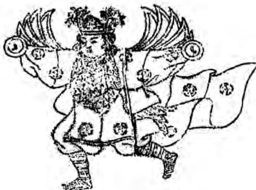
3 - رەسىم لوپنۇر كۆلى ئەتراپىدىن تېپىلغان رەڭلىك كىمخانىنى قاناتلىق ئادەم سۈرىتى

رەسىمدىكى ئوبرازلارنىڭ كۆزلىرى چوڭ ، قانچىلىقى ، بۇدۇر چاچ ، يالىڭاچ بولۇپ ، دۈمبىسىدە ئىككىدىن قاننى بار . خۇددى ئۇچۇپ كېتىۋاتقاندا كىلا كۆرۈنىدۇ ( 3 - رەسىمگە قارالسۇن ) .