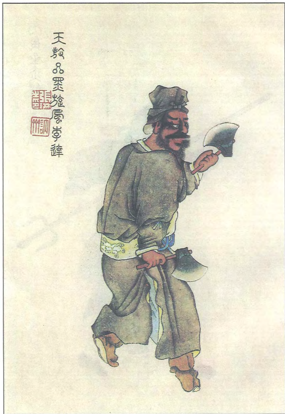
قارا قۇيۇن لى كۆي