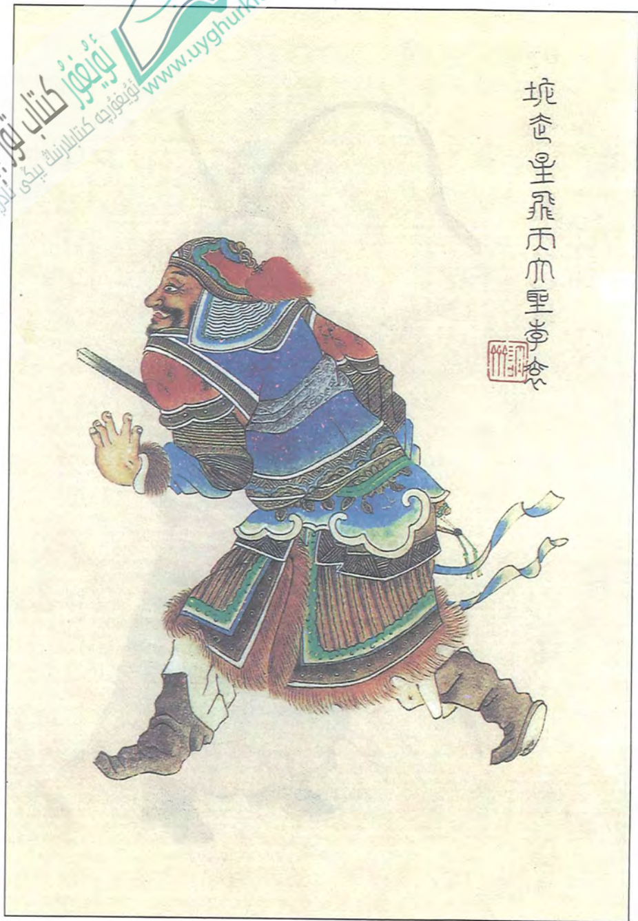
ئۇچار ئەۋلىيا لى گۇن