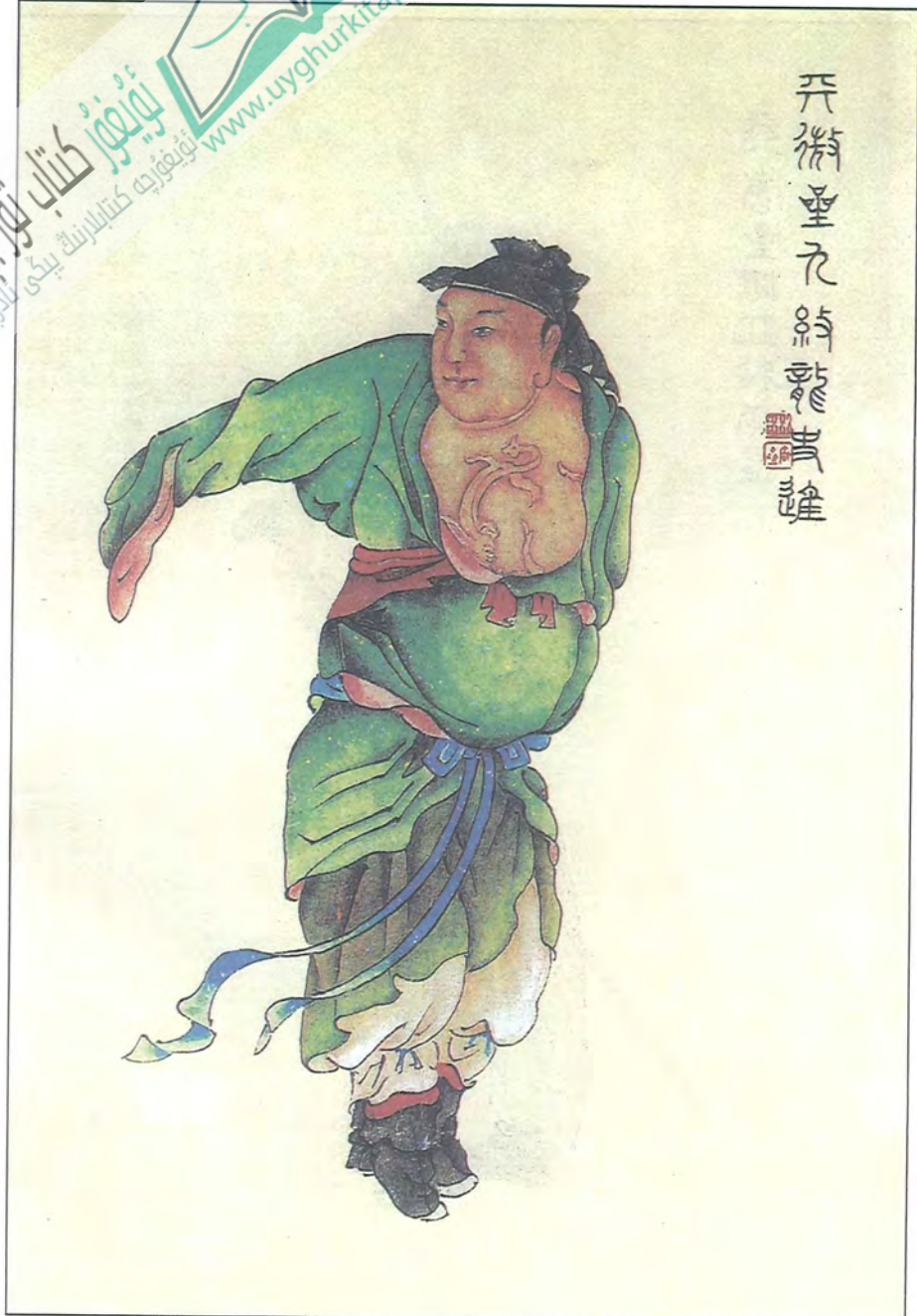
ئەجدىھا يىگىت شى جن