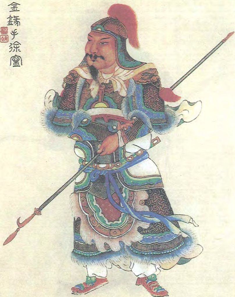
زەر نەيزىۋاز شۇ نىڭ