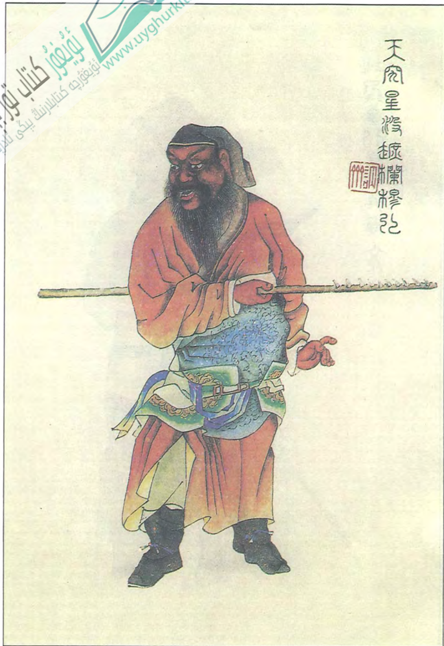
توسقۇنسىز مۇ خۇڭ