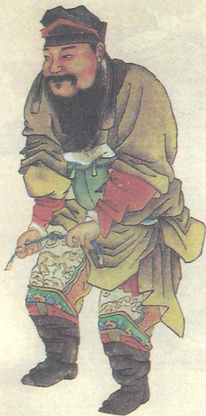
يەل تاپان شەيخ دەي زۇڭ