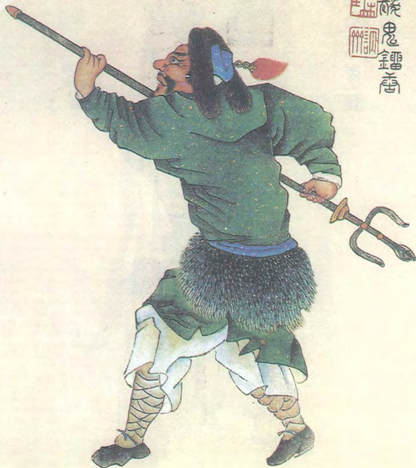
قنزىل چاچ شەيتان ليۇ تاڭا