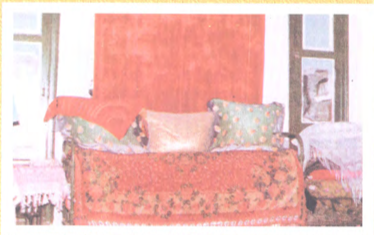
ئورۇن - كۆرپە