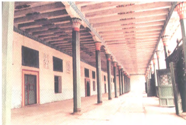
پىشايۋان، تورۇس نەقىشلىرى