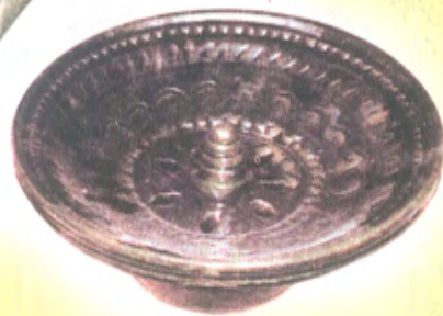
ساپال ئاپتۇئا ۋە چىلاپچا