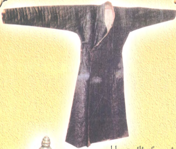
10 - ئەسرگە ئائىت چاپان (يېڭىساردىن تېپىلغان)