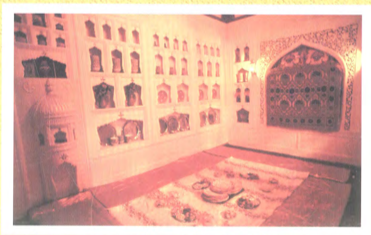
ئويۇق، مەرەپ - لىمىتاق، شرە - تەكچىلەر