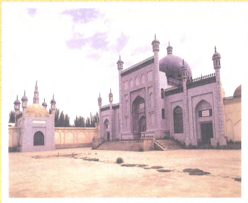
مەشھۇر ئالىم يۈسۈپ خاس ھاجىنىڭ مەقبەرىسى