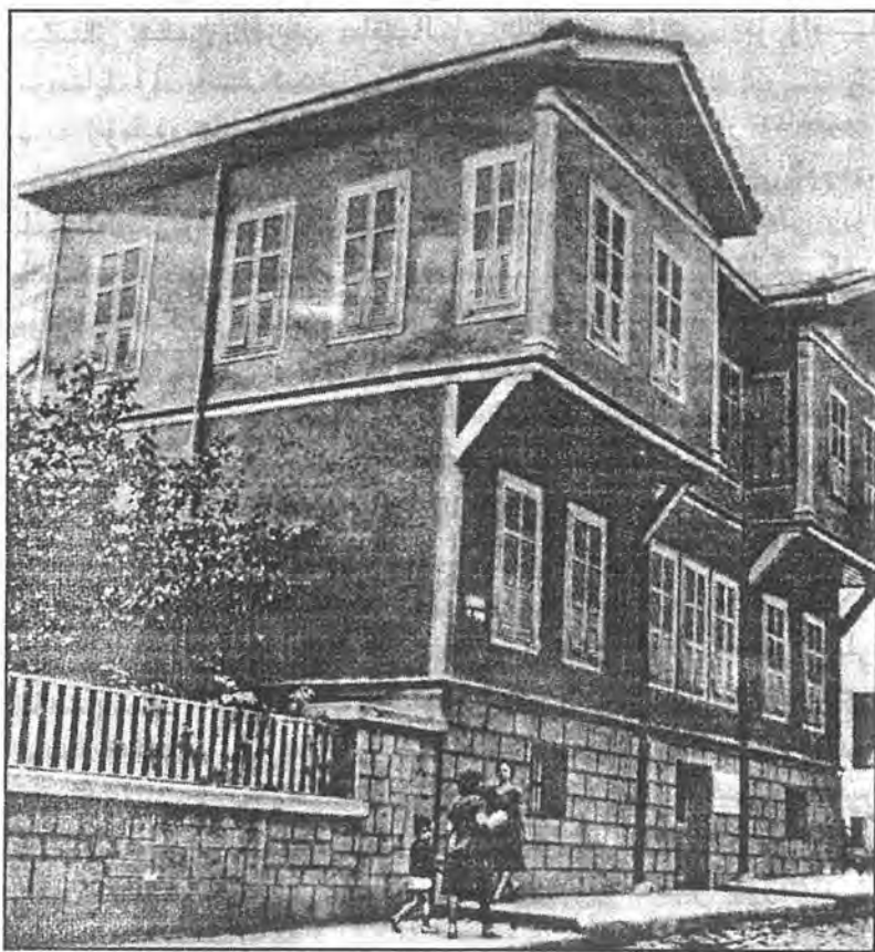
ئاتاتۈركنىڭ تۇغۇلغان ئۆيى

قىزى ئىدى. بۇ ئىككىيلەن سېلانكىتا تونۇشتى. ئۇلار بىر بىرىدىن 20 ياش پەرقلىنەتتى. شۇنداق بولۇشىغا قارىماي، ياش زۆبەيدەنى ياقتۇرۇپ قالغان ئەلى رىزا مەڭزى توقاچتەك قىپقىزىل، خۇش تەبىئەتلىك ۋە مېھىر - شەپقەتلىك بۇ تۈركمەن قىزدىن زادى ۋاز كېچەلمىدى. ئۇ قىز ئائىلىسىنىڭ قاتتىق قارشىلىقىنى ھۈسەين ئاغاننىڭ ياردىمى بىلەن يەڭدى.