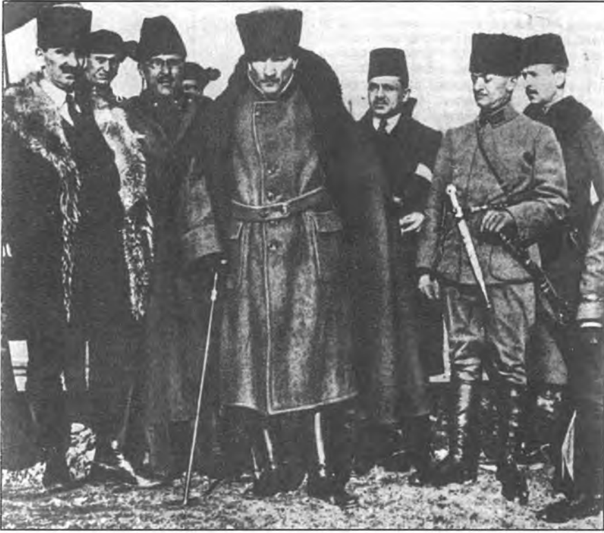
مۇستەقىللىق ئۇرۇشى مەزگىلىدە ساكارىيا جەڭ مەيدانىدا (1921)