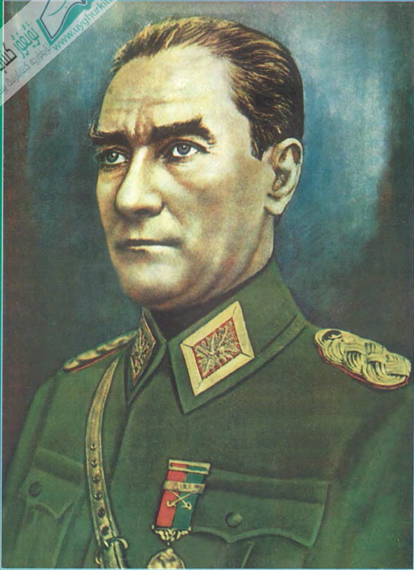
مۇستاپا كامال ئاتا تۈرك