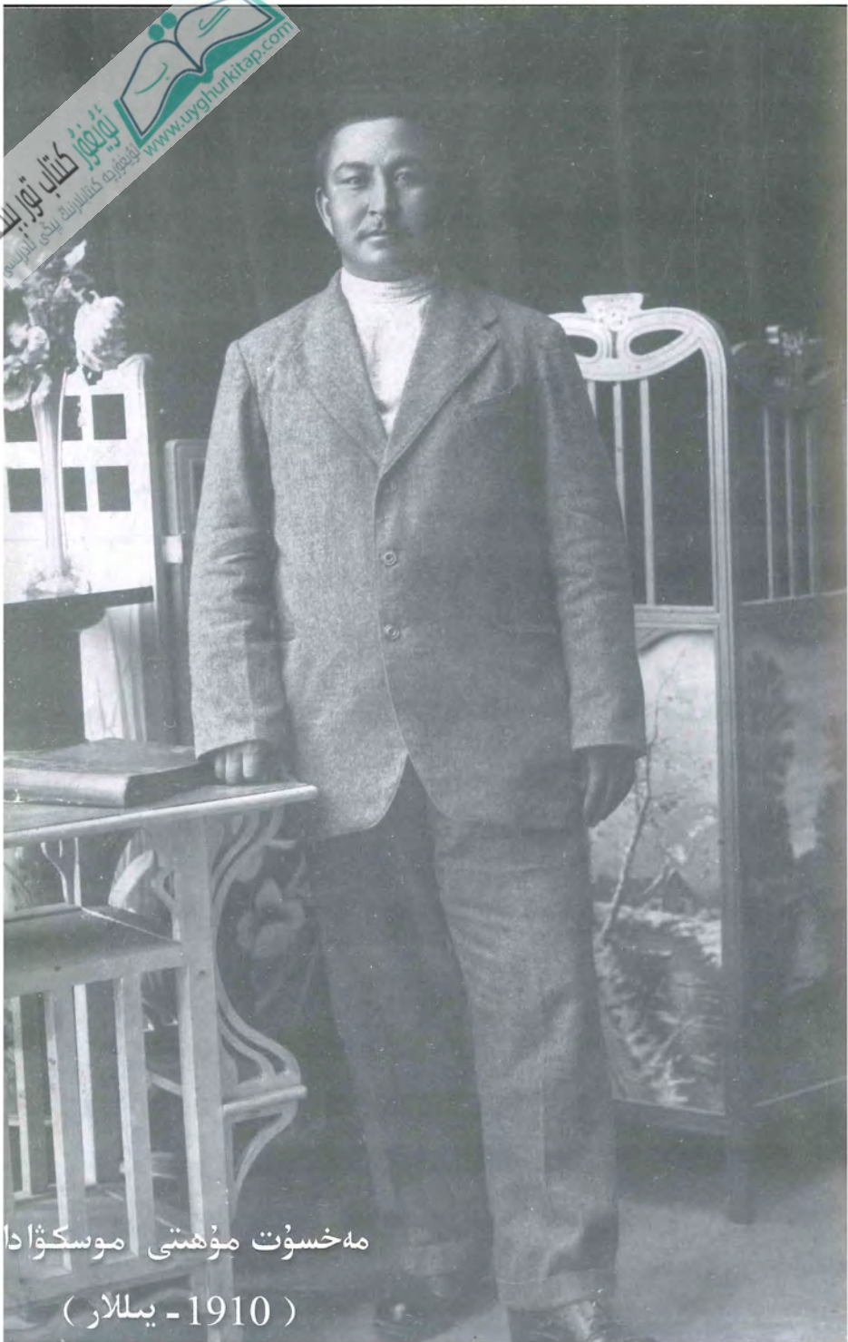
مەخسۇت مۇھىتى موسكۋادا