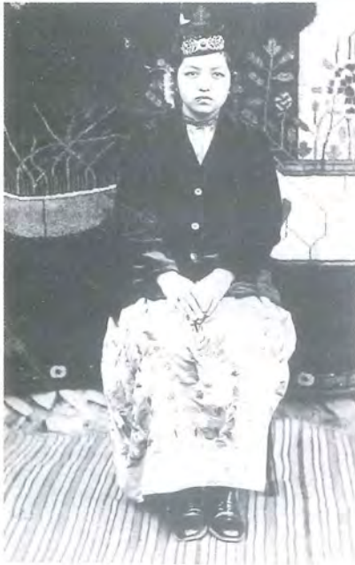
پاتەم مۇھىتى ( مەخسۇت مۇھىتىنىڭ چوڭ قىزى . 1920 — 1976 )