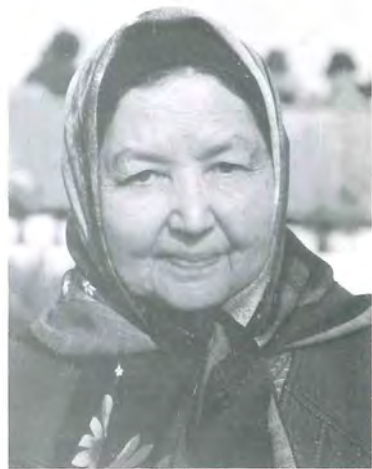
سائادەت مۇھىتى ( 2003 - يىلدا )