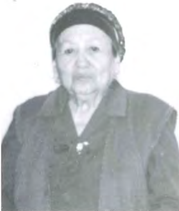
گۆھەر مۇھىتى ( 2002 - يىلدا )