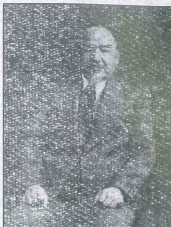
موسۇل مۇھىتى ( 1941 - 1870 )