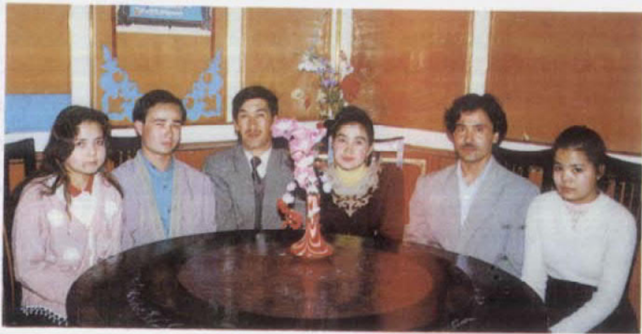
بىر قىسىم رېستوران خادىملىرى