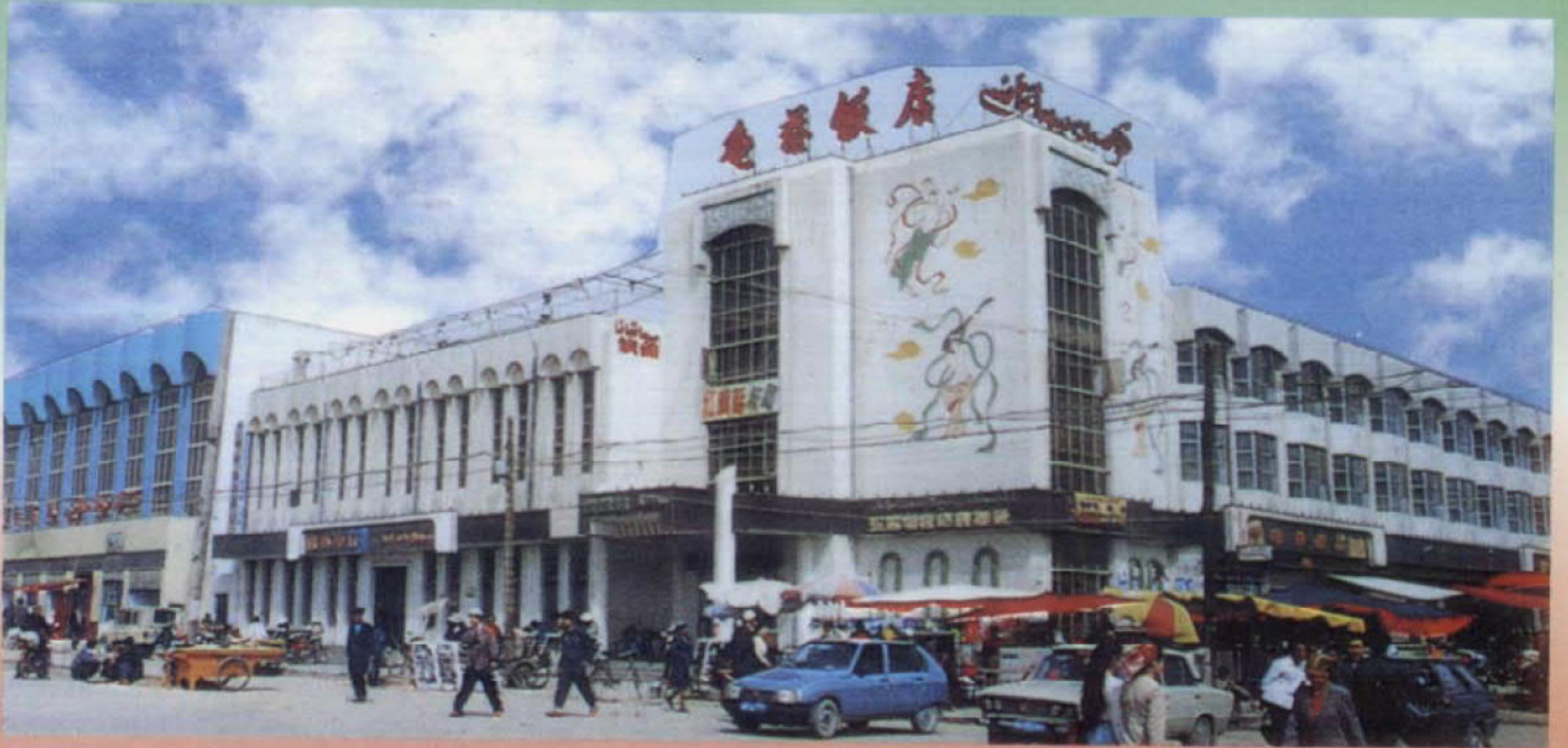
كۆسەن مېھمانخانىسى، تانسىخانا، رېستوران، ئىتتىپاق سودا سارىيى