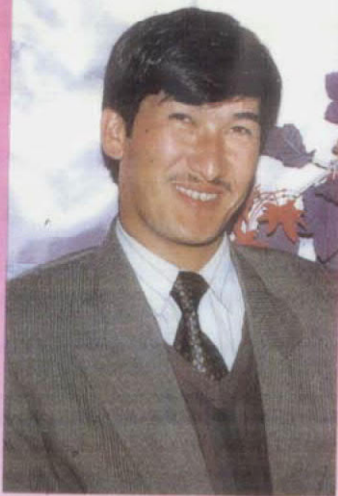
دېرېكتور: ئابدۇرىشت مېجىت