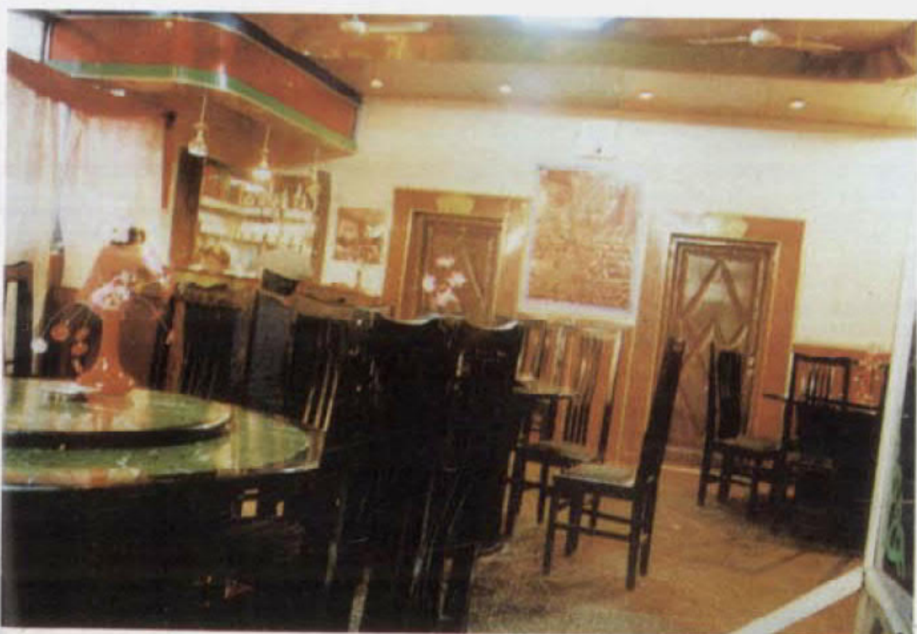
رېستوراننىڭ ئىچكى كۆرۈنۈشلەرى