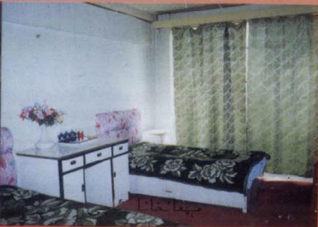
كۈچا يېمەك- چىمەك مۇلازىمەت شىركىتى

مەزكۇر شىركەت مېھمانخانا (كۆسەن مېھمانخانىسى)، سودا سارايى (ئىتتىپاق سودا سارىيى)، تانسىخانا ۋە رېستورانلارنى بىر گەۋدە قىلغان ئۈنۈملىك شىركەت بولۇپ، كۈچا ناھىيىسىنىڭ ئەڭ ئاۋات يېرى ۋە ئۈرۈمچى - قەشقەر تاشيول بويىغا جايلاشقان. ئۇ سىزنىڭ سىز ئۈستىدىكى ئەڭ ياخشى ئارامگاھىڭىز بولالايدۇ.