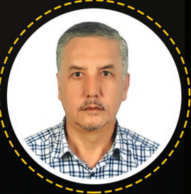
ئابدۇلئەھد ھەد ھاپىز