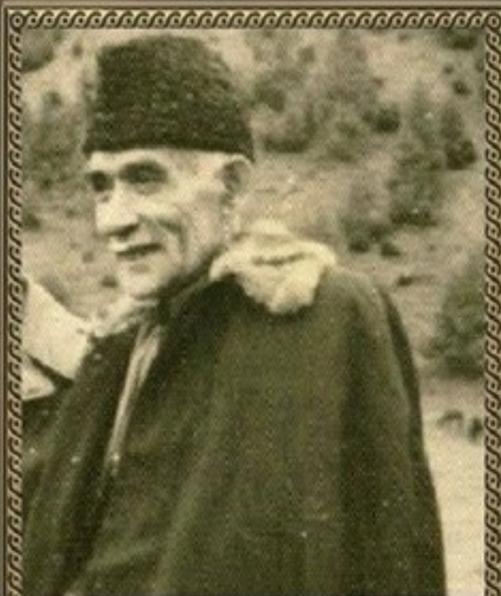
مەسئۇت سابىرى بايقۇزى 1952 - 1887