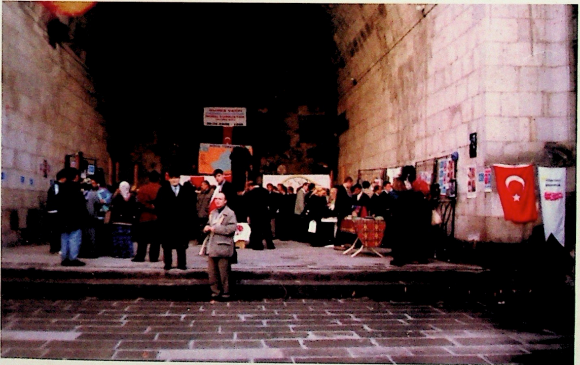
Doğu Türkistan Günleri Kültür ve Sanat Etkinlikleri çerçevesinde Doğu Türkistan Sergisi açıldı. Çifte Minareli Medrese Erzurum.