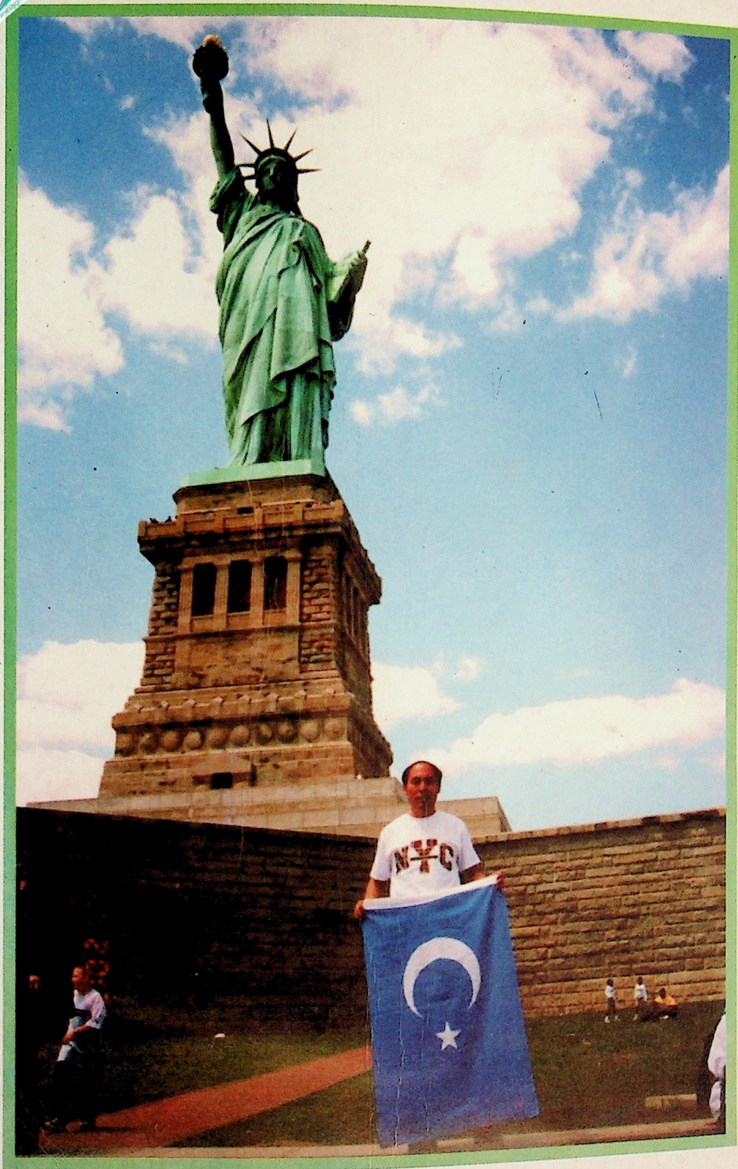
DOĞU TÜRKİSTAN'A HÜRRIYET