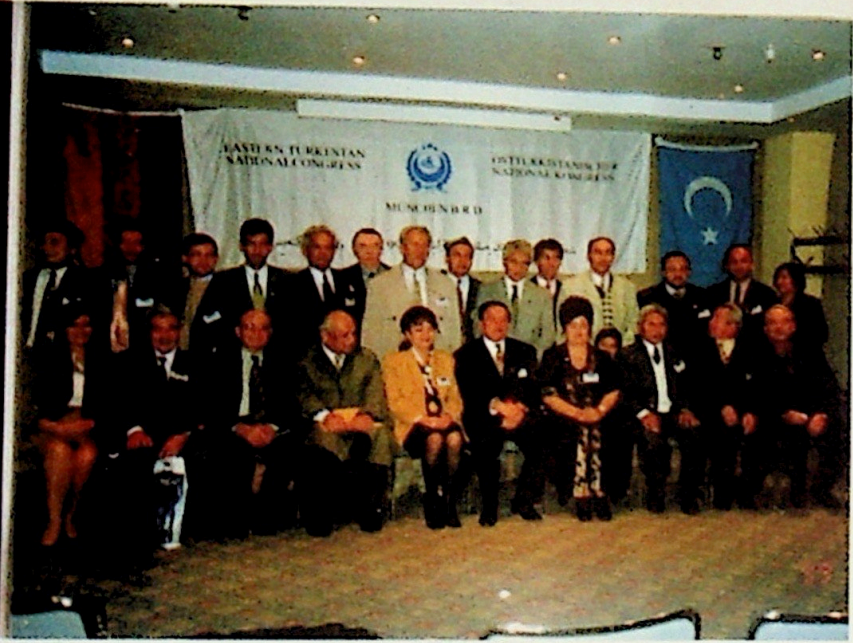
11 Ekim 1999 tarihinde yapılan Doğu Türkistan'da İnsan Hakları İhlalleri Sempozyumu ve II. Doğu Türkistan Milli Kurultayı'na katılan delegeler