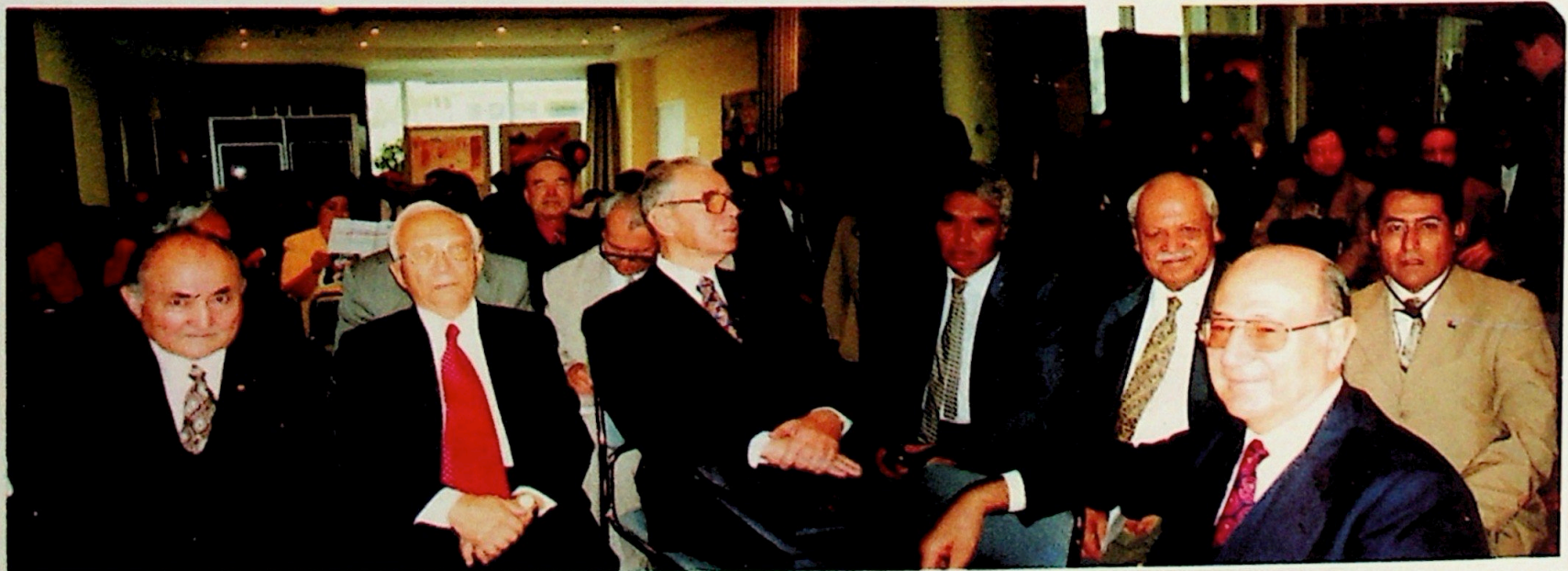
Doğu Türkistan Milli Kurultayı'ndan görüntüler.