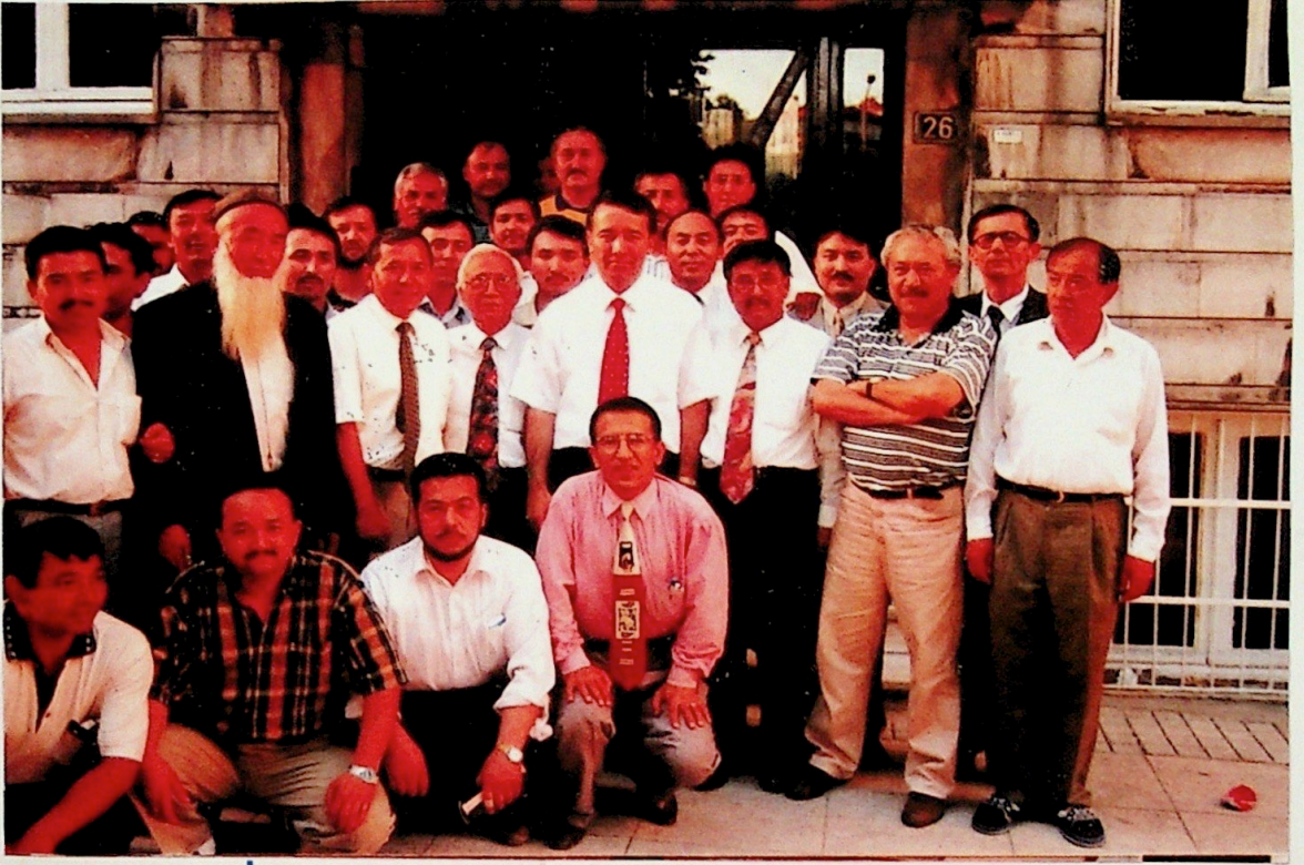
Devlet Bakanı Andıcan Vakfı ve Dernek Üyeleriyle