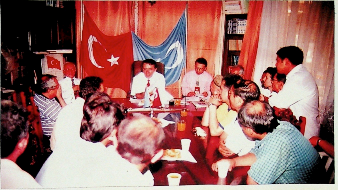
Devlet Bakanı Andıcan Vakfını Ziyarette