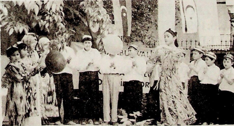
Türkistanlı çocuklarımız milli oyunlarını sergilerken