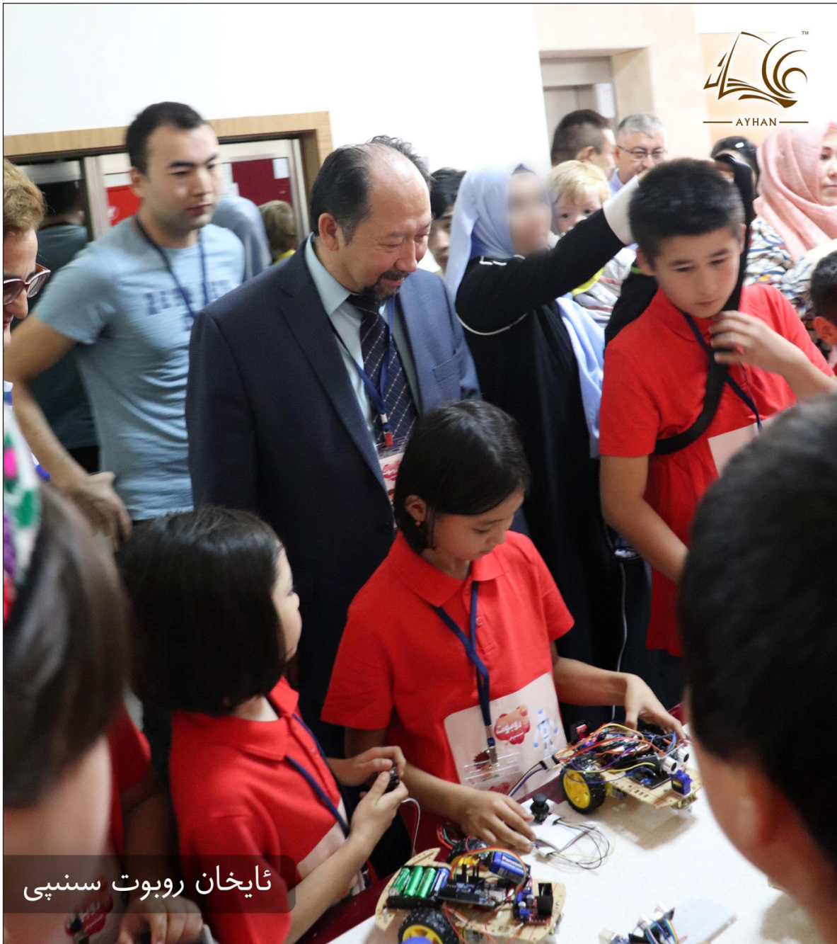
ئايخان روبوت سىنىپى

UPF 2019 - يىلى 6 - ئاينىڭ 12 - كۈنى ئامېرىكا ئىزىملىتىلىپ ياكى قۇرۇلۇپ، شۇ يىلى 12 - ئاينىڭ 13 - كۈنى «تاپاۋەتسىز تەشكىلات» سالاھىيىتىگە ئېرىشتى. UPF قىسمەن تۈرلەرنى ئۆزى قىلغاندىن باشقا، كۆپىنچە ۋاقىتتا باشقىلار قىلماقچى بولغان ياكى باشلىغان، ئۇيغۇر تىلى، ئۇيغۇر مەدەنىيىتى ۋە ئۇيغۇر مىللىي كىملىكىنىڭ باشقا ئېلېمېنتلىرىنى چەت ئەلدە ساقلاپ قېلىشقا، چەت ئەلدىكى ئۇيغۇرلارنى كۈچلەندۈرۈشكە ھەمدە ئۇيغۇرلارنىڭ بېشىغا