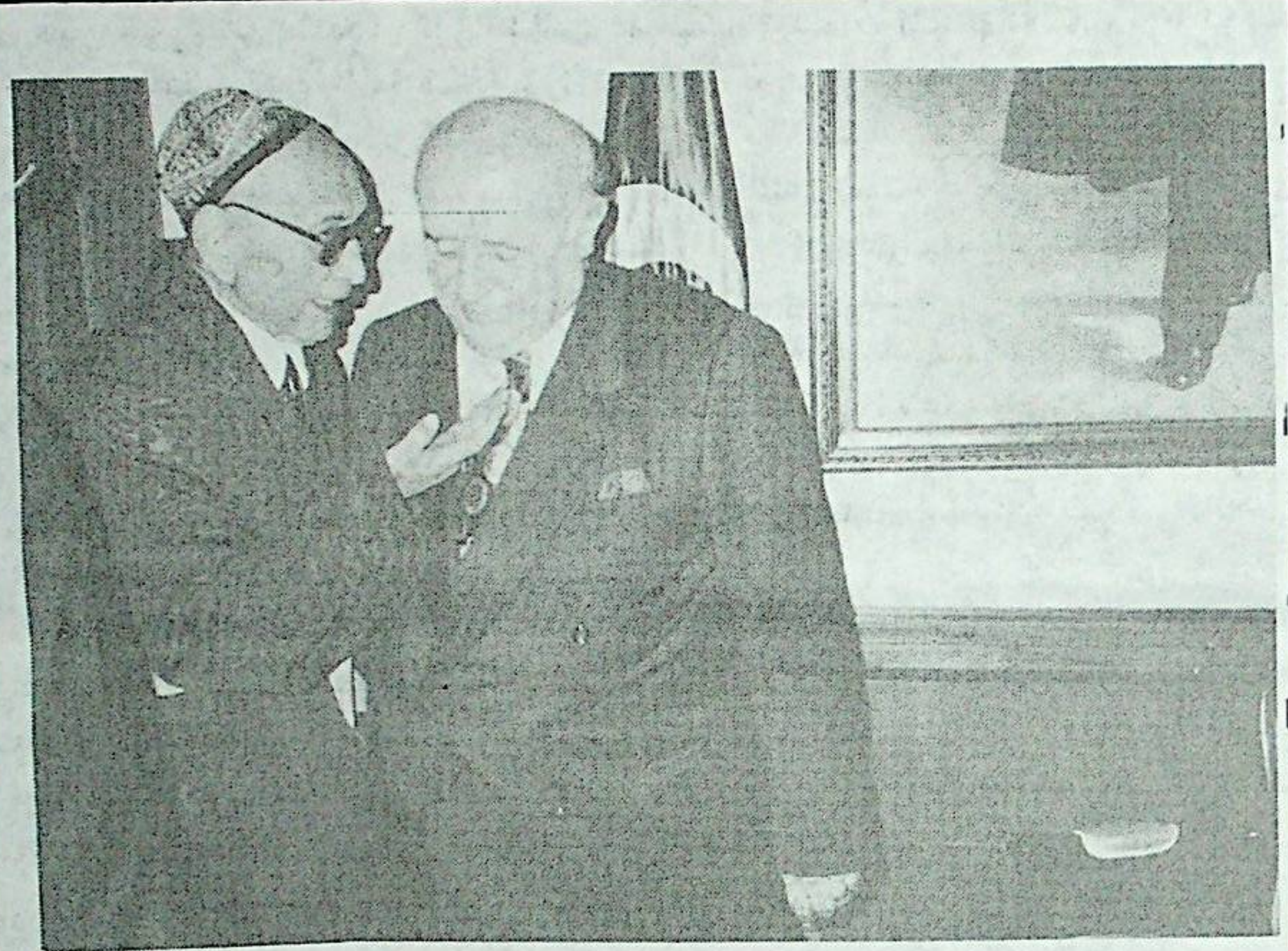
مەرھۇم ئەيسا يۇسۇپ ئالىپ تېكىن 1992 - يىلى تۈركىيە جۇمھۇرىيەت رەئىسى ۋە 30 نەچچە يىللىق قەدىمىي دوستى مۇلايىمان دېمىرال بىلەن بىرگە.

ھامان ئىسمىمىز مۇستەقىللىق ھەرىكىتىگە بېقىشىلىمىزدا كۈرەش جەڭچىسىدە ھەمەتلىك ئۇلۇغ ئۇستازىمىز ئەيسا يۇسۇپ ئالىپ تېكىن ۋاپاتىنىڭ بىر يىللىقىنى خاتىرىلەۋاتقان ۋاقىتىمىزدا، ئۇنىڭ ئۆمرىنىڭ ئاخىرى - قىيىنچىلىق مەداپات - پات تەكرارلايدىغان تۆۋەندىكى ئازاتلىق ئۇچۇن كۈرەش قىلىش پىرىنسىپلىرىنى ئەسلىپ ئۆتۈشنى مۇھىم ئەھمىيەتكە ئىگە دەپ قارايمەن. رەھمەتلىك ئازادلىقنى قولغا كەلتۈرۈشنىڭ يولى توغرىسىدا ناھايىتى قىممەتلىك قاراشلارنى ئوتتۇرىغا قويغان ئىدى. ئەمما، ئۇنىڭغا قارىتا ھەلقىمىز ئىچىدىكى بەزى بىر خاتا چۈشەنچىلەر دىن خالى بولالمايدۇ، بۇخىل نا توغرا چۈشەنچىلەر دەپ بولغانلىرىنىڭ قارىشىچە، كويىسا ئەيسا يۇسۇپ ئالىپ تېكىن مىللىي مۇستەقىللىق ھەرىكىتىنى ئوقۇلغۇن - لىقشۇرۇپلا ما تىك ھەرىكەت دەپ ئىسسىدە چەكلەپ قويغان. بۇخىل قاراش، ئۇلۇغ ئۇستازىمىزنىڭ ئىرادىسىنى توغرا ئىپادىلەشكەنمىگە، مىللىي مۇستەقىللىق ھەرىكىتى پىرىنسىپلىرىنى ئىجرا قىلىشىمىزغا مەلۇم توسالغۇلارنى كەلتۈرۈپ چىقىرىشى مۇمكىن.