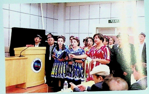
ئوقۇغۇچىلار شېئىر دېكلاماتسىيە قىلماقتا