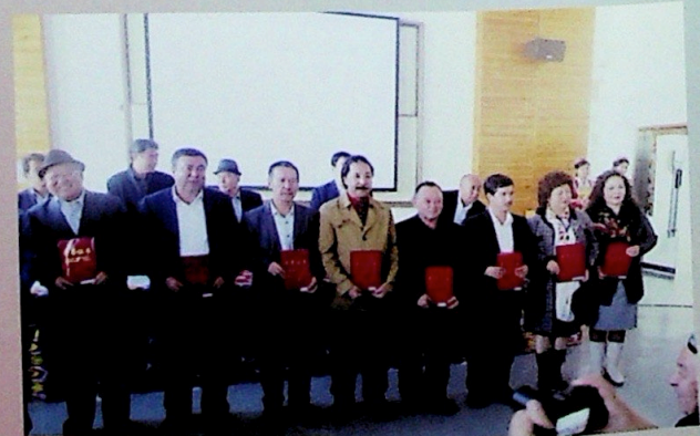
مۇكاپاتقا ئېرىشكەن قىسمەن تەتقىقاتچىلار