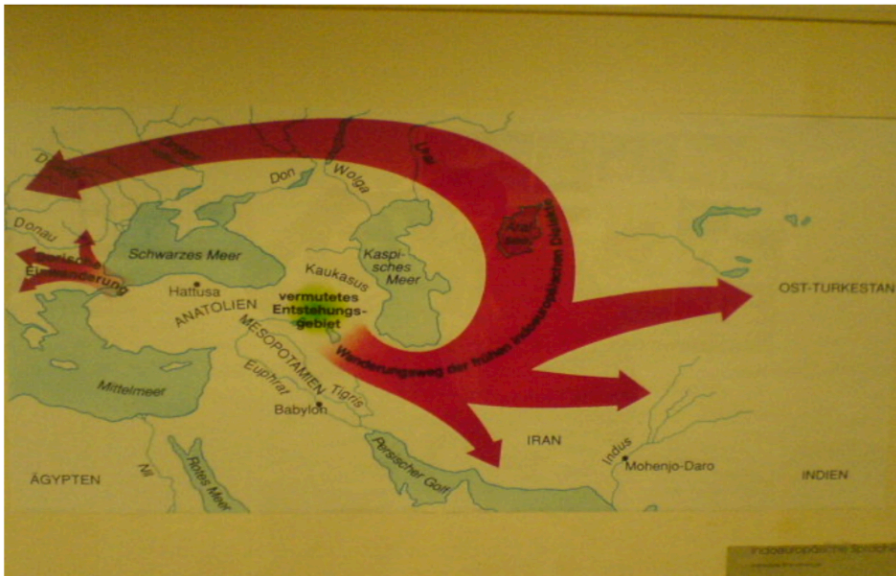
Language of the Uyghurs – Origin from the languages of the Altai-Turkish-System

ئىسپاتلاپ چىققان. ئۇيغۇر تىلى قانداقتۇر ئۆزبېك، تاتار، تۈرك قاتارلىق ئالتاي تىلى سىستېمىسىدىكى تىللار بىلەن يېقىن بولماستىن، بەلكى بۇ تىللارنىڭ پەيدا بولۇشىدىكى يىلتىزدۇر. دۇنيادىكى تىللارنىڭ پەيدا بولۇش مەنبەسى كۆرسىتىلگەن تۆۋەندىكى خەرىتىدىن بۇ نۇقتىنى كۆرۈۋېلىش مۇمكىن. تۆۋەندىكى خەرىتە گېرمانىيەدىكى تىل