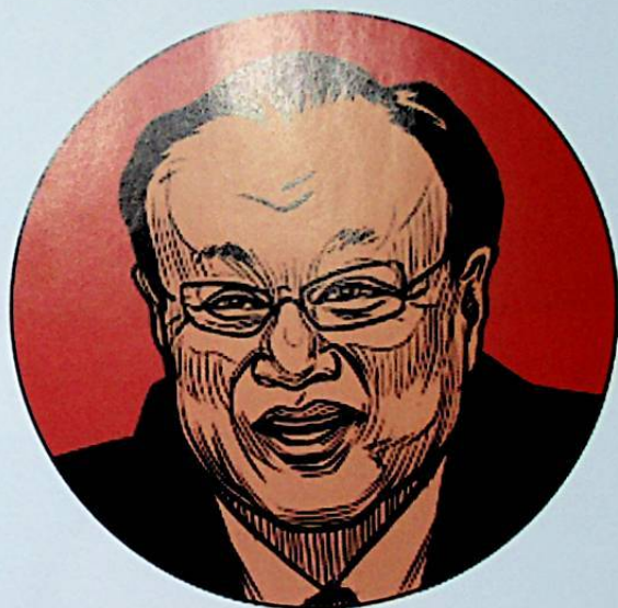
■ ئۇيغۇر ئاپتونوم رايونىنىڭ قورچاق رەئىسى شۆھرەت زاكىر