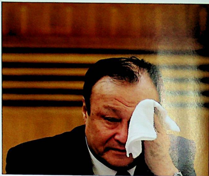
■ رەئىس سەھنىسىدە پۈتۈن ۋۇجۇدىنى قارا تەر باسقان شۆھرەت زاكىر