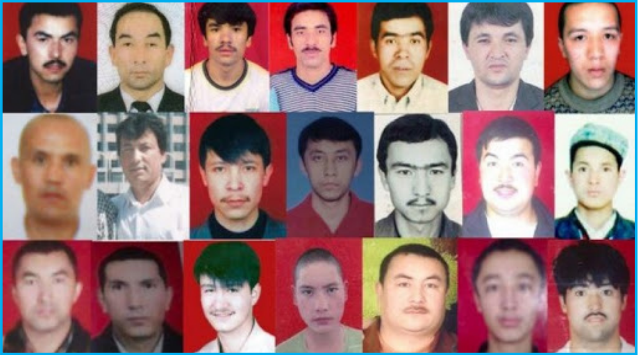
رەسىم 15: 5-ئىيۇل نامايىشىغا قاتناشقان دەپ قارىلىپ تۇتۇش بۇيرىقى چىقىرىلغان ئۇيغۇر ياشلار.

باستۇرۇش سىياسىتىنىڭ كەڭ كۆلەمدە يولغا قويۇلغانلىقىنى، ئىككى خىزمەتدېشىنىڭ ئىز-دېرەكسىز يوقاپ كەتكەنلىكىنى ئېيتتى. بېرىلگەن مەلۇماتلارغا قارىغاندا، قەتلىئامدىن كېيىن ئۈرۈمچىدە ئۇيغۇرلار ياشايدىغان مەھەللىلەرنىڭ كىرىش-چىقىش نۇقتىلىرى خىتاي قوراللىق ساقچىلار تەرىپىدىن توسۇۋېتىلگەن ۋە 10 كۈنگىچە سىرتقا چىقىش چەكلەنگەن.