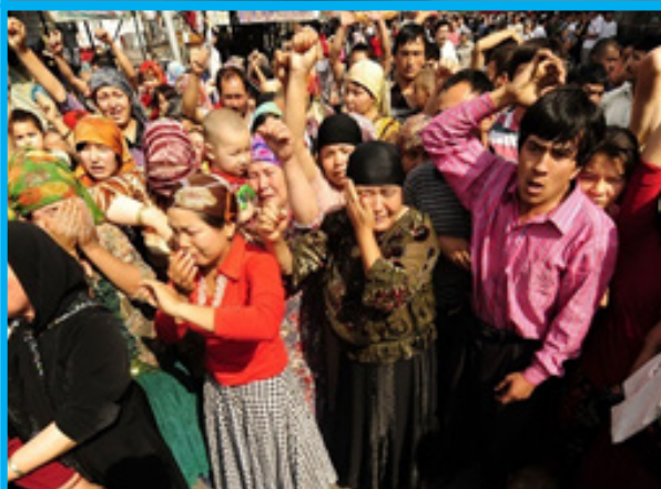
رەسىم 10: يوقاپ كەتكەن يېقىنلىرىنى ئىزدەپ نامايىشقا چىققان ئۇيغۇرلار