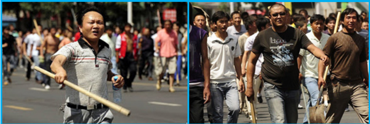
رەسىم 13:7-ئىيۇل كۈنى ئۇيغۇرلارنى ئۆلتۈرۈش ئۈچۈن كۈچلەرغا چىققان ئىرقچى كۆچمەن خىتايلار.