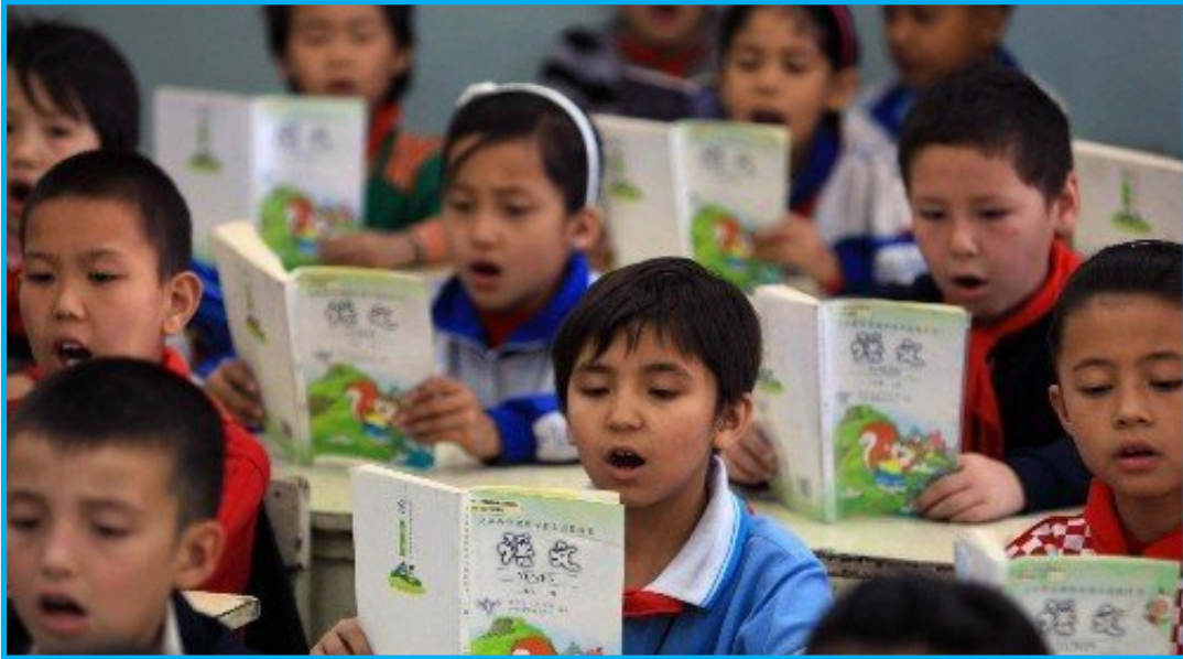
رەسىم 1: ئۈرۈمچىدىكى بىر باشلانغۇچ مەكتەپنىڭ 3-يىللىق ئۇيغۇر ئوقۇغۇچىلىرى ۋە خىتايچىلەشتۈرۈلگەن ئەدەبىيات كىتاب. مەنبە: خىتاي خەۋەر ئاگىنتلىقى، 2009-يىل

قويغان. 13 شەرقىي تۈركىستانلىقلار قوش تىل مائارىپى نامىدىكى خىتايچە مەجبۇرىي مائارىپ تۈپەيلى ئانا تىلنىڭ يوقىلىش خەۋپىگە دۇچ كېلىدىغانلىقىنى تونۇپ يەتتى. ئەمما، بۇ سىياسەتكە قارشى چىقسا، بۆلگۈنچىلىك ۋە تېررورلۇق جىنايىتى بىلەن جازالىنىدىغانلىقىنى ھەم