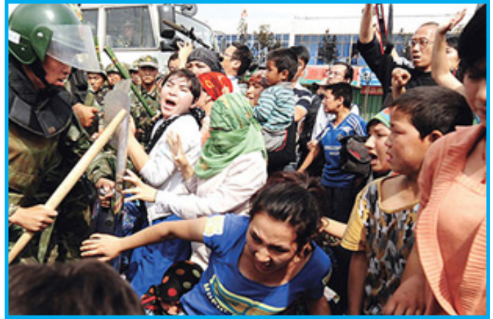
رەسىم 6: قەتلىئامدا يولدىشى ياكى قېرىنداشلىرى غايىب بولغان ياكى زۇلۇمغا چىدىمىغان ئاياللارنىڭ نامايىش كۆرۈنۈشلىرى