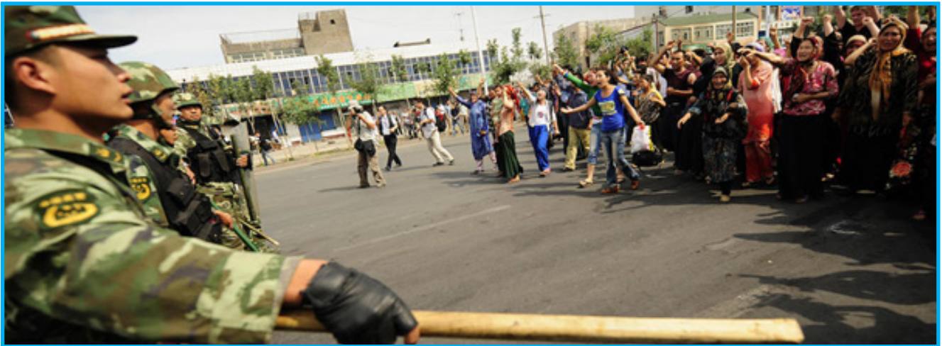
رەسىم 20: قىرغىنچىلىقنىڭ كېيىنكى كۈنلىرىدە يوقاپ كەتكەن ئەرلىرىنى ئىزدەپ نامايىش قىلىۋاتقان ئۇيغۇر ئاياللىرى

ختاي دۆلىتى 5-ئىيۇلدىكى قەتلىئامنى دۆلەت ئىچى ۋە سىرتىدىكى تېررورلۇق كۈچلىرى ھەمكارلىشىپ پەيدا قىلغان بۇزغۇنچىلىق ۋە زوراۋانلىق ۋەقەسى دەپ تەشۋىق قىلدى. ئاساسىي ھوقۇق ۋە ئەركىنلىك تەلەپ قىلىشتىن باشقا مەقسەتنى يوق شەرقىي تۈركىستانلىقلار تېررورچى، رادىكال ئىسلامچى ياكى بۆلگۈنچى سۈپىتىدە كۆرسىتىلدى. ئەمەلىيەتتە، بولۇپ ئۆتكەن ھەممە ئىشنىڭ سەۋەبى يىللاردىن