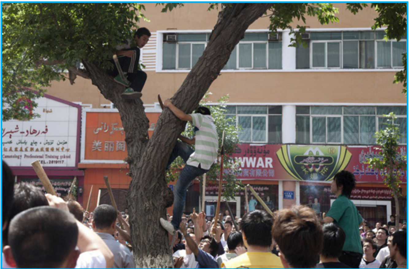
رەسىم 12: نۇرغۇنلىغان خىتايلىرىنىڭ بىر ئۇيغۇر ياشنى ئۆلتۈرمەكچى بولغاندىكى كۆرۈنۈش، 2009-يىلى 7-ئىيۇل.

بىللە چىقىپ ئۆيىگە قاراپ ماڭغانلىقىنى، ئەپسۇسلىنارلىقى مەھەللىگە ئاز قالغاندا خىتايلىرىغا ئۇچراپ قېلىپ خىتايلىرى تەرىپىدىن ئۇرۇپ ئۆلتۈرۈۋېتىلگەنلىكىنى ئىلاۋە قىلدى. ئەنۋەر مەمەت يەنە خىتايلىرىنىڭ بىر ئۇيغۇر ساقچىنى كۆرسىتىپ خىتاي ساقچىلاردىن ئۇنىڭ ساقچى فورمىسىنى سالدۇرۇۋېتىشىنى ۋە ئۆزلىرىنىڭ ئۇنى ئۆلتۈرۈۋەتكۈسى بارلىقىنى ئېيتقانلىقىغا شاھىت بولغان. ئەنۋەر يەنە،