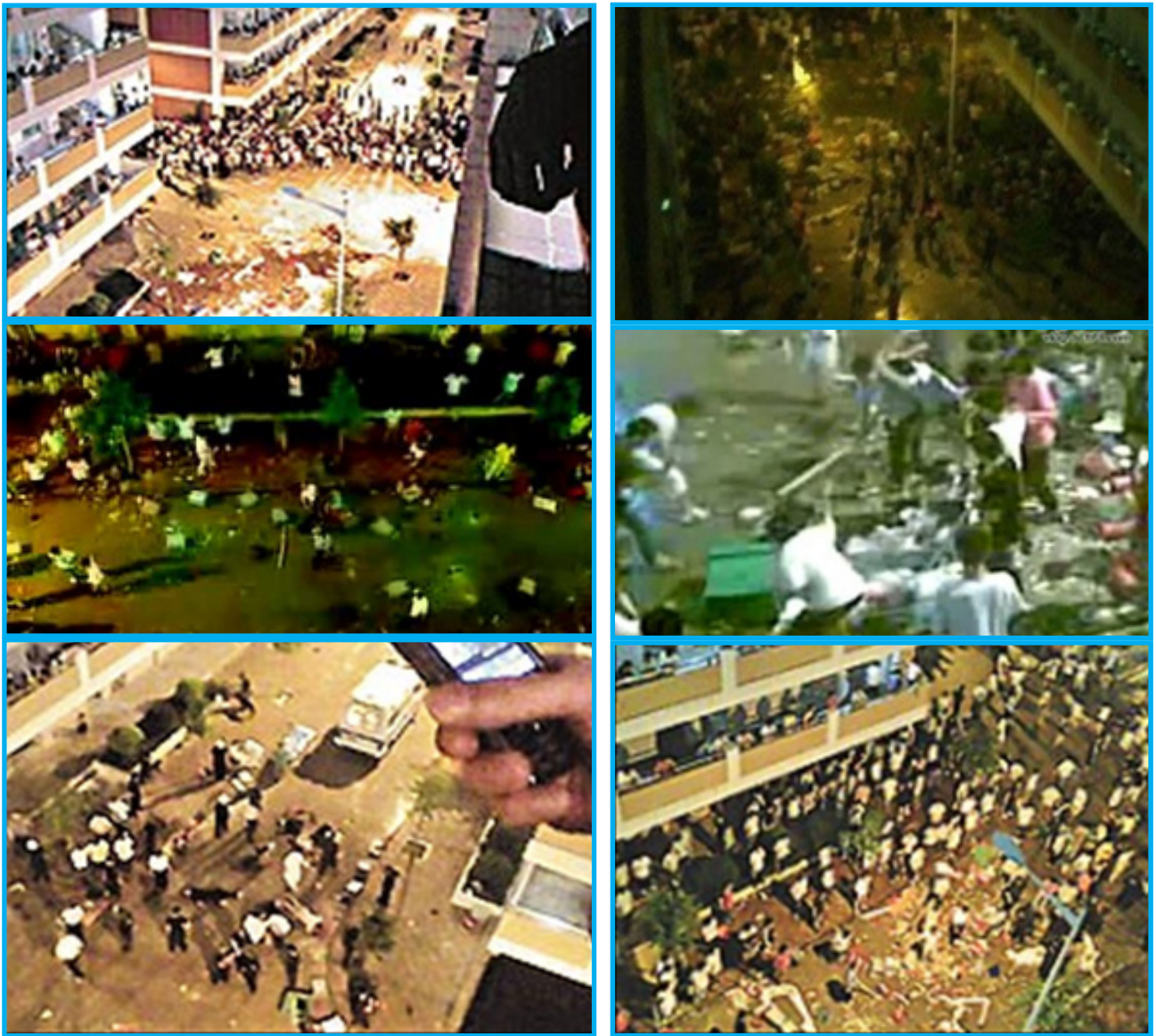
رەسىم 4: 6-ئاينىڭ 26-كۈنى ، شاۋگۈەندىكى ئويۇنچۇق زاۋۇتىدا خىتاي ئىشچىلىرىنىڭ ئۇيغۇرلارغا ھۇجۇم قىلغان قەتلىئام مەيدانى كۆرۈنۈشلىرى

شاۋگۈەن شەھىرىدىكى ئويۇنچۇق زاۋۇتىغا مەجبۇرىي ئېلىپ كېتىلگەن ئۇيغۇرلارنىڭ 26-ئىيۇن خىتايلار تەرىپىدىن ئۇرۇپ ئۆلتۈرۈلگەنلىكى خەۋىرى ياشلار ئارىسىدا كۈچلۈك ئىنكاس قوزغىدى. ۋەقەنىڭ سىن كۆرۈنۈشلىرى QQ دا كەڭرى تارقالغان بولسىمۇ، 5-ئىيۇلغىچە «ختاي ھۆكۈمىتى» ھېچقانداق رەسمىي بايانات ئېلان قىلمىدى. «ئانا تىلىم»، «دىيارىم» ۋە «سەلگىن» قاتارلىق ئۇيغۇرچە مۇنبەرلەردە خىتاي دائىرىلىرىنىڭ بايانات بەرمەسلىكى ۋە ئۇيغۇرلارنىڭ ئۆلتۈرۈلۈش سەۋەبى توغرىسىدا جىددىي مۇنازىرىلەر بولدى ۋە 7-ئاينىڭ 5-كۈنى، خىتايلارنى بايانات ئېلان قىلىشقا مەجبۇرلاش ئۈچۈن ئۈرۈمچى خەلق مەيدانىغا يىغىلىش نامايىش ئۆتكۈزۈش پىكرى ئوتتۇرىغا قويۇلدى.