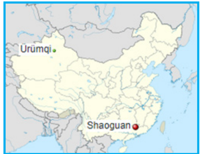
خەرىتە 1: ئۈرۈمچى ۋە شاۋگۈەننىڭ خەرىتىدىكى ئورنى

ھۇجۇمدا ئۆلتۈرۈلگەن 20 كىشىنىڭ 10 ى ئاياللار ئىكەن. يەنە گۇاھچىلارنىڭ بىلدۈرۈشىچە، گەرچە ھۇجۇمنىڭ بېشىدا نەق مەيداندا 20 ئەتراپىدا ساقچى بولسىمۇ، ئەمما ئۇلار توسۇشقا ئۇرۇنمىغان. 23 شاۋگۈەندىكى يەرلىك خىتاي ھۆكۈمەت ئەمەلدارلىرى جۇ فامىلىلىك بىر خىتاينىڭ توردا تارقاتقان «ئالتە ئۇيغۇر ئىككى خىتاي ئايالغا باسقۇنچىلىق قىلدى» دېگەن ساختا خەۋەرنىڭ بۇ ۋەقەگە سەۋەب بولغانلىقىنى ئېلان قىلدى. 24 6-ئاينىڭ 28-كۈنى، ۋەقەگە مۇناسىۋەتلىك 13 كىشى قولغا ئېلىنغان بولۇپ، ئۇلارنىڭ ئۈچى ئۇيغۇر ئىدى. 25 2009-يىلى 10-ئۆكتەبىر، شاۋگۈەن تەپتىش مەھكىمىسى ئۈچ ئۇيغۇر ۋە تۆت خىتاي ئۈستىدىن ئەرز سۇنغان بولۇپ، بىر خىتاي ئۆلۈم جازاسىغا ھۆكۈم