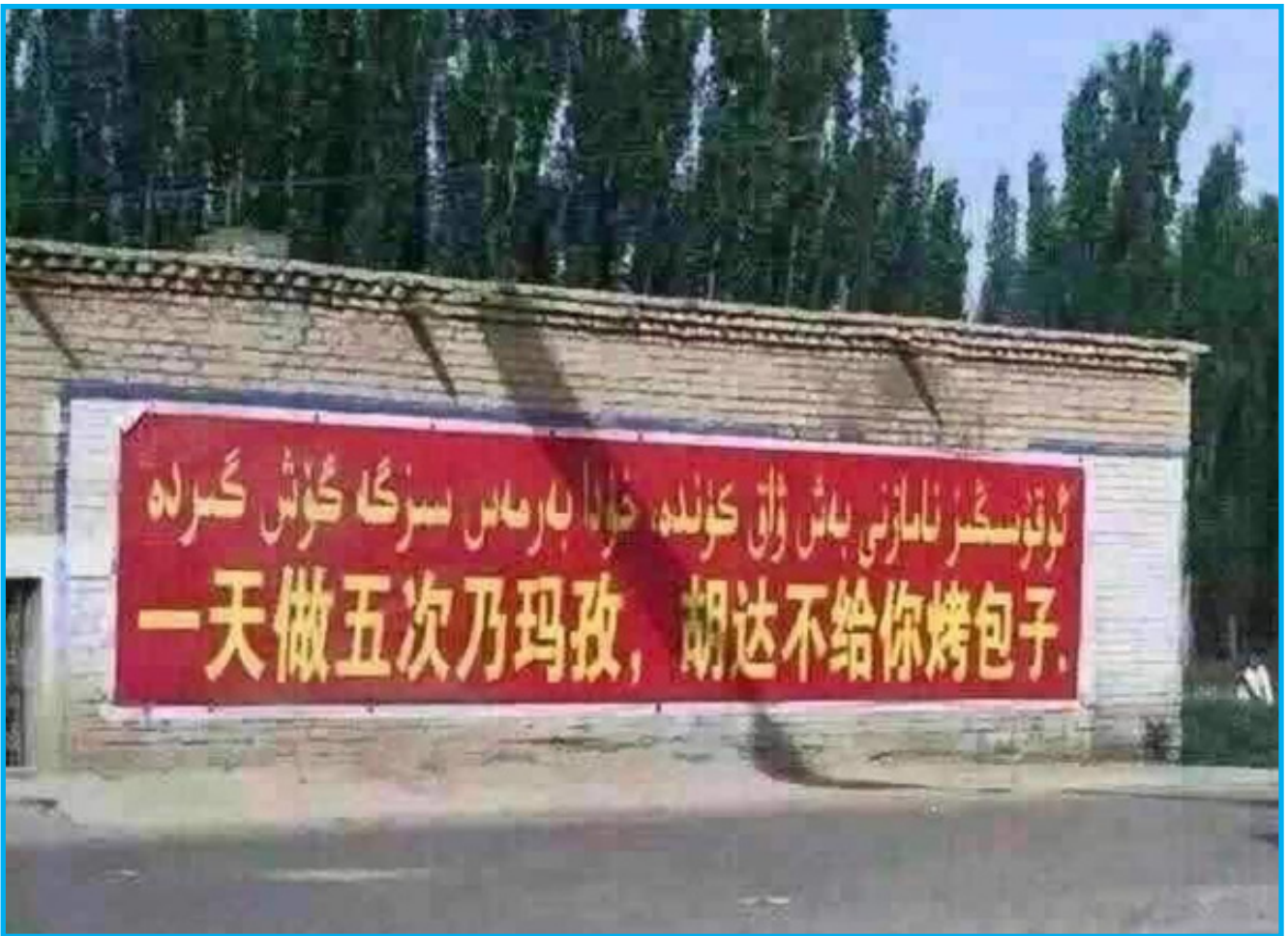
رەسىم 3: دىنسىزلىق تەشۋىقاتى ۋە دىنىي ھاقارەتلەش: ئوقۇسۇڭىز نامازنى بەش ۋاق كۈندە، خۇدا بەرمەس سىزگە گۆش گىرە

ختاي شەرقىي تۈركىستاندىكى دىنىي پائالىيەتلەرنى «دۆلەتنىڭ مۇقىملىقىغا تەھدىت» دەپ قارىدى ۋە مۇسۇلمانلارنى يىللاردىن بېرى دىنىي ئىبادەت ۋە دىنىي نەشىر بويۇملىرىنى باھانە قىلىپ تۈرمىلەرگە سولاپ كەلدى. 1990-يىلى 6-ئاي ۋە 8-ئايلاردا، نۇرغۇن مۇسۇلمانلار قەشقەردە مەسچىت ۋە دىنىي تەلىم-تەربىيە ئورۇنلىرىنىڭ تاقىلىشىغا قارشى تارقاتىلغان تەشۋىقات ۋاراقچىسى سەۋەبىدىن قولغا ئېلىندى. ئابدۇمالىك ئەنە شۇلارنىڭ بىرى ئىدى. ئۇ 1990-يىلى 10-ئاۋغۇست كۈنى پەقەت تەشۋىقات ۋارىقى تارقاتقانلىقى ئۈچۈنلا قولغا ئېلىنغان ۋە «ئەكسىل