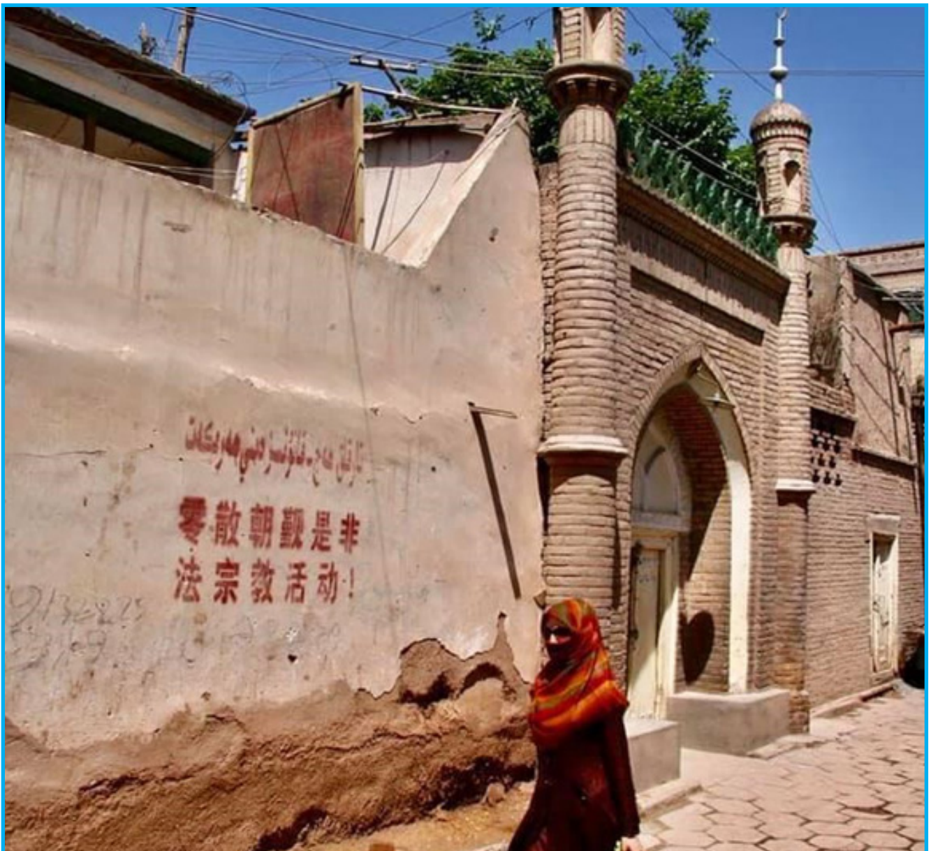
رەسىم 2: خىتاينىڭ شەرقىي تۈركىستاندىكى ئىسلامغا تۇتقان پوزىتسىيىسى. تامغا يېزىلغان خەت: تارقاق ھەج - قانۇنسىز دىنىي ھەرىكەت

بولغان شەرقىي تۈركىستانلىقلار بىلەن كۆچمەن خىتايلار ئوتتۇرىسىدا بىرقاتار مىللىي توقۇنۇشلارنى كەلتۈرۈپ چىقاردى. بۇ مەزگىلدە سوغۇق مۇناسىۋەتلەر ئۇرۇشىنىڭ ئاخىرلىشىشىغا ئەگىشىپ كۆپلىگەن سابىق كوممۇنىست دۆلەتلەردە دېموكراتىيەگە بولغان تەلەپ يۇقىرى كۆتۈرۈلۈشكە باشلىدى، ئەمما خىتايدا كۆتۈرۈلگەن بۇنىڭغا ئوخشاش تەلەپلەر ھاكىمىيەتنىڭ قاتتىق باستۇرىشىغا ئۇچرىدى. ئۇزۇن ئۆتمەي، شەرقىي تۈركىستاندا سىياسىي ھوقۇق ۋە دىنىي ئىبادەتكە قويۇلغان چەكلىمىلەر يەنە كۈچەيتىلدى. بۇ جەرياندا، 1996-يىلى خىتاي باشچىلىقىدا شاڭخەي ھەمكارلىق تەشكىلاتى قۇرۇلدى. بۇ تەشكىلات ئەمەلىيەتتە شەرقىي تۈركىستاننىمۇ ئۆز ئىچىگە ئالغان تۈركىستان (ئوتتۇرا ئاسىيا) رايونىدىكى تەرەققىياتلاردىن تۇغۇلغان ئەندىشەلەر