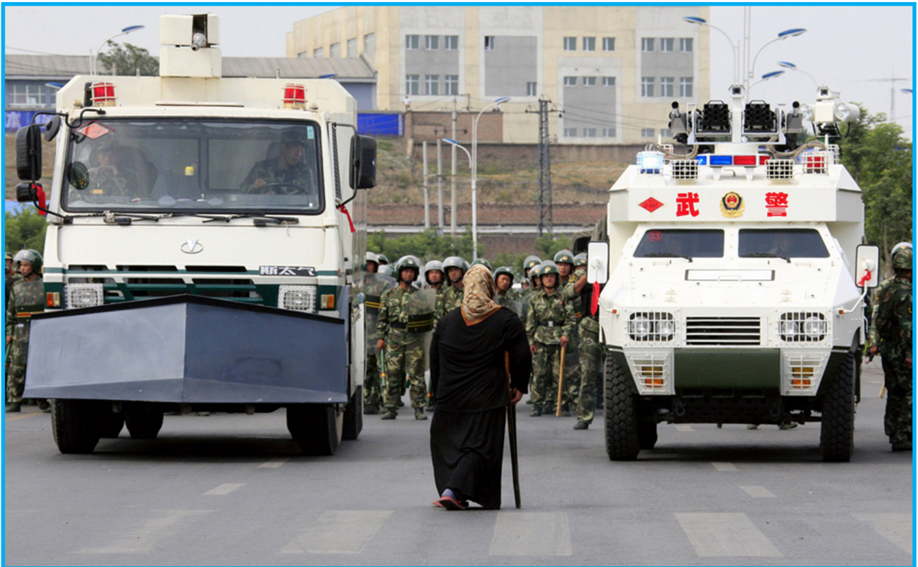
رەسىم 9: ئوغلىنى ئىزدەپ كۆچمە چىققان ۋە يالغۇز قارشى تۇرغان ئۇيغۇر ئانا

قوشنىسى يىغلاپ تۇرۇپ، 5 ئوغلىنىڭ خىتاي ساقچىلار تەرىپىدىن ئۆلتۈرۈلگەنلىكىنى، پەقەتلا بۇلاق بېشىدىن ئاق مەسجىت ۋە دۆڭكۆۋرۈككەچە بولغان قىسقىغىنە ئارىلىقتا 200دىن كۆپ ئۇيغۇرنىڭ ئۆلتۈرۈلگەنلىكىنى، بۇلارنىڭ كۆپۈنچىسىنىڭ ياش ئوغۇللار ئىكەنلىكىنى ئېيتىپ بەرگەن.