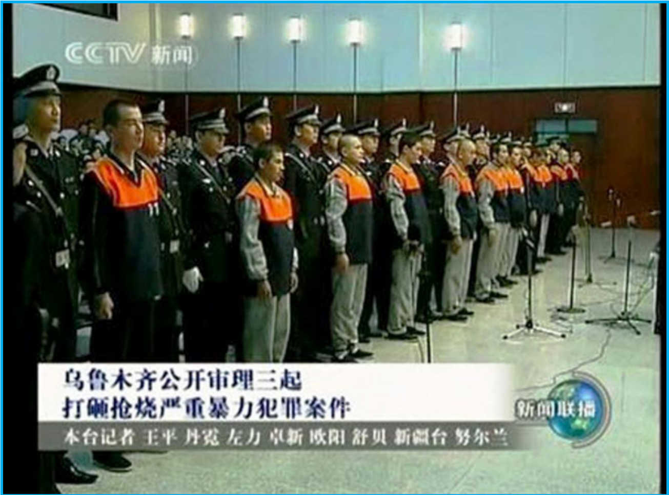
رەسىم 16: ئۇيغۇر ياشلىرى 5-ئىيۇلدىكى نامايىشقا قاتناشقانلىقى ئۈچۈن ئۆلۈم جازاسىغا ھۆكۈم قىلىندى

ھەرتۈرلۈك تاراتقۇ ۋاسىتىلىرىدا خىتاي دۆلىتىگە قارشى چىققانلارنىڭ ئاقىۋىتىنىڭ ئىنتايىن ناچار بولىدىغانلىقى توغرىسىدا تەھدىت نۇتۇقلىرى كەڭ تارقىتىلدى.