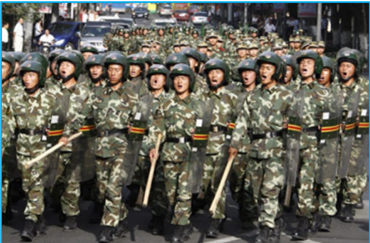
رەسىم 17: كۈچ كۆرسىتىپ ۋارقىراۋاتقان خىتاي ئەسكەرلىرى

7-ئاينىڭ 5-كۈنىدىن كېيىن، خىتاي ئەسكەر ۋە ساقچىلىرى شەرقىي تۈركىستاننىڭ بارلىق شەھەرلىرىدە نەچچە ئاي كۈچ كۆرسىتىش ئېلىپ باردى ۋە