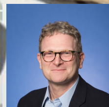
ختاينىڭ ئۇيغۇر قىرغىنچىلىقى